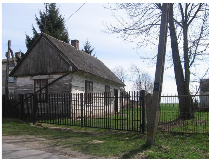
Przykład starszego typu rozmieszczenia budynków w zagrodzie