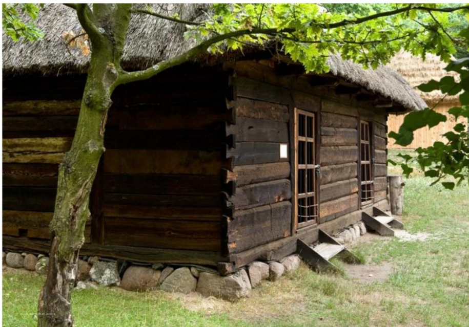
Zdj. Spichlerz z Rzecznowa

Na terenie gminy nie funkcjonuje placówka muzealna lub izba regionalna, gromadząca eksponaty związane z historią i kulturą ziemi rzeczniowskiej. Na terenie Muzeum Wsi Radomskiej eksponowane są dwa obiekty architektury drewnianej pochodzące z terenu gminy Rzecznów. Należy do nich wiatrak-koźlak z Grabowca należący do grupy młynów wiatrakowych. A także spichlerz z Rzecznowa wchodzący w skład tzw. zagrody z Alojzowa. Obiekt ten przedstawia interesujący przykład zabudowy gospodarczej charakterystycznej dla obszarów Przedgórze Łżeckiego.