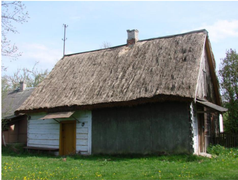
Dom drewniany w Pawliczce

W krajobrazie kulturowym gminy wyróżniają się zabytki sakralne, co jest charakterystyczne dla krajobrazów wiejskich województwa mazowieckiego (kościół, kaplice, cmentarze oraz obiekty małej architektury). Szczególną rolę w krajobrazie pełnią kapliczki, figury i krzyże przydrożne. Jedne odznaczają się ludową oryginalnością, inne wysoką jakością wykonania jako dzieła rzemiosła artystycznego. Są też lokalnymi świadkami historii oraz ciągłości narodowej i katolickiej tradycji. Występują obiekty wotywnie lub upamiętniające ważne wydarzenia. Ze względu na formę przeważają krzyże na cokole, pełniące też funkcje kapliczek. Występują kapliczki kubaturowe, kapliczka słupowa i figury przydrożne (Matki Boskiej, św. Floriana, św. Piotra i św. Jana Nepomucena)