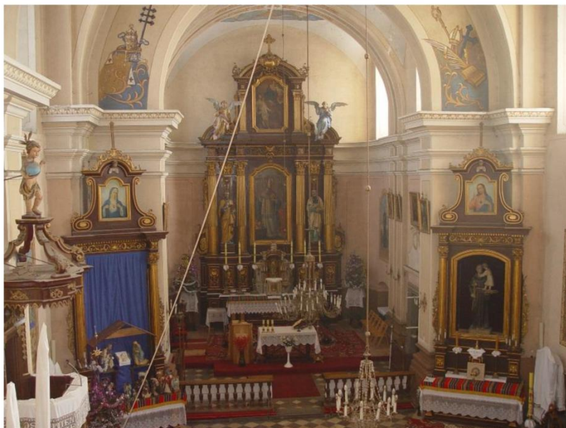
Wnętrze kościoła w Grabowcu

Wewnątrz przeważa wyposażenie barokowe. Z czasu budowy kościoła zachowały się portale XVII- wieczne. Do najcenniejszych zabytków należą: Pozostałości krucyfiks z łuku tęczowego, chrzcielnica kamienna z XVIII w., obrazy XVIII- wieczne m.in. „św. Mikołaj”, „Matka Boska Szkaplerzna”, „Matka Boska i Grzesznicy”, „Anna Samotrzeć”, drzwi rokokowe oraz monstrancje promieniste z XVIII w. Ołtarze (1 ćw. XX w.) i ambona (pocz. XIX w.) są neobarokowe.