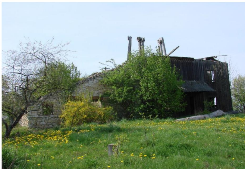
Ruiny młyna w Rzechowie Starym

Nie zostały zewidencjonowane zabytki techniki. Istniejące przykłady architektury tego typu pozostają w ruinie (młyn w Rzechowie Starym), albo utraciły wartości zabytkowe poprzez niewłaściwe realizacje budowlane (młyn murowany z kamienia w Rzecznowie).