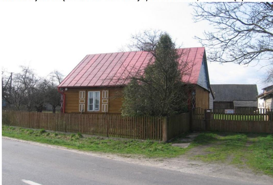
Typowa zagroda z domem usytuowanym frontem do drogi, równoległe ze stodołą w głębi

Aktualnie zewidencjonowano domy wiejskie z 1 poł. XX w., które są nieprzekształcone, posiadają detal architektoniczny i znajdują się w dobrym stanie. Na podstawie wykonania kwerendy dotyczącej budownictwa tradycyjnego budownictwa wiejskiego w gminie Rzecznów możliwe jest włączenie do GEZ kolejnych obiektów, stanowiących zabudowę wsi.