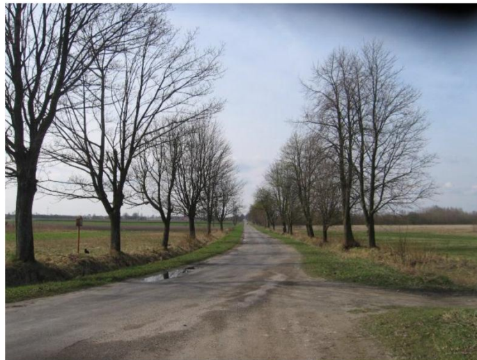
Jedna z lokalnych zadrzewionych dróg, tworząca aleję.

Krajobraz gminy Rzecznów jest otwarty, wiejski (z ośrodkiem małomiasteczkowym w Grabowcu), rolniczy, płaski, urozmaicony elementami krajobrazu naturalnego: doliny rzek, tereny leśne, kępy drzew, łąki.