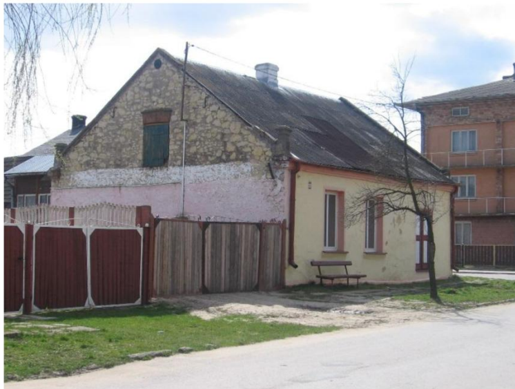
Dom przyrynkowy w Grabowcu, 1 poł. XX w.

Z istniejących budynków przyrynkowych można wnioskować, że zabudowa zawsze była parterowa, w części drewniana i murowana z kamienia lokalnego. Piętrowe domy pojawiły się dopiero po poł. XX w.