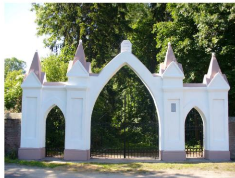
Ilustracja 6. Brama wjazdowa

Lamus w założeniu pałacowym w Staroźrebach był budynkiem drewnianym, parterowym, krytym dachówką, wzniesionym na planie sześciokąta. Usytuowany był w sąsiedztwie pałacu, po jego południowo - wschodniej stronie. Został rozebrany po roku 1993.