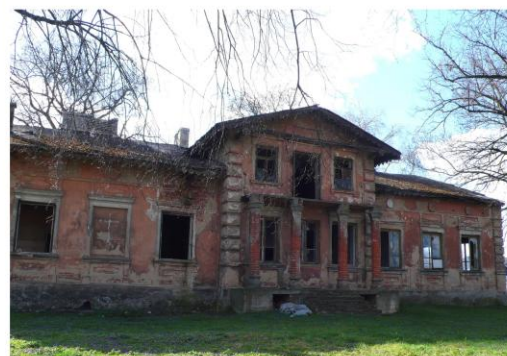
Ilustracja 4. Dwór murowany w Nowej Górze

Brama wjazdowa zespołu pałacowego w Staroźrebach wzniesiona w 1912 r. w stylu neogotyckim. Usytuowana jest w północno – wschodniej części założenia parkowego. Wybudowana z cegły i otynkowana, w formie portyku, wsparta na czterech filarach, trójprzelotowa. W osi środkowej znajduje się przejazd bramowy, natomiast po bokach furtki.