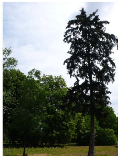
Ilustracja 10. Park w Bromierzu