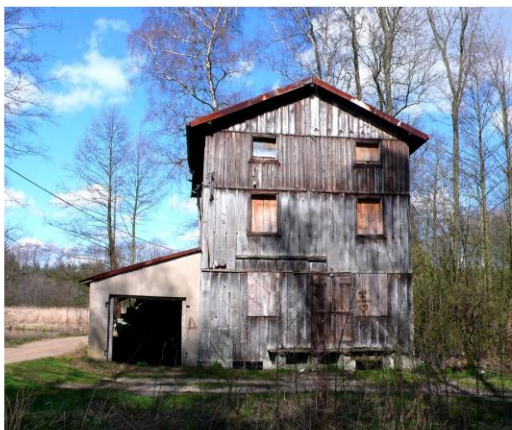
Ilustracja 15. Młyn wodny w Bylinie

Wiatrak drewniany w Staroźrebach przy ulicy Wiatracznej nr 8 , wybudowany jako drewniany jako wiatrak typu koźlak w 1927 roku, następnie przebudowany na młyn elektryczny w 1995 r. Użytkowany był do roku 2003, zachowany jest w bardzo dobrym stanie z pełnym wyposażeniem wewnętrznym.