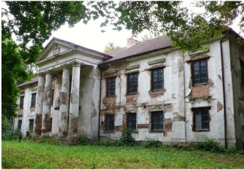
Ilustracja 7. Pałac murowany w Starożrebach