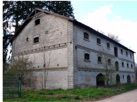
Ilustracja 2. Spichlerz w Bromierzyku

Dwór murowany w Nowej Górze wzniesiony w stylu eklektycznym w 1880 r.. Po II wojnie światowej do 1963 r. mieściła się w nim szkoła podstawowa, następnie przedszkole, biblioteka publiczna i mieszkania nauczycieli. Obecnie dwór jest opuszczony i w bardzo złym stanie technicznym. Usytuowany jest w centrum wsi, w zachodniej części niewielkiego parku krajobrazowego. Budynek jest parterowy, częściowo podpiwniczony, z mieszkalnym poddaszem i kryty dachem dwuspadowym. Zbudowany został na planie wydłużonego prostokąta, 9-osiowy z trójosiowymi ryzalitami w osiach elewacji frontowej i tylnej. Posiada dwutraktowy układ wnętrza z sienią i salonem na osi, elewacje na niewysokim cokole z szerokim gzymsem kordonowym i podokapową dekoracją drewnianą o charakterze ludowym.