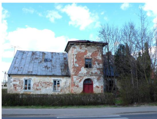
Ilustracja 17. Dom mieszkalny – dawny zajazd w Staroźrebach

Wśród innych obiektów zabytkowych znajduje się dom mieszkalny – dawny zajazd w Staroźrebach przy ulicy Płockiej 47 . Wzniesiony został w I połowie XIX w. jako budynek parterowy z piętrowym ryzalitem od strony elewacji frontowej, podpiwniczony, murowany z cegły tynkowanej, posadowiony na fundamentach z łamanego kamienia polnego. Zajazd położony jest w centrum miejscowości po północnej stronie drogi wojewódzkiej nr 567, z elewacją frontową od strony południowej. Budynek przykryty jest dachem dwuspadowym.