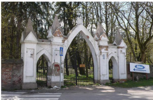
Ilustracja 5. Brama wjazdowa - obecnie