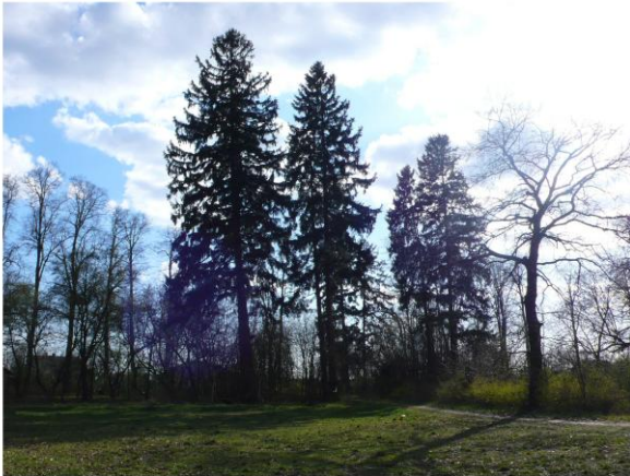
Ilustracja 11. Park w Bromierzyku

Park w Bromierzyku powstał na przełomie XIX i XX w. jako park krajobrazowy. Zajmuje powierzchnię 4,4 ha. Na terenie parku oraz w jego bezpośrednim sąsiedztwie i na terenie wsi brak jest zbiorników wodnych. Park w pierwotnej wersji miał kształt pięciokąta. Z czytelnego układu pozostała jedynie gruntowa droga dojazdowa do dworu leżąca na przedłużeniu drogi prowadzącej z miejscowości Bromierzyk Nowy. Układ pozostałych alei jest mocno zniekształcony i mało czytelny. Park posiada mało zróżnicowany drzewostan, przeważają gatunki liściaste głównie: lipa drobnolistna, brzoza brodawkowata oraz jesion wyniosły. Wśród gatunków iglastych występuje głównie świerk pospolity.