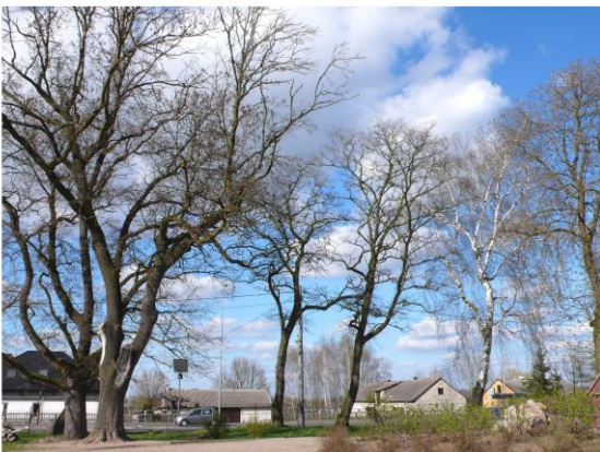
Ilustracja 13. Park w Nowej Górze

Park w Nowej Górze powstał na początku XIX w. i zajmował powierzchnię 1,3 ha. Obecnie jest to niewielki park krajobrazowy, zachowany w stanie szczątkowym z uwagi na późniejszą lokalizację na jego terenie budynku ośrodka zdrowia, szkoły oraz boiska szkolnego. Usytuowany jest bezpośrednio przy drodze krajowej nr 10, po jej południowej stronie. Podjazd główny znajduje się po stronie wschodniej dworu, natomiast założenie o charakterze parkowo- użytkowym po przeciwnej stronie budynku. Kompozycja najbliższego otoczenia dworu wiązała się z główną osią budynku. Osiowość tego założenia podkreślają lipy symetrycznie rozmieszczone po obu stronach elewacji parkowej - wschodniej i gazon na osi po stronie elewacji frontowej – zachodniej. Park