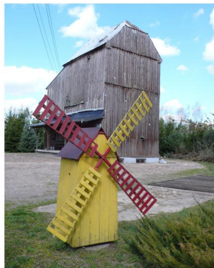
Ilustracja 16. Wiatrak drewniany w Staroźrebach

Wśród innych obiektów zabytkowych znajduje się dom mieszkalny – dawny zajazd w Staroźrebach przy ulicy Płockiej 47 . Wzniesiony został w I połowie XIX w. jako budynek parterowy z piętrowym ryzalitem od strony elewacji frontowej, podpiwniczony, murowany z cegły tynkowanej, posadowiony na fundamentach z łamanego kamienia polnego. Zajazd położony jest w centrum miejscowości po północnej stronie drogi wojewódzkiej nr 567, z elewacją frontową od strony południowej. Budynek przykryty jest dachem dwuspadowym.