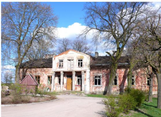
Ilustracja 3. Dwór murowany w Nowej Górze

Dwór murowany w Nowej Górze wzniesiony w stylu eklektycznym w 1880 r.. Po II wojnie światowej do 1963 r. mieściła się w nim szkoła podstawowa, następnie przedszkole, biblioteka publiczna i mieszkania nauczycieli. Obecnie dwór jest opuszczony i w bardzo złym stanie technicznym. Usytuowany jest w centrum wsi, w zachodniej części niewielkiego parku krajobrazowego. Budynek jest parterowy, częściowo podpiwniczony, z mieszkalnym poddaszem i kryty dachem dwuspadowym. Zbudowany został na planie wydłużonego prostokąta, 9-osiowy z trójosiowymi ryzalitami w osiach elewacji frontowej i tylnej. Posiada dwutraktowy układ wnętrza z sienią i salonem na osi, elewacje na niewysokim cokole z szerokim gzymsem kordonowym i podokapową dekoracją drewnianą o charakterze ludowym.