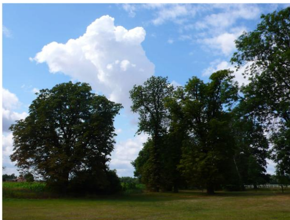
Ilustracja 9. Park w Bromierzu

Park w Bromierzu powstał w II poł. XIX w. i na początku XX w.. Zajmuje powierzchnię 4,25 ha. Aleja dojazdowa z jednostronnym zadrzewieniem kasztanowcami prowadziła na dziedziniec wjazdowy znajdujący się przed zachodnią elewacją dworu. Dziedziniec wjazdowy tworzył trawnik z niską zielenią ozdobną i pojedynczymi drzewami na zewnętrznym obrzeżu drogi okalającej trawnik. W centralnej części parku usytuowany został duży staw o nieregularnym zarysie brzegów. Zadrzewienie jego brzegów stanowiły grupy drzew z dominantą lipy i olszy oraz pojedyncze drzewa takie jak kasztanowce i wierzby. Drugi mniejszy staw zlokalizowano w części północnej. Układ komunikacyjny na terenie parku tworzyły alejki spacerowe prowadzące do stawów i nad ich brzegami. Park posiada mało zróżnicowany drzewostan, występują gatunki liściaste jak olsza czarna, kasztanowiec biały i brzoza brodawkowata oraz robinia akacyjowa, wierzba biała i sporadycznie dąb szypułkowy i topola. Wśród gatunków iglastych występuje modrzew europejski i świerk pospolity.