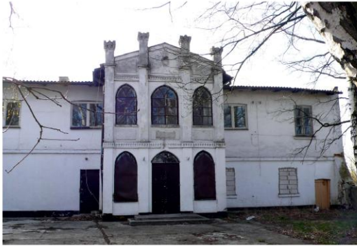
Ilustracja 1. Dwór murowany w Bromierzyku