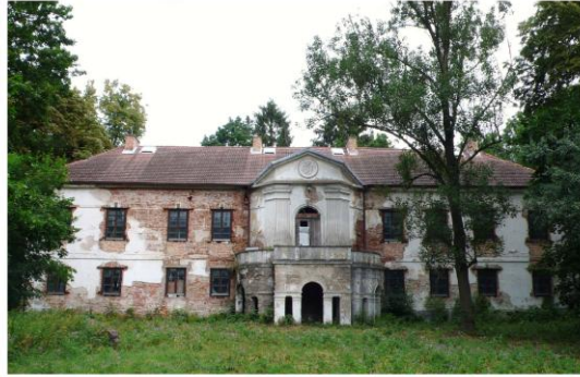
Ilustracja 8. Pałac murowany w Starożrebach

Założenia dworskie w Bromierzu, Bromierzyku, Nowej Górze i Starożrebach stanowią elementy zespołów dworsko-parkowych z zachowanymi założeniami parkowymi .