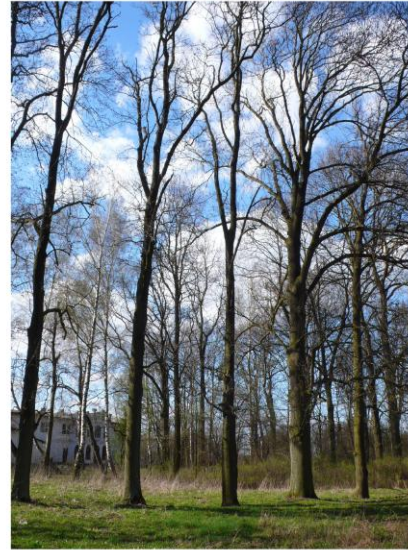
Ilustracja 12. Park w Bromierzyku

Park w Nowej Górze powstał na początku XIX w. i zajmował powierzchnię 1,3 ha. Obecnie jest to niewielki park krajobrazowy, zachowany w stanie szczątkowym z uwagi na późniejszą lokalizację na jego terenie budynku ośrodka zdrowia, szkoły oraz boiska szkolnego. Usytuowany jest bezpośrednio przy drodze krajowej nr 10, po jej południowej stronie. Podjazd główny znajduje się po stronie wschodniej dworu, natomiast założenie o charakterze parkowo- użytkowym po przeciwnej stronie budynku. Kompozycja najbliższego otoczenia dworu wiązała się z główną osią budynku. Osiowość tego założenia podkreślają lipy symetrycznie rozmieszczone po obu stronach elewacji parkowej - wschodniej i gazon na osi po stronie elewacji frontowej – zachodniej. Park