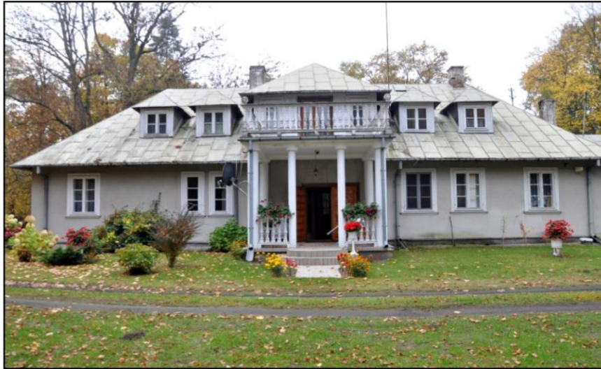
Rysunek 6. Suche, dwór