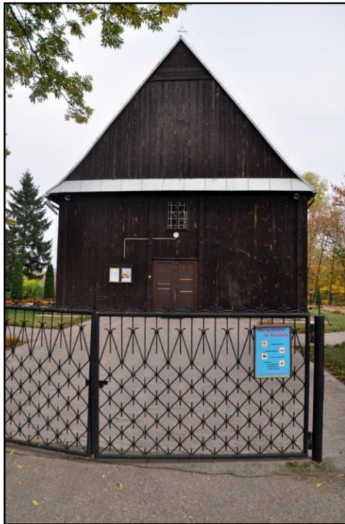
Rysunek 3. Węgrzynowo, kościół

Cenny przykład drewnianej architektury sakralnej z XVII wieku. Obiekt powstał w 1694 roku, był przebudowywany w XVIII i XIX wieku. Wykonany w konstrukcji zrębowej, zewnątrz szalowany. Kościół o prostej architekturze, trójnawowy. Zwieńczony sygnaturką. Do budynku przylega dzwonnica z XVII wieku.