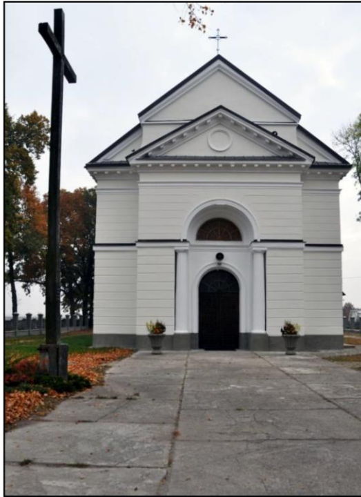
Rysunek 1. Płoniawy Bramura, kościół