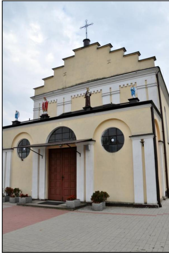
Rysunek 4. Jaciążek, kościół