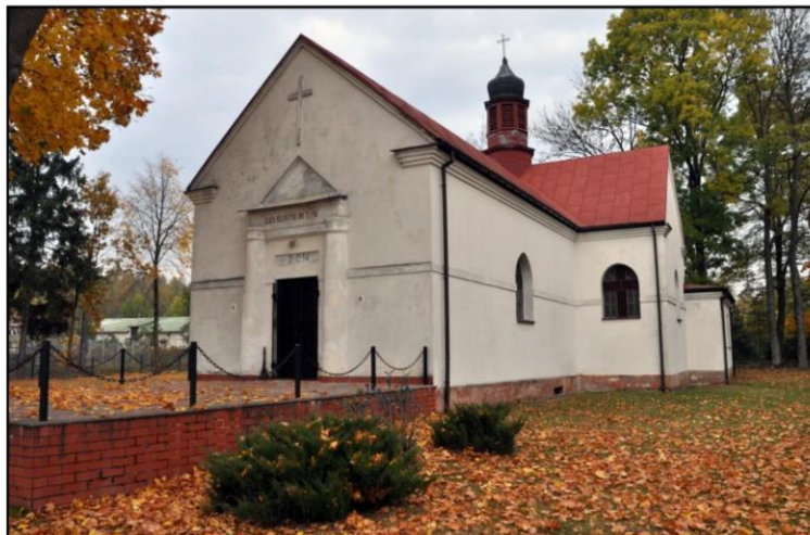
Rysunek 2. Stary Podoś, kaplica

Wzniesiona w roku 1853, dzięki staraniom Walentyny Łysińskiej. Obiekt bezstylowy, niewielkich rozmiarów, z cegły, otynkowany. Otwór drzwiowy ozdobiony dwoma półkolumnami tokańskimi podtrzymującymi architraw i trójkątny fronton. Partie boczne zdobione trój schodkowym fryzem. Na łączeniu nawy i transeptu sygnaturka.