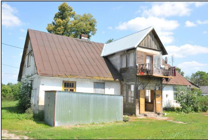
Rysunek 5. Jaciążek, dwór

Dwór drewniany z końca XIX. W późniejszym okresie przebudowywany. Zachowały się nieliczne fragmenty parku krajobrazowego, będącego niegdyś ozdobą dworu. Jest to budynek parterowy, z użytkowym poddaszem. Posiada wysuniętą część z wejściem.