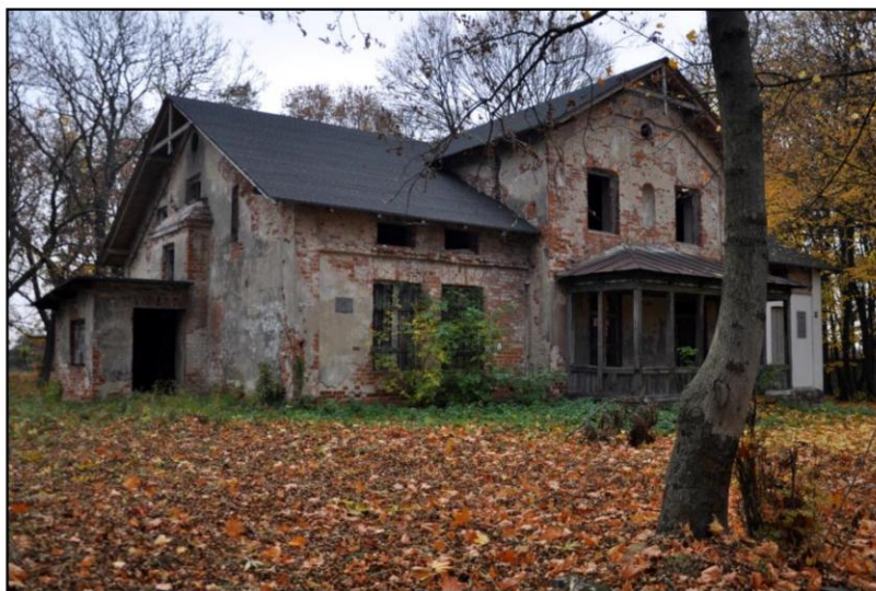
Rysunek 7. Szczuki, dwór

Dwór murowany z 1870 roku, pierwotnie otynkowany. W latach 1886-1889 mieszkała w nim dwukrotna polska noblistka Maria Skłodowska. Budynek mocno zniszczony. Parterowy, pierwotnie z użytkowym poddaszem. Część wejściowa wysunięta z drewnianym gankiem.