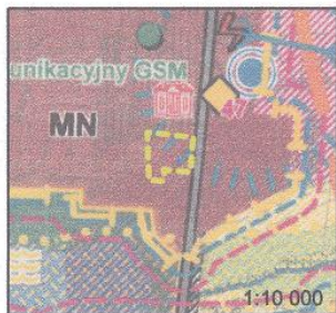
WYRYS ZE STUDIUM UWARUNKOWAŃ I KIERUNKÓW ZAGOSPODAROWANIA PRZESTRZENNEGO GMINY JASTRZĄB

Projekt planu sporządzono na kopiach mapy przyjętej do zasobów Powiatowego Ośrodka Dokumentacji Geodezyjnej i Kartograficznej Starostwa Powiatowego w Szydłowcu (nr licencji GN.6642.2.230.2016_1430_P)