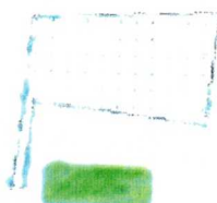
Zbiornik wodny w Kroczewie

Załącznik nr 2 do Uchwały nr 343/XLVII/22 z dnia 9 listopada 2022r.