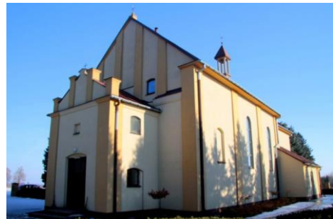
Fotografia 1. Widok na kościół św. Floriana w Łagowie.