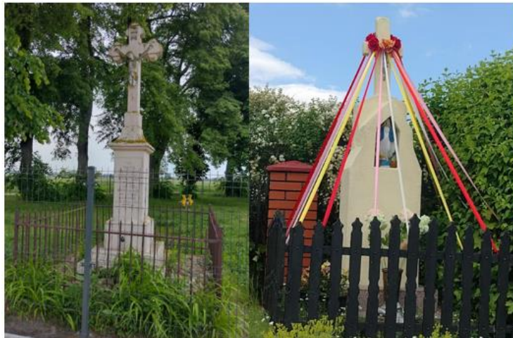
Fotografia 3. Przykład kapliczek i krzyży w Grabowie i Przyłęk.