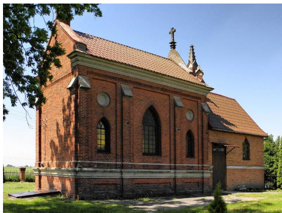
Fotografia 2. Widok na kaplicę grobową rodziny Lenkiewiczów.

Budynek kaplicy wybudowany został w stylu neogotyckim, murowany z cegły o wiązaniu krzyżowym. Został wzniesiony na rzucie prostokąta. Posiada jednokondygnacyjną bryłę. Kaplica przykryta dachem dwuspadowym, pokrycie z dachówki. Gzyms koronujący wielokrotnie profilowany, wydatny. Pod gzymsem biegnie fryz ząbkowany. Elewacje boczne ujęte są płaskimi przyporami, między którymi znajdują się prostokątne płyciny z ostrołukowymi otworami okiennymi. Cokół budynku wydatnie ogzymśowany. Wnętrze trójprzęsłowe, środkowe przęsło jest na rzucie kwadratu.