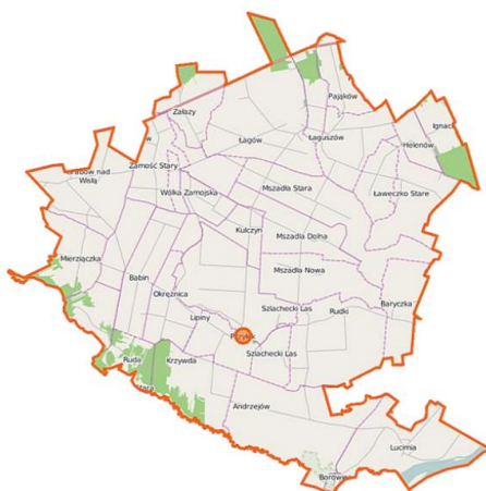
Rysunek 1. Położenie gminy na tle powiatu i województwa.

Granice administracyjne gminy przedstawia poniższy rysunek.