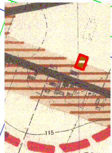
Wzrost Składnik uwzględniony i kierunek zagospodarowania przestrzennego Miasta i Gminy Gablin