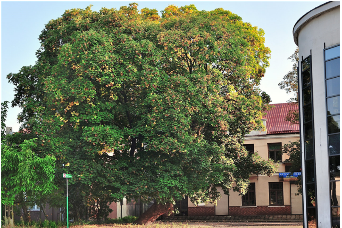
Fotografia przedstawiająca drzewo

Załącznik Nr 2 do uchwały Nr LXXXI/431/2022 Rady Miejskiej w Karczewie z dnia 29 grudnia 2022 r.