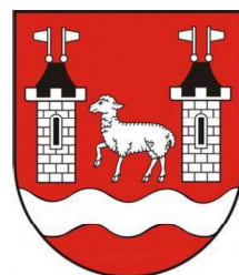
HERB POWIATU PIASECZYŃSKIEGO

Załącznik nr 2 do Statutu Powiatu Piaseczyńskiego