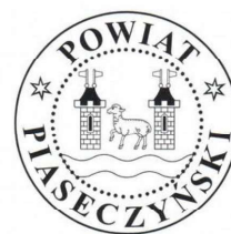
PIECZĘĆ POWIATU PIASECZYŃSKIEGO

W polu czerwonym, nad rzeką srebrną, także baranek między dwiema wieżami blankowanymi srebrnymi, każda z jednym oknem czarnym i dwoma proporcami srebrnymi na daszku czarnym.