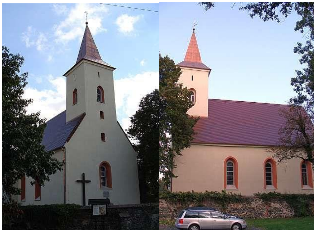
Rys. 2. Kościół pw. Imienia Marii w Szydłowcu Śląskim