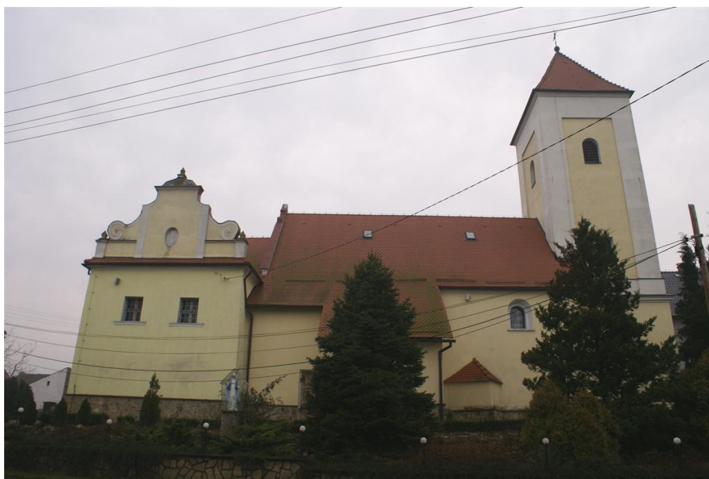
Rys. 3. Kościół pw. św. Mikołaja w Grabinie