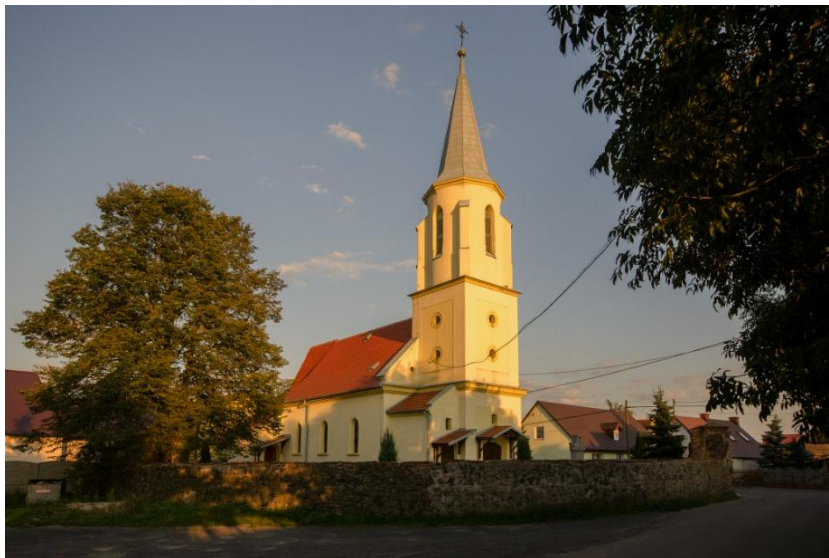
Rys. 4. Kościół pw. św. Trójcy w Graczach

po ponownym erygowaniu parafii, kościół w Graczach staje się również kościołem parafialnym.