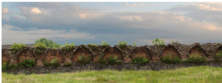
Rys. 11. Pozostałości średniowiecznych murów miejskich

Niemodlińskie mury miejskie stanęły w miejscu starych wałów prawdopodobnie dopiero w późnym średniowieczu. Linia murów miejskich, chroniła społeczność miasta od strony południowej. Wybudowanych one były pomiędzy zamkiem i kościołem. Wzmocnione były wieżą bramną tzw. nyską, usytuowaną po stronie zachodniej, obok kościoła, oraz ośmioma innymi, mniejszymi wieżami obronnymi, ulokowanymi wzdłuż murów. Od wschodu również znajdowała się wieża bramna, zwana opolską. Obie bramy zostały rozebrane w XIX w. Obecnie zachowały się pozostałości murów miejskich Niemodlina.