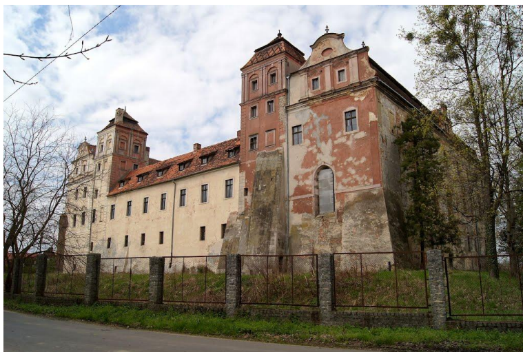
Rys. 6. Zamek w Niemodlinie

Zamek to wielka, późnorennesansowa rezydencja otoczona zabudowaniami przyzamkowymi. Wiedzie do niego budynek bramny z drugiej połowy XVIII wieku, a wieża prowadzi na dziedziniec zamkowy. Budowla wzniesiona została w kilku etapach w latach 1573-77, 1589-92, a ostatecznie w roku 1610. Zachowana pełna zabudowa zamku czteroskrzydłowego wokół prostokątnego dziedzińca otoczonego arkadami powtarza znany z innych przykładów późnorennesansowy typ wielkiej rezydencji. Warto również zwrócić uwagę na otoczenie - mały park zamkowy. Ukształtowany został w XIX i XX w. w miejscu dawnych ogrodów i parku w stylu angielskim. Rośnie tu wiele cennych drzew, pośród nich wiekowe cisy. Uwagę przykuwają również kamienne, barokowe figury. Są to postacie świętych: Jana Nepomuka i Antoniego oraz Wendelina i Florianiana. Znajdują się one przy osiemnastowiecznym moście nad dawną fosą. Na zamku kręcono sceny do filmu "Jasminum" Jana Jakuba Kolskiego. Do dziś Obecny zamek jest w rękach prywatnych, nie jest udostępniony do zwiedzania.