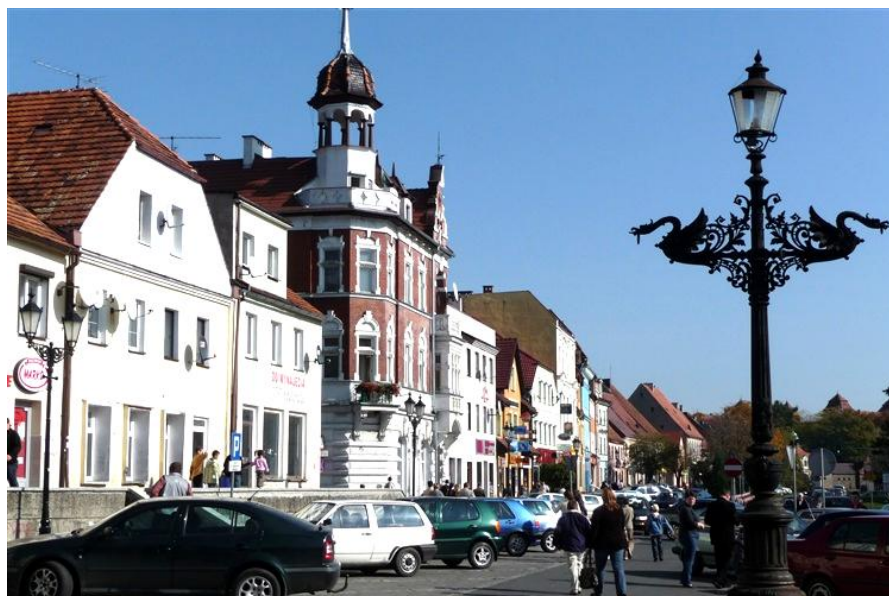
Rys. 10. Zabudowa rynku w Niemodlinie

Charakteryzuje się unikalnym, średniowiecznym układem urbanistycznym (wrzecionowaty). To rzadko spotykany przykład tzw. „ulicówki”, czyli rynku położonego wzdłuż jednej ulicy, z zespołem kamieniczek pochodzących głównie z XVIII i XIX w. zakończony z jednej strony kościołem, a z drugiej zamkiem. Jest wpisany do rejestru zabytków, a w związku z tym objęty jest rygorami ochrony konserwatorskiej, wynikającymi z Ustawy z dnia 23 lipca 2003 r. o Ochronie Zabytków i Opiece nad Zabytkami (Dz. U. nr 162, poz. 1568 z późniejszymi zmianami). Jako najcenniejszy w gminie układ przestrzenny chroniony jest również poprzez zapisy miejscowego planu zagospodarowania przestrzennego Śródmieścia Niemodlina zatwierdzonego Uchwałą Nr XII/96/99 Rady Miejskiej w Niemodlinie z 30.09.1999 r. (Dz. Urz. Woj. Opolskiego z 15-04- 2002 r. nr 30 poz. 460).