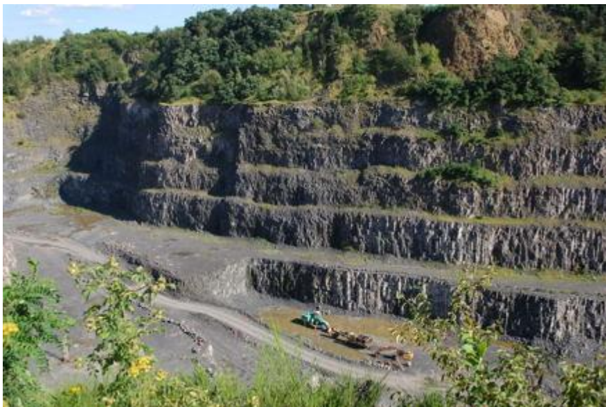
Rys 9. Kopalnia w Graczach

Po zakończeniu działań wojennych wznowiono produkcję w 1946 r. W 1997 r. firma przeszła prywatyzację. Do dziś stanowi ważny ośrodek przemysłowy w gminie.