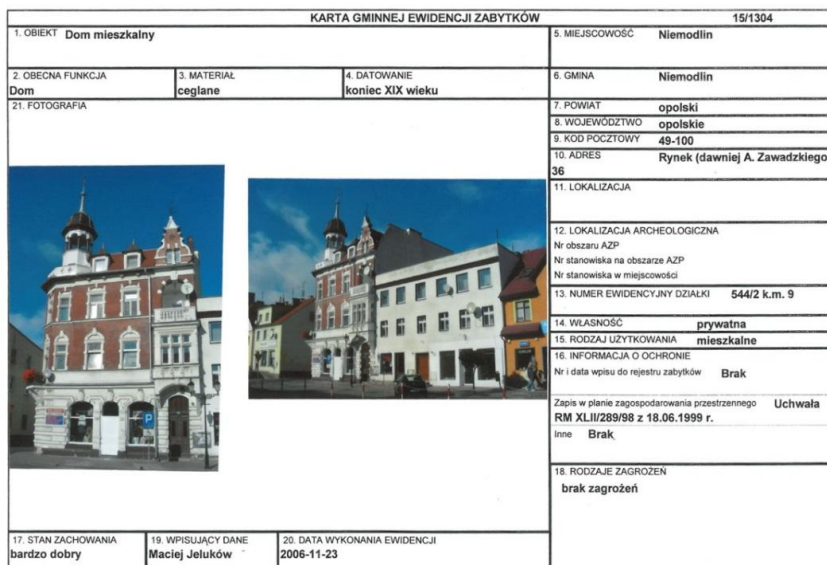
Rys. 10. Przykładowa karta gminnej ewidencji zabytków gminy Niemodlin, awers

Zgodnie z ustawą o ochronie zabytków i opiece nad zabytkami z dnia 23 lipca 2003 r. (Dz. U. z 2003 r. Nr 162 poz. 1568) oraz Rozporządzeniem Ministra Kultury i Dziedzictwa Narodowego z dnia 26 maja 2011 r., w sprawie prowadzenia rejestru zabytków krajowej, wojewódzkiej i gminnej ewidencji zabytków oraz krajowego wykazu zabytków skradzionych lub wywiezionych za granicę niezgodnie z prawem (Dz. U. nr 113, poz. 661), jest prowadzona w formie zbioru kart adresowych zabytków nieruchomości z terenu gminy.