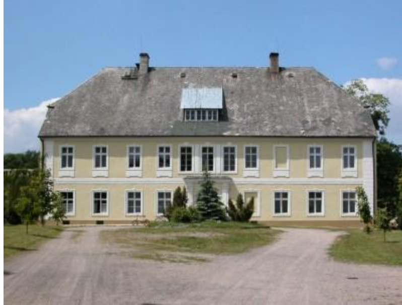
Rys.5. Krasna Góra, dwór