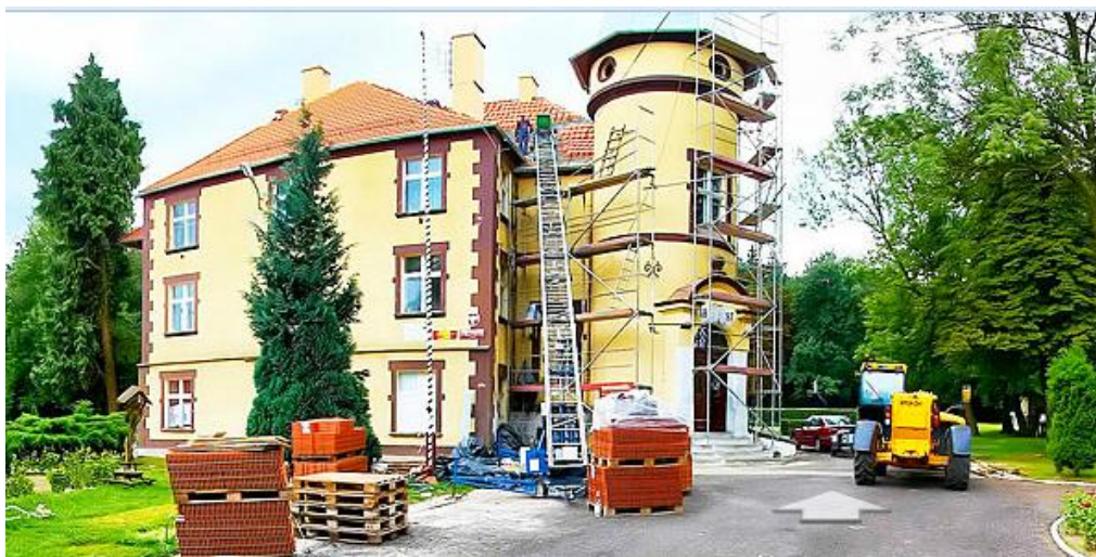
Rysunek 6. Rogi, dwór

Budynek powstał ok. 1800 r. Po niemal 100 latach w 1897 r. został wzbogacony o dodatkowe skrzydło mieszkalne. Początkowo stanowił mieszkanie dla miejscowych dzierżawców. W latach 1896-1916 zamieszkał tu hrabia Hans Praschma. Dziś w budynku znajduje się szkoła. Jest to obiekt 3-kondygnacyjny z okrągłą wieżą widokową. Pierwsze piętro stanowi piano nobile. Dwór w bardzo dobrym stanie.