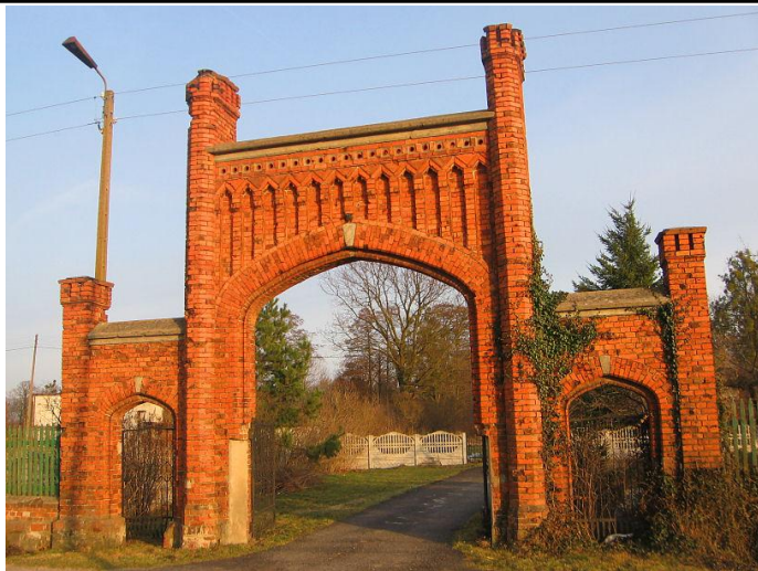
Rys. 7. Pozostałości zabudowy dworskiej w Szydłowcu