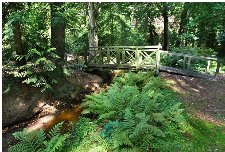
Rys. 12. Park w Lipnie

źródło. Część parku stanowił ogród dendrologiczny. Rośnie tu wiele okazów drzew także egzotycznych. Do najciekawszych należy ambrowiec amerykański, azalia japońska, grójecznik japoński, różanecznik fioletowy, mahonia pospolita. Wiele okazów zakwalifikowano do najstarszych w Polsce, wśród z nich tulipanowiec amerykański (prawie 200 – letni okaz mierzy w obwodzie 418 cm i ma 30 m wysokości).