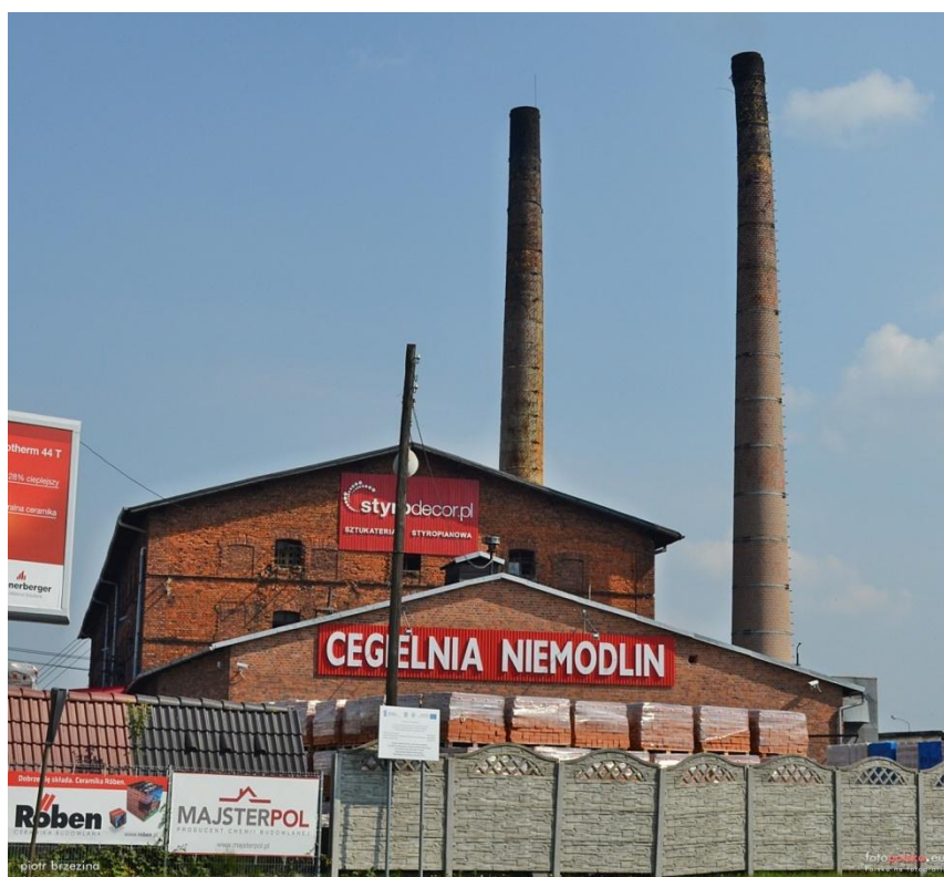
Rys. 8. Cegielnia w Niemodlinie

Niedaleko linii kolejowej znajduje się największa w mieście cegielnia. Należała do spółki Wiesnera. Jej głównym założeniem była produkcja dachówek. Stanowiła znaczące miejsce pracy. Zatrudniała w 1922 r. ok. 80 pracowników. Obiekt użytkowany.