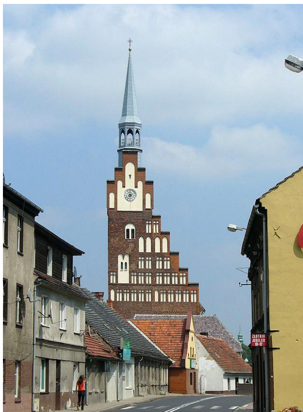
Rys.1 Kościół parafialny pw. Wniebowzięcia NMP w Niemodlinie