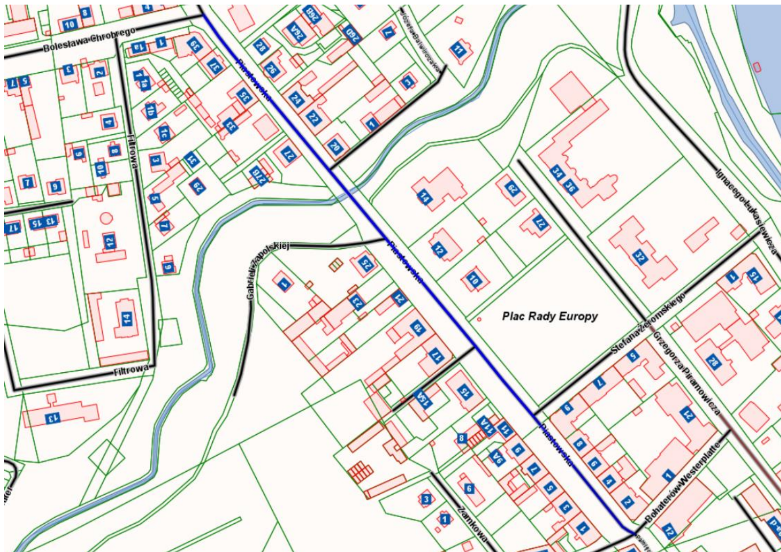
Przebieg drogi gminnej – ul. Piastowskiej na osiedlu Stare Miasto

Załącznik nr 2 do Uchwały Nr XVII/134/15 Rady Miasta Kędzierzyn-Koźle z dnia 10 września 2015r.