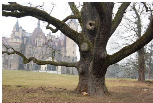
Moszna, park