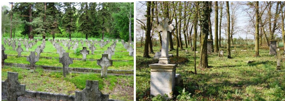
Łambinowice, Stary Cmentarz Jeniecki, fot. C. Hadamik.