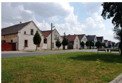
Jemielnica, układ ruralistyczny, zabudowa pierzei ulicy wiejskiej, fot. C. Hadamik.

Historyczne układy wiejskie województwa opolskiego należą do najlepiej zachowanych w skali kraju. Układy typowe to owalnica (np. Jędrzychów) oraz ulicówka (np. Pępice), przeważnie z dominantami w postaci kościołów, dzwonnicy wiejskich lub pałaców. Nie brak też układów rzadkich, wyjątkowych i przez to zasługujących na specjalną ochronę. Należą do nich: układ okólny zamknięty (Księża Pole, Czerwona), układ koncentryczny (Pokój) lub rzędówka brzegowa o dwóch równoległych drogach wzdłuż płynącego środkiem potoku (Grobniki, Łąka Prudnicka, Grodziec). W wielu wsiach zachowane są też charakterystyczne dla różnych rejonów Opolszczyzny rozplanowania zagród, a także ulice wiejskie z gęstą zabudową złożoną z domów ustawionych szczytami do ulicy. Cztery układy ruralistyczne zostały w latach 50. i 60. wpisane do rejestru zabytków (Grobniki, Jemielnica, Ścinawa Nyska i Pilszcz, wobec którego prowadzona jest procedura skreślenia z rejestru). Powołany przez Wojewodę Opolskiego zespół, który w latach 2008-2010 prowadził waloryzację zabytkowego zasobu wsi w granicach regionu, ocenił na podstawie szeregu przyjętych kryteriów, że 53 wsie Opolszczyzny mają wybitne, bardzo wysokie oraz wysokie walory zasobu kulturowego. Wśród nich do najcenniejszych zaliczono: Stary Paczków, Złotogłowice, Klisino, Jemielnicę, Strzeleczyki, Różynę i Raclawice Śląskie.