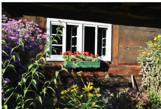
Opole, Muzeum Wsi Opolskiej, fot. C. Hadamik.