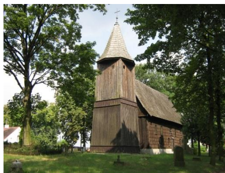
Gierałcice, kościół pw. Św. Michała Archanioła, fot. C. Hadamik.