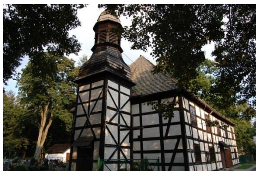
Radomierowice, kościół filialny pw. Wniebowzięcia NMP, fot. C. Hadamik.

Z czterech zachowanych na Opolszczyźnie budynków dawnych synagog (w Opolu, Praszce, Brzegu i Głogówku) dawny kształt architektoniczny zachowały neoklasycystyczny obiekt w Praszce oraz synagoga w Opolu. Ta ostatnia, gruntownie wyremontowana, mieści obecnie siedzibę TVP3 Opole.