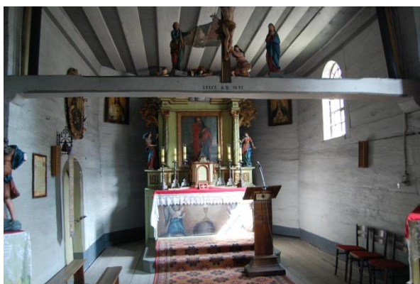
Borki Wielkie

Do zabytków ruchomych zaliczamy m.in. dzieła sztuki i rzemiosła artystycznego, zabytkowe wyposażenie obiektów sakralnych, zamków (Brzeg, Głogówek, Prószków), ratuszy (Brzeg, Otmuchów, Byczyna), jak i niekubaturowe kapliczki, malowidła ścienne, krzyże przydrożne i pokutne. Do rejestru wpisanych jest ponad 7000 zabytków. Na terenie Opolszczyzny działa 14 muzeów, które prezentują zbiory malarstwa, rzeźby, zabytków archeologicznych, numizmatycznych i innych. W Opolu działa między innymi Muzeum Diecezjalne, z bogatymi zbiorami sztuki sakralnej. W 2008 roku Muzeum Śląska Opolskiego zostało wyremontowane i rozbudowane o nową galerię wystawową. Zaadaptowało również kamieniczkę na ul. Wojciecha, urządzając w niej muzeum kamienicy mieszczańskiej z pełnym wystrojem z epoki dla poszczególnych mieszkań. Oprócz muzeów miejscami skupiającymi zabytki ruchome są wnętrza obiektów sakralnych. Najliczniej prezentowane są jednolite w charakterze wyposażenia barokowe (ok. 200). Z gotyku zachowało się dużo kamiennych chrzcielnic, freski naścienne, drewniane krucyfiksy i figury świętych. Okres renesansu pozostawił wiele epitafiów, drewnianych ołtarzy, ambon i chrzcielnic.