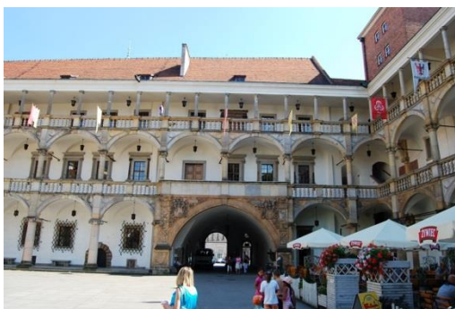
Brzeg, zamek, fot. C. Hadamik.