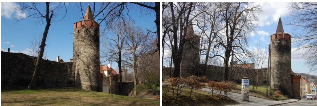
Paczków, fortyfikacje miejskie, fot. C. Hadamik.

biskupa Przeclawa z Pogorzeli, zwanego fortyfikatorem księstwa nyskiego. Wewnątrz murów zachowało się w stanie niemal nienaruszonym pierwotne rozplanowanie i parcelacja z czasów lokacji. Pod tymi względami miasto jest ewenementem pośród ośrodków lokacyjnych na ziemiach polskich o metryce średniowiecznej. Położenie Paczkowa przy granicy nyskiego księstwa biskupów wrocławskich (istniejącego do 1810 r.) sprawiło, że nigdy nie zdecydowano się na rozbiórkę murów obronnych (w XIX stuleciu zasypano jedynie fosę, aby ułatwić komunikację z rozwijającymi się przedmieściami). W XVI w., w czasie tzw. trwogi tureckiej, inkastelowano kościół farny pw. Św. Jana Ewangelisty, stojący w pobliżu muru miejskiego, obniżając dachy nawy i zakrywając je wysoką attyką, zaopatrzoną w otwory strzelcze. We wnętrzu świątyni zachowały się sklepienia sieciowe i gwiaździste. Większość zachowanych kamienic mieszczańskich pochodzi z XVIII i XIX w., choć można też oglądać kilka starszych, XVI-wiecznych domów, z których dom nr 3 przy Rynku zdobiony jest w technice sgraffito. Przetrwała również do dziś renesansowa wieża ratusza, którego korpus przebudowano w XIX stuleciu. Wszystkie te walory powodują, że Paczków jest wręcz modelowym przykładem harmonijnego rozwoju średniowiecznego miasta.