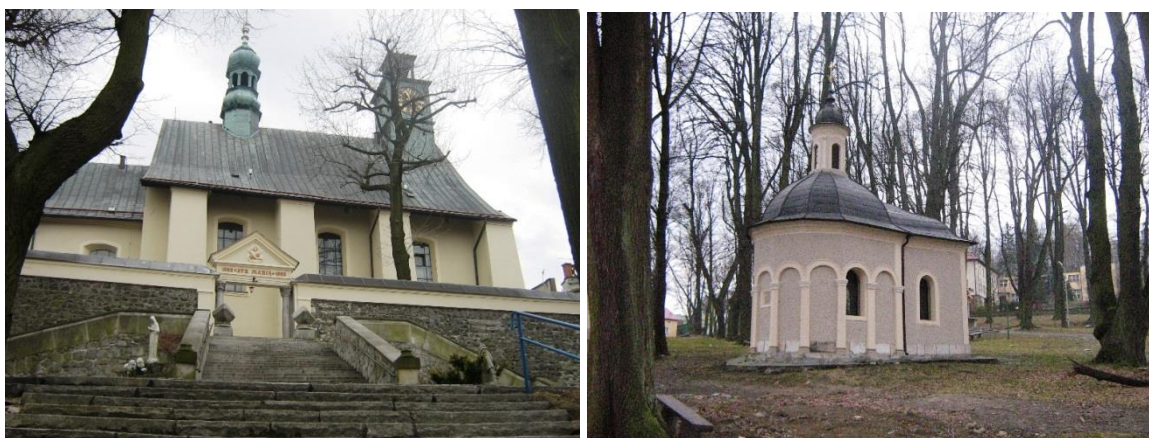
Góra Świętej Anny, bazylika św. Anny i jedna z kaplic kalwaryjskich