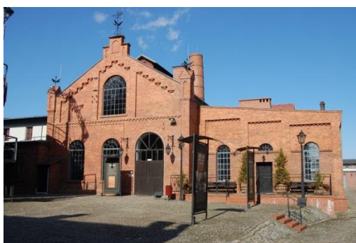
Paczków, Muzeum Gazownictwa, fot. C. Hadamik.