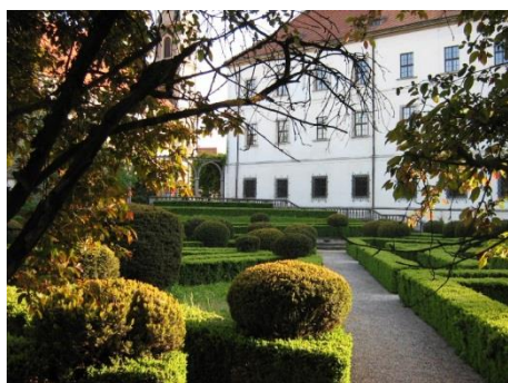
Brzeg, ogrody zamkowe, fot. C. Hadamik.

Zespoły zabytkowej zieleni towarzyszą obiektom rezydencjonalnym, są to również zabytkowe parki oraz planty miejskie (Brzeg, Byczyna, Kluczbork, Wołczyn, Namysłów, Nysa, Opole, Prudnik, Strzelce Opolskie, Kędzierzyn-Koźle, Paczków, Głubczyce), ogrody i zespoły zieleni komponowanej. Stan parków pałacowych i dworskich jest prostą pochodną zagospodarowania obiektów architektury. Stan publicznych przestrzeni zieleni jest na ogół dobry, podobnie jak zespołów komponowanej zieleni (np. na Górze Świętej Anny). Jako obiekt wyjątkowy trzeba traktować park-arboretum w Prószkowie, kontynuujący tradycję XIX-wiecznego pruskiego Królewskiego Instytutu Pomologicznego, który właśnie w Prószkowie miał swoją siedzibę. Wizytówką regionu jest też park w Pokoju, dobrze zachowane założenie z XVIII w. (ogród francuski) i XIX w. (park krajobrazowy) o unikalnych wartościach kompozycyjnych i artystycznych.