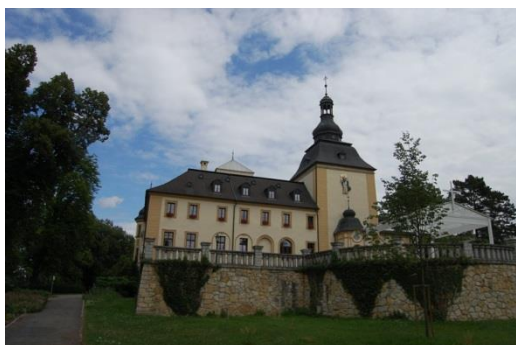
Kamień Śląski, pałac, fot. C. Hadamik.

Spośród zamków reprezentacyjnym obiektem Opolszczyzny jest zespół w Brzegu (nazywany „Śląskim Wawelem”), a także niewielki, ale znaczący wizerunkowo relikwiny średniowiecznego zamku w Opolu (Wieża Piastowska), obydwa obiekty właściwie użytkowane, w dobrym stanie, podobnie jak Górny Zamek w Opolu (regotycozowany w XIX w.), stanowiący obecnie fragment Zespołu Szkół Mechanicznych. Wspaniały zamek książąt opolsko-niemodlińskich w Niemodlinie zmienił ostatnio właściciela i jest w trakcie prac zabezpieczających, z różnym natężeniem trwają prace w obrębie zamków w Strzelcach Opolskich i Chrzelicach. Niedawno został odzyskany przez lokalny samorząd zamek w Głogówku, co być może pozwoli na właściwe zagospodarowanie tego obiektu. Zamek w Ujeździe został zabezpieczony w formie historycznej ruiny i udostępniony dla potrzeb ruchu turystycznego. W stanie historycznej ruiny pozostaje też zamek w Krapkowicach-Otmęcie. Prace zabezpieczające przeprowadzono natomiast w obiektach w Kędzierzynie-Koźlu i Krapkowicach.