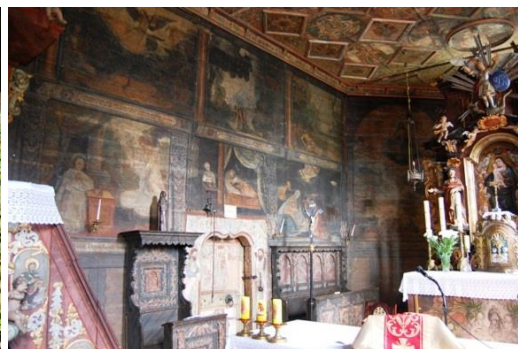
Michalice, wnętrze kościoła, fot. C. Hadamik.