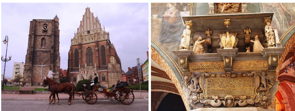
Nysa, zespół kościoła farnego pw. św. Jakuba i św. Agnieszki, fot. C. Hadamik.