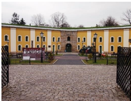
Nysa, twierdza, bastion św. Jadwigi, fot. C. Hadamik.