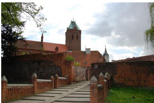
Byczyna, fortyfikacje miejskie, fot. C. Hadamik.

Z dwóch nowożytnych twierdz Śląska Opolskiego, wcześniejszą i bardziej złożoną genezę ma twierdza Nysa, której początki sięgają schyłku XVI w., kiedy powstały pierwsze fortyfikacje w systemie staroholenderskim. W połowie XVIII w., kiedy Nysa znalazła się w granicach państwa pruskiego, umocnienia zostały (na polecenie Fryderyka II) wydatnie rozbudowane (w tzw. systemie staropruskim), zastosowano w czasie tych prac rozwiązania nowatorskie, wyprzedzające ówczesną myśl fortyfikacyjną. Kolejne prace przy umacnianiu i rozbudowie twierdzy prowadzono w XIX w. Obecnie ten rozległy obszarowo obiekt jest jednym z najlepiej zachowanych reliktywów nowożytnych fortyfikacji na Śląsku. Prowadzone są prace nad jego zagospodarowaniem turystycznym. Znacznie gorszy jest stan zachowania reliktywów twierdzy Koźle, wzniesionej w zasadniczym zrębie w XVIII w., zlikwidowanej już w ostatniej ćwierci XIX stulecia. Zarysy kleszczowych umocnień widoczne są do dziś w parku miejskim, udostępnione są też dla potrzeb ruchu turystycznego nieliczne zachowane obiekty twierdzy.