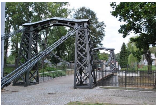
Ozimek, most żeliwny, fot. C. Hadamik.