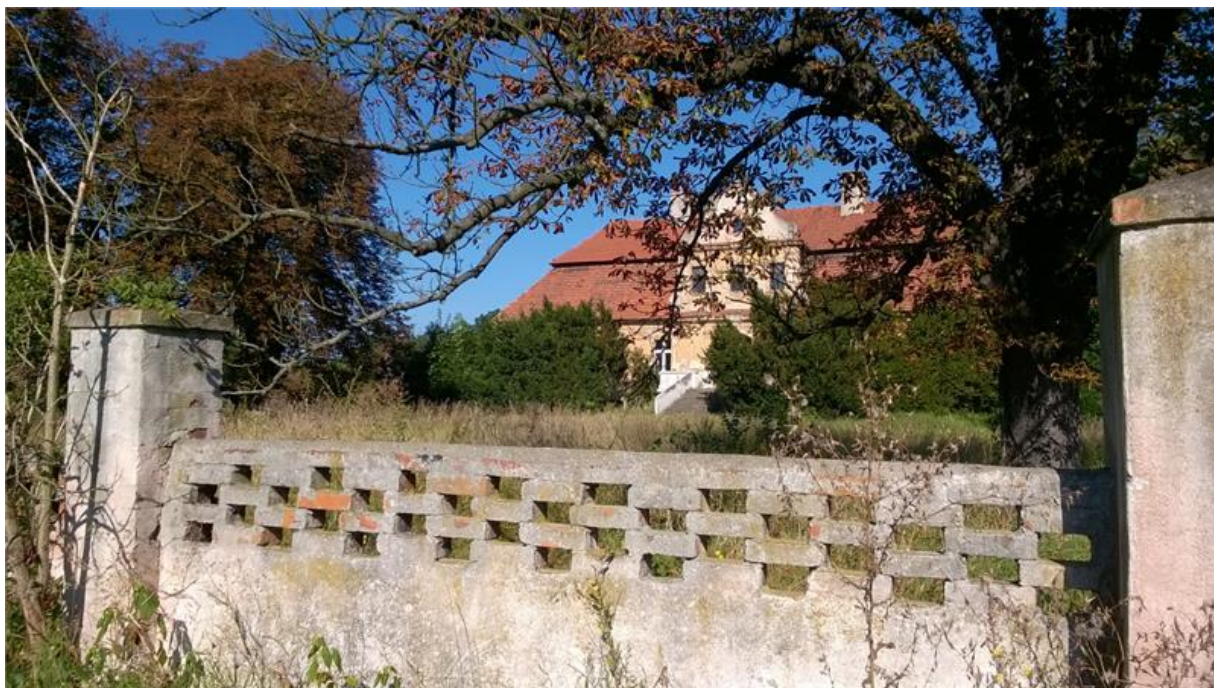
Ogrodzenie – mur przy pałacu w Mikolinie