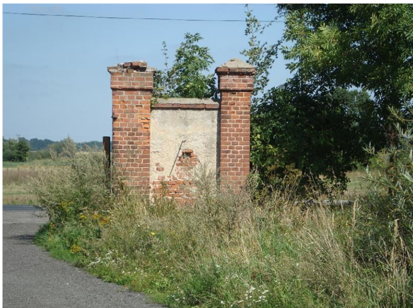
Pozostałości ogrodzenia folwarku w Kantorowicach