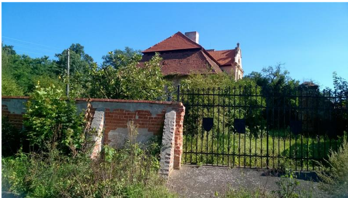
Ogrodzenie – mur wraz z bramą kutą przy pałacu w Mikolinie

Wieś która zasługuje na większą uwagę to miejscowość Różyna, gdzie układ przestrzenny wsi to typ ulicówka/wrzecionowaty, czytelny schemat organizacji zabudowy, wewnętrzne osie kompozycyjne, powtarzający się schemat organizacji zabudowy poszczególnych zagrod, układ budynków. Historyczne obiekty i zespoły architektoniczne we wsi Różyna to zabudowa zagrodowa, stodoły, obory, kościół, była szkoła, cmentarz, krzyże, figury, ogrodzenia, krzyż pokutny. Elementami regionalnego stylu architektonicznego w Różynie jest ok. 10 stodoł szachulcowych, tynki, pokrycie dachów dachówką ceramiczną, drewno oraz sztukaterie i ganki. Z wartości przyrodniczych należy wymienić układy alejowe, ogrody przydomowe, sady, warzywniki, przedogródki, pojedyncze naturalne zadrzewienie oraz pomniki przyrody (dęby).