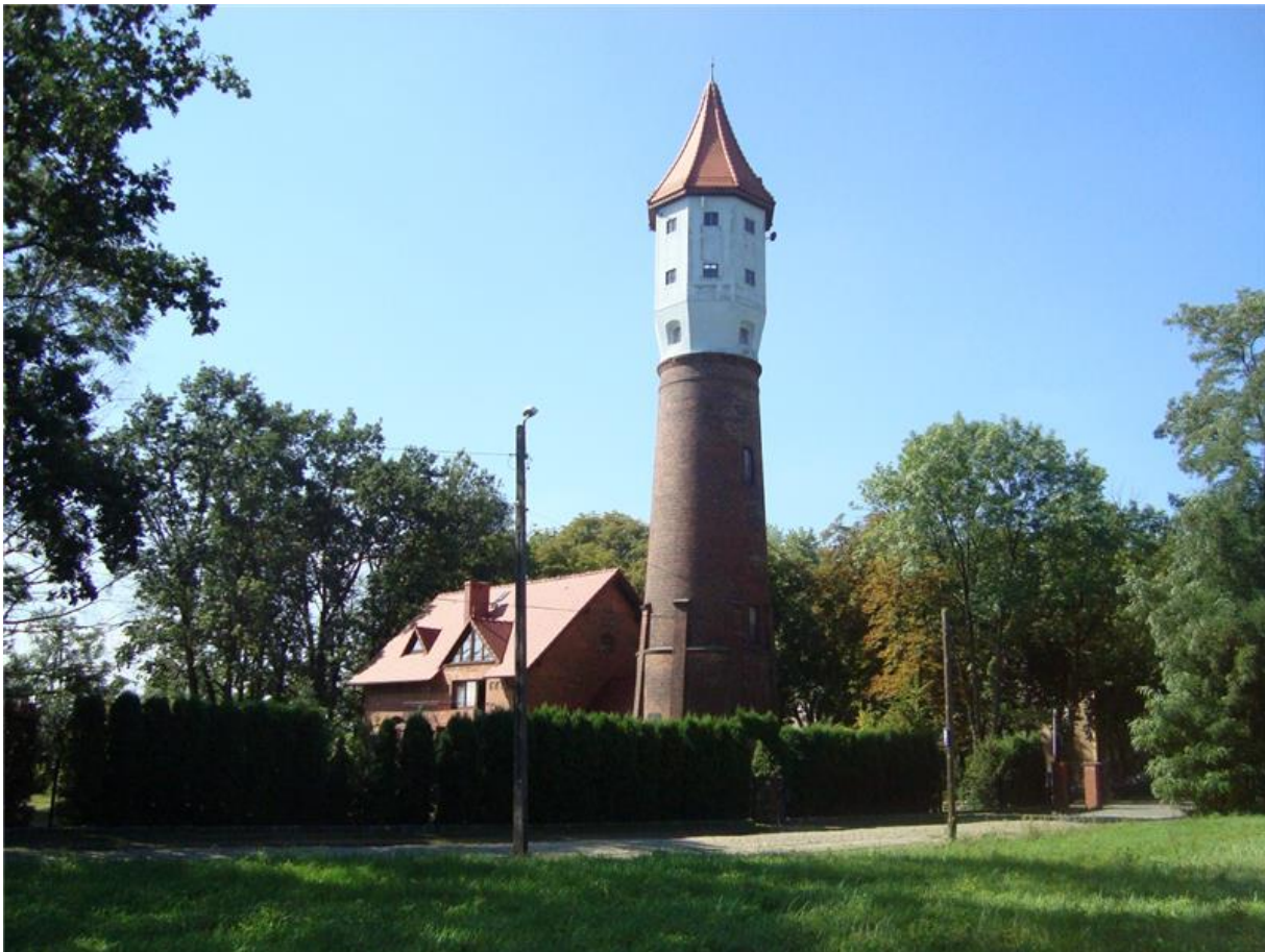
Wieża ciśnień w Skorogoszczy

W niniejszym zespole został dobrze zachowany układ przestrzenny, czytelne są poszczególne części składowe i granice zespołu wytyczone ogrodzeniami lub naturalnymi przeszkodami (rzeka, potok), został zachowany pierwotny układ komunikacyjny. Największe zmiany zaszły w obrębie części rezydencjonalnej, gdzie został wyburzony pałac, zniszczeniu uległa południowo – zachodnia część parku oraz ulokowano nową zabudowę gospodarczą. Stan techniczny poszczególnych budynków jest zróżnicowany, od złego w przypadku budynków nieużytkowanych i gospodarczych do dobrego w przypadku zaadaptowanych na budynki mieszkalne i użytkowanych przez szkołę i przedszkole.