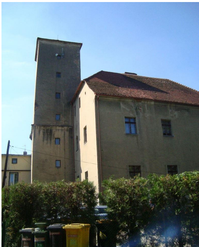
Zamek myśliwski w Kantorowicach