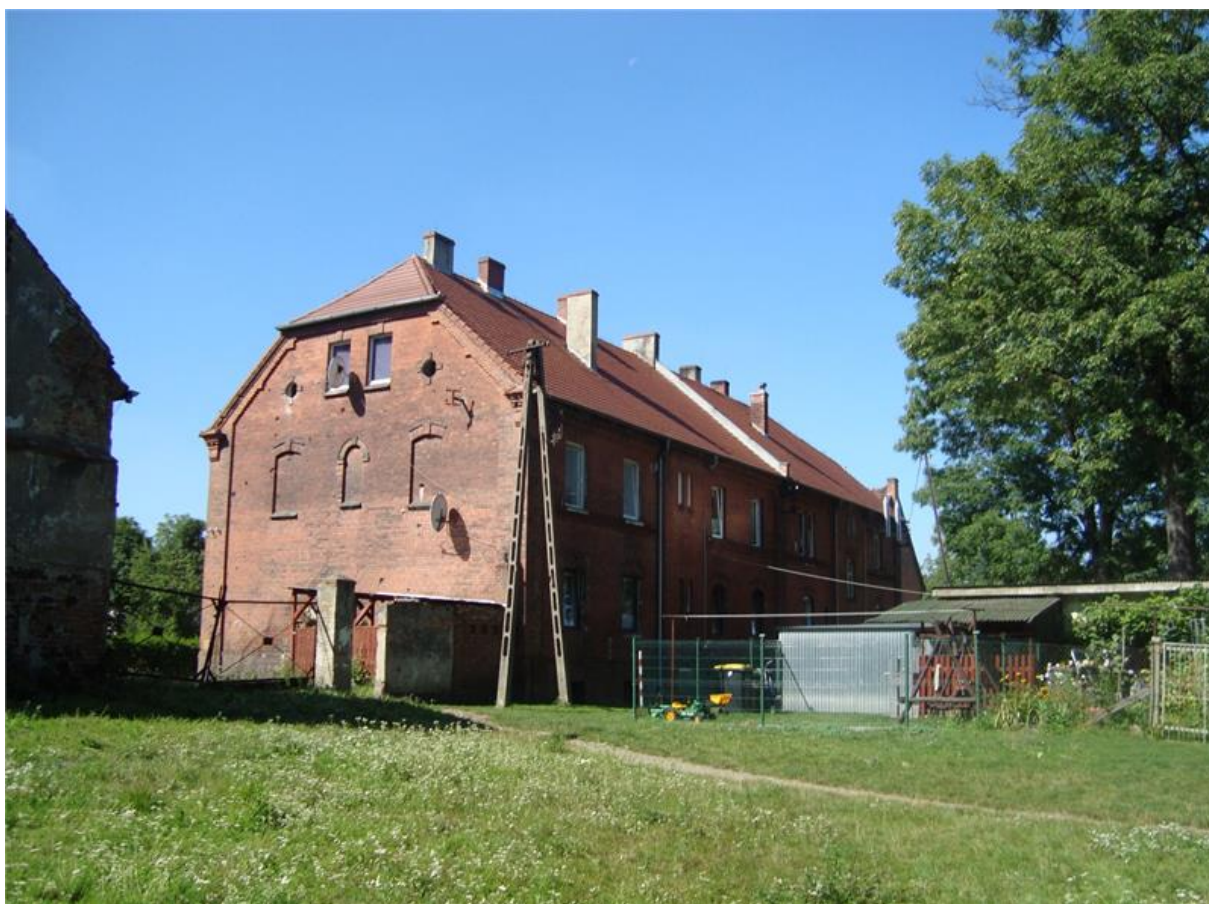
Dom robotników folwarcznych – obecnie dom mieszkalny