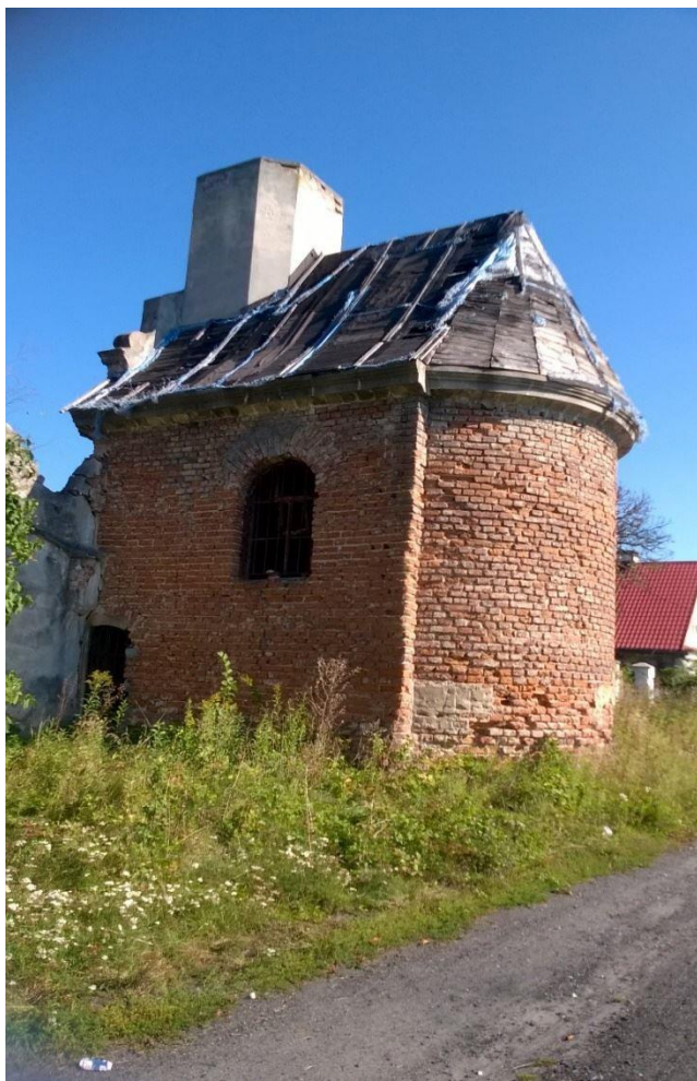
Kaplica przy pałacu w Mikolinie