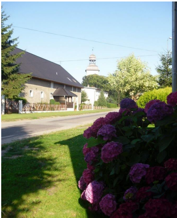
Wieś Strzelniki – w tle kościół pw. św. Antoniego

Wśród zabudowy wiejskiej wyróżnia się także architektura Strzelnik. Pod koniec XIX w., ta wieś o średniowiecznej metryce, znacznie się rozrosła, pełniąc funkcję wsi podmiejskiej dla pobliskiego Brzegu. Generowane inwestycją ożywienie gospodarcze w Brzegu skutkowało pojawieniem się zabudowy o charakterze małomiasteczkowym. Historyczny układ przestrzenny wsi to typ owalnica. Historyczne obiekty i zespoły architektoniczne to zabudowa zagrodowa, kościół, cmentarz, spichlerz, ogrodzenia, stacja transformatorowa, studnie oraz elementy regionalnego stylu architektonicznego to pokrycia dachów dachówka ceramiczną, sztukateria, ganki, opaski okienne. Z wartości przyrodniczych to układy alejowe, ogrody przydomowe, przedogródki. W Strzelnikach zachowały się zabytkowe XIX wieczne budynki o charakterze ozdobnych willi z kutymi płotami i bramami w otoczeniu drzew i zieleni.