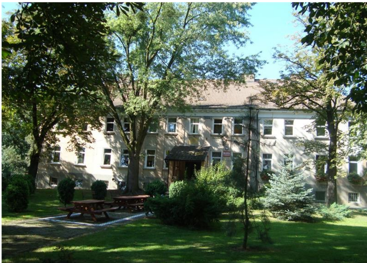
Dom dziecka w Skorogoszcz – dawniej willa