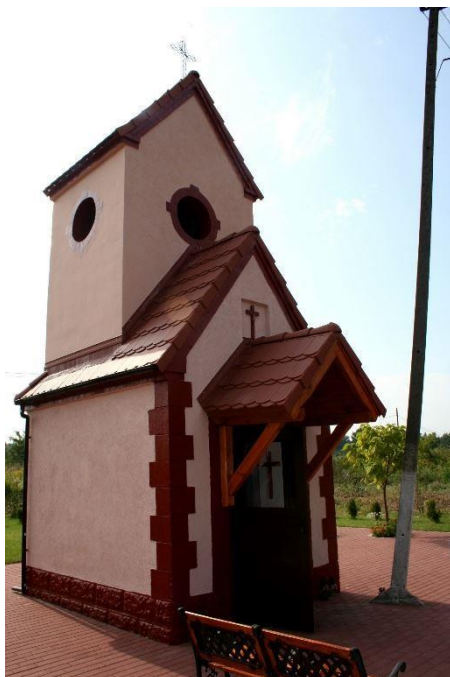
Kapliczka we wsi Borkowice