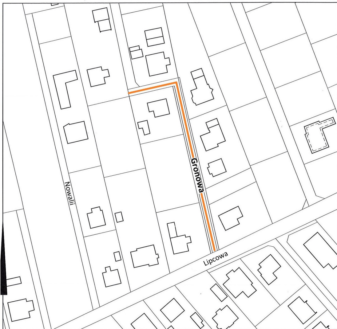
— - oś ulicy