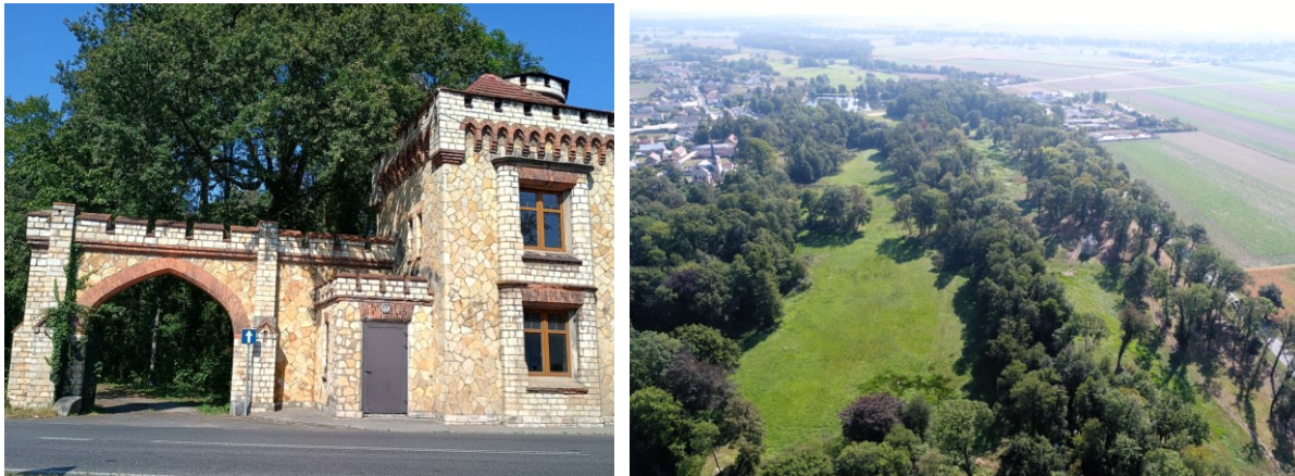
Rysunek 20 Widok parku w Dobrej; źródło: fotografia Krzysztof Bucher

przecina rzeka Biała, na jego obszarze znajduje się m.in. częściowo zrujnowane mauzoleum rodziny Seher-Thoss, w pobliżu pałacu – pozostałości rokokowych rzeźb. W najbliższym czasie planowane jest rozpoczęcie prac remontowych przy budynku mauzoleum.