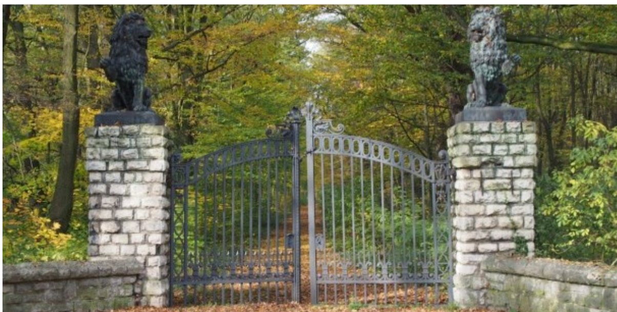
Rysunek 33 Brama z lwami – park w Mosznej

Twórcą rzeźb lwów, podobnie jak rzeźb gladiatorów tworzących drugą bramę wjazdową do parku, był berliński rzeźbiarz Fritz Heinemann. Odlane w brązie rzeźby lwów stoją na filarach murowanych z surowych ciosów wapiennych. Pomiędzy filarami ażurowa, metalowa, dwuskrzydłowa brama dekorowana motywami plecionki.