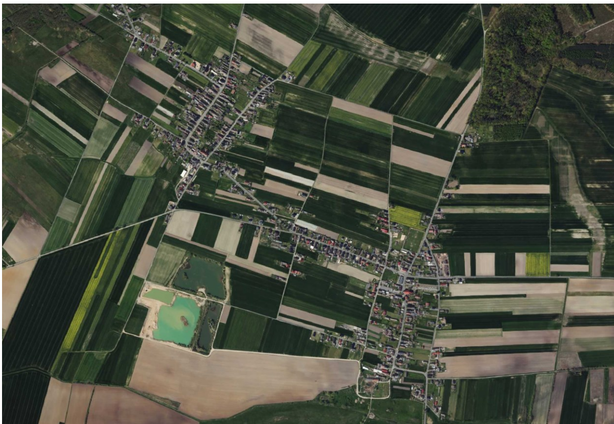
Rysunek 12 Widok układu przestrzennego wsi Racławiczki i Dziedzice; źródło: www.geoportal.gov.pl

W ciągu miejscowości Racławiczki i Dziedzice dominantę stanowi wieża kościoła parafialnego pw. św. Marii Magdaleny w Racławickach. wyróżniającym się elementem jest budynek dawnej szkoły w Dziedzicach.