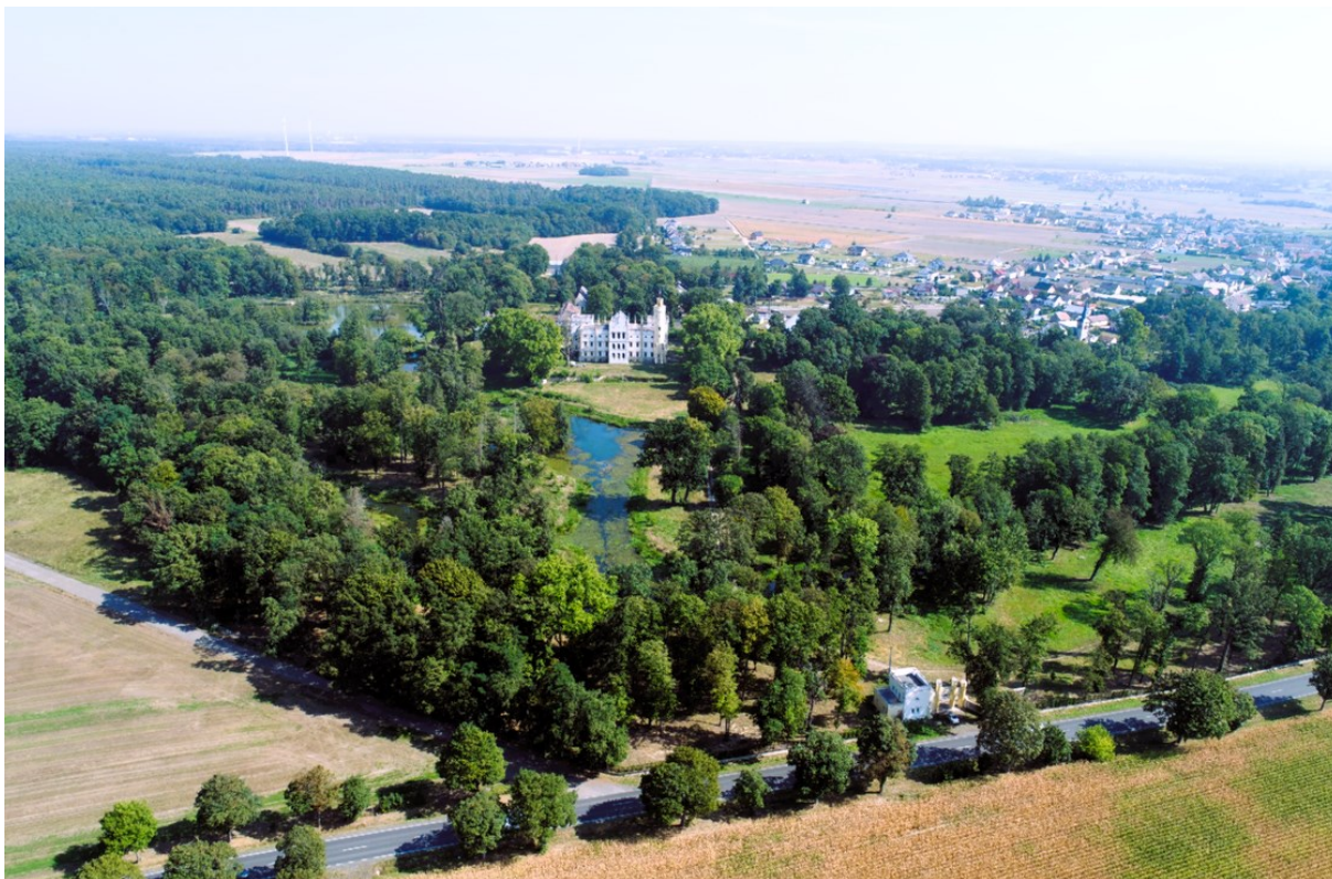
Rysunek 26 Widok pałacu i parku w Dobrej

W parku znajduje się również mauzoleum zbudowane w 1882 r. Grobowiec został usytuowany na sztucznie uformowanym wzniesieniu wśród sosen i świerków. Budynek został wzniesiony, podobnie jak pałac, w stylu neogotyckim. W 1945 r. żołnierze sowieccy zniszczyli mauzoleum, dopuszczając się także zbezczeszczenia zwłok. Od tego czasu obiekt podlegał degradacji. Po 2000 r. i zmianie właściciela, okna i drzwi grobowca zostały zamurowane.