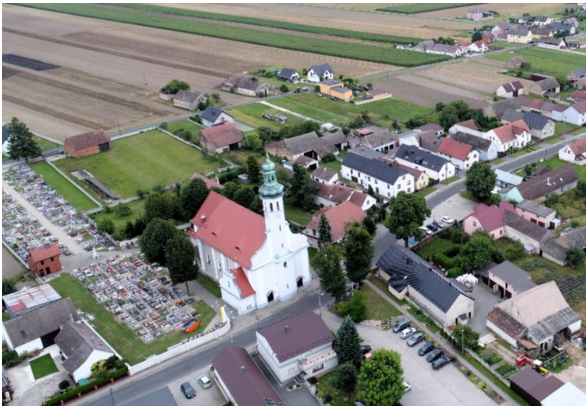
Rysunek 16 Widok kościoła w Racławiczkach

Kościół w Racławiczkach wzmiankowany był już w XV w. Obecny wzniesiono w 1802 r., następnie w 1913 r. przebudowano elewację zachodnią i wieżę. Istotne prace remontowe przy kościele prowadzono m.in. w latach 1887-1888 i 1952. Jest murowany, jednonawowy, z prezbiterium zamkniętym odcinkowo i wtopioną w korpus wieżyczką, nakrytą cebulastym hełmem i chorągiewką z 1913 r. Nad prezbiterium rozpięte jest sklepienie krzyżowe, w pozostałych pomieszczeniach – sufity z fasetą. Podziały elewacji ramowe, okna zamknięte łukiem. Kościół oraz wyposażenie o cechach neobarokowych, dzwon odlany w 1618 r. w pracowni Adama Schrauba, ludwisarza z Ołomuńca. Przy kościele znajduje się plebania (nr rej. 1624/66 z 21.09.1966) wymurowana w 1836 r. Jest usytuowana kalenicowo w kierunku drogi, o pięcioosiowej elewacji, parterowa, z wysokim poddaszem. Dach naczółkowy kryty jest dachówką. Ceglana plebania jest otynkowana, w tynku wykonano płytkie boniowanie. Oba zabytki są w dobrym stanie technicznym.