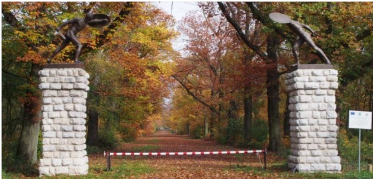
Rysunek 32 Brama z gladiatorami – park w Mosznej