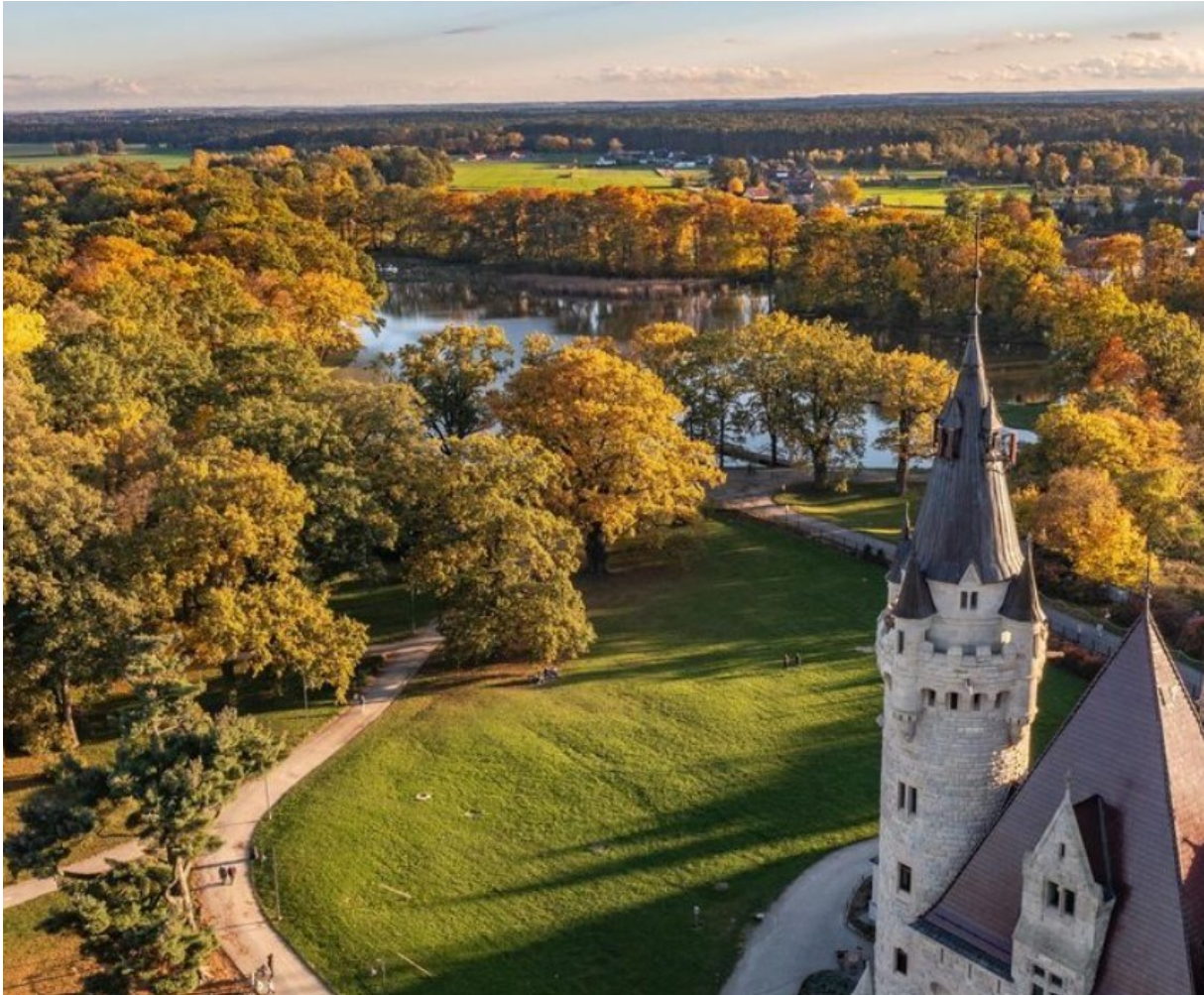
Rysunek 28 Widok pałacu i parku w Mosznej

Park i przylegające lasy oraz pola posiadają wspólny system rowów melioracyjnych, mających powiązania ze stawami parkowymi i kanałem wokół alei lipowej. Stan zdrowotny drzewostanu jest nierównomierny. Drzewostan składający się głównie z dębu szypułkowego, świerka pospolitego, lipy szerokolistnej, olszy czarnej. Zgodnie z krajobrazowymi założeniami z przełomu XIX i XX w. park o cechach naturalistycznych bliskich typowi „beautiful”. Oparty na kompozycjach swobodnych, krajobrazowych w których główne walory parku osadza się na dużych przestrzeniach trawników, z samotnikami, grupami drzew, klombami, smugami. Element wody stanowił w tym typie ogrodów element bardzo często stosowany, tu występuje jako ważna składowa układu, w postaci wody stojącej. Pomimo, iż nie zachowała się część stawów, łączące się z wprowadzonym drzewostanem stanowią o atrakcyjności miejsca. Roślinność tu spotykana to drzewa typowe dla siedliska ale również egzoty, np. sosna wejmutka i liczne zachowane krzewy rododendronów i azalii – typowe dla rozwiązań ogrodów z tej grupy. Ważne ciągi widokowe i duktów stanowią do dnia dzisiejszego o wyjątkowości obiektu. Łąki i pola otoczone alejami stanowią atrakcyjną kompozycję złożoną z sekwencji wnętrza.