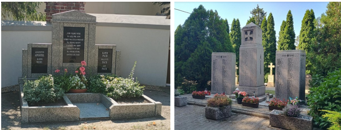
Rysunek 18 Mogiły w Racławickach (po lewej) i Strzeleckach (po prawej); źródło: fotografia Krzysztof Bucher