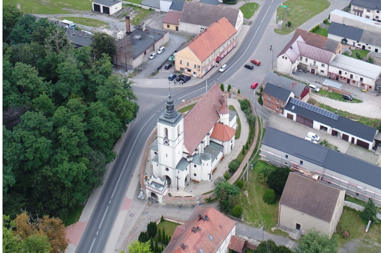
Rysunek 14 Widok kościoła w Kujawach

W prezbiterium i nawie sklepienia kolebkowe z lunetami, z siecią stiukowych, dekoracyjnych żeber spływających na wąskie pilastry. Ołtarz główny późnobarokowy. Polichromia w prezbiterium późnorenesansowa, odnowiona i częściowo przemalowana. Ambona renesansowa, z płaskorzeźbami przedstawiającymi sceny z Nowego Testamentu. W drzwiach do zakrystii żelazne, okute drzwi z rozetą pośrodku, antabą i starym zamkiem. Kościół i brama są w bardzo dobrym stanie.