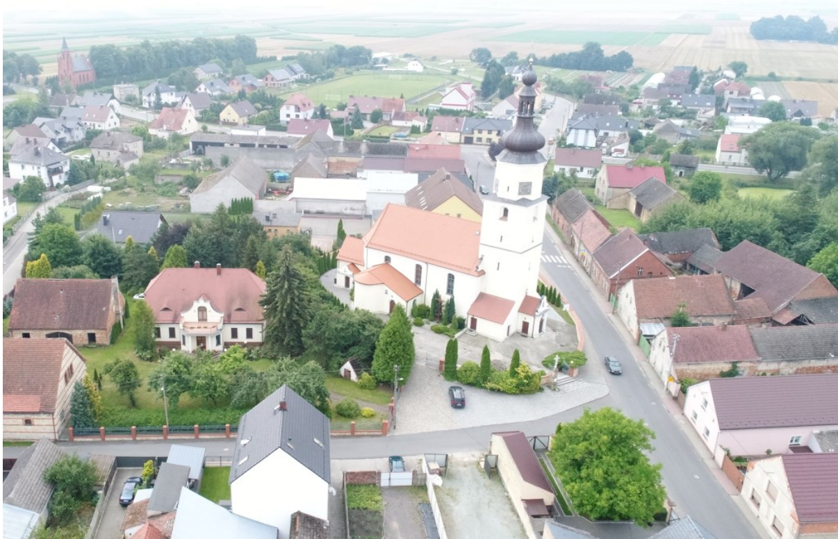
Rysunek 17 Widok kościoła w Strzeleczkach

Przy kościele znajduje się plebania (nr rej. 1625/66 z 21.09.1966). Wzniesiona w 1 poł. XIX w., murowana z cegły, tynkowana, parterowa z wysokim poddaszem. Naczółkowy dach kryty był łupkiem, obecnie – dachówką. Układ wnętrza jest dwutraktowy, elewacja pięcioosiowa. W miejscu ganku, tarasu i facjatki znajdowała się drewniana lauba, okno „wole oko”, a przed wejściem ustawione były rzeźby.