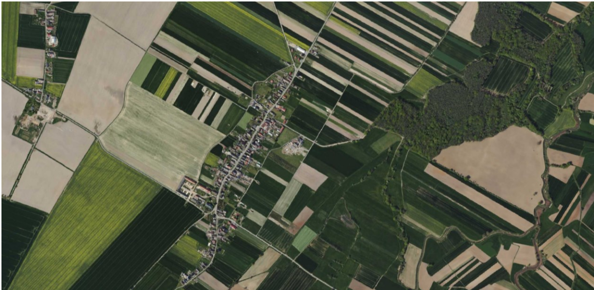
Rysunek 10 Widok układu przestrzennego wsi Pisarzowice

W Pisarzowicach dominantą jest wieża kościoła parafialnego pw. św. Michała Archanioła, natomiast subdominantą jest bryła pałacu Oppersdorffów, wraz z przypałacową zielenią. Podobnie usytuowany już poza miejscowością młyn wodny „Amerykan” jest schowany za wysokimi drzewami – pełni już tylko funkcję akcentu przestrzennego.