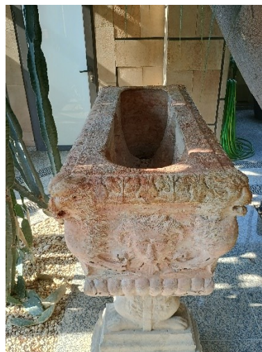
Rysunek 34 Zespół żardinier-donic; źródło: fotografia Krzysztof Bucher