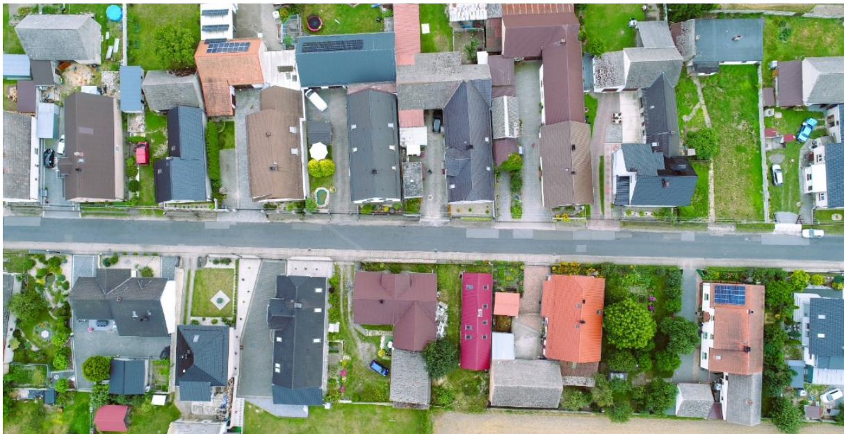
Rysunek 2 Widok wsi Racławiczki

Wieś Racławiczki jest w typie ulicówki. Charakteryzuje ją szczytowa zabudowa a także dominanta – wieża kościoła parafialnego. W układzie dominują wydłużone parcele, z dwoma budynkami w przedniej części działki oraz z kalenicowo usytuowaną stodołą w tylnej części. Przed budynkami mieszkalnymi znajdują się przedogródki, za stodołami lokalizowane były sady i warzywniki. Zewnętrzną linię panoramy wsi współtworzą okazałe stodoły, których ilość zmniejsza się wraz ze zmniejszeniem się roli rolnictwa. Najważniejszy plac znajduje się na skrzyżowaniu ul. Plebiscytowej, Opolskiej i Leśnej. We wsi znajduje się wiele kapliczek, zarówno kubaturowych jak i wnękowych, umieszczonych na elewacjach budynków.