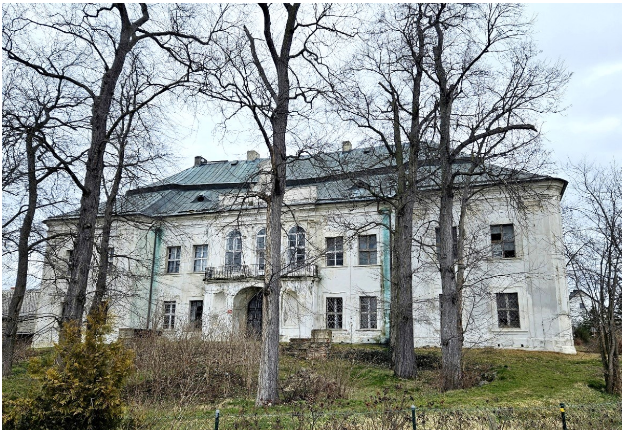
Rysunek 23 Widok na pałac w Pisarzowicach

Elewacja tylna z pojedynczym ryzalitem mieszczącym wyjście do ogrodu. W pałacu częściowo zachowana stylowa stolarka oraz okazała klatka schodowa. W przejazdowej sieni – sześć filarów z gzymsami, podpierających sklepienie krzyżowe. Przy schodach kamienne, ażurowe balustrady. Budynek jest stopniowo remontowany, jednak m.in. stan pokrycia dachowego oraz spękania muru w okolicach gzymsów i ptn. zach. narożnika powodują, że jego stan techniczny jest niezadowolający.