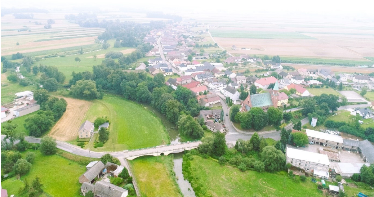
Rysunek 3 Widok wsi Komorniki w kierunku wschodnim

Komorniki wieś w typie „ulicówki”. Jest rozciągnięta wzdłuż krawędzi południowej skarpy rzeki Osobłogi. Malowniczą dominantę stanowi sylwetka neogotyckiego kościoła na wzniesieniu otoczonym murem oporowym. Jest to element jednej z najbardziej charakterystycznych panoram wsi, widocznej zza kamiennego mostu, z lewego brzegu Osobłogi. Kościół wytycza początek biegnącego w kierunku wschodnim układu ulicowego, z częściowo zachowanymi historycznymi pierzejami zabudowy. Na zachód od kościoła znajduje się kompleks młyński oraz pozostałości konstrukcji hydrotechnicznych. Na południe od młyna stoi okazały budynek dawnej gospody, tam też mieściły się piekarnie. Granice wsi z jednej strony wytycza meandrujące koryto rzeki, z drugiej – biegnąca na tyłach zabudowań droga zagumna, skąd widoczny jest rząd stodół.