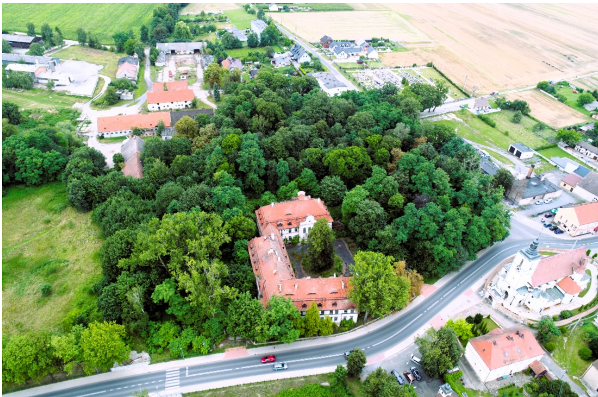
Rysunek 27 Widok pałacu i parku w Kujawach

Cały kompleks pałacowo – parkowy zajmował prostokątny obszar o powierzchni 6,75 ha. Ze względu na funkcjonalność i przeznaczenie tereny te podzielono na cztery nierozzerwalne strefy.