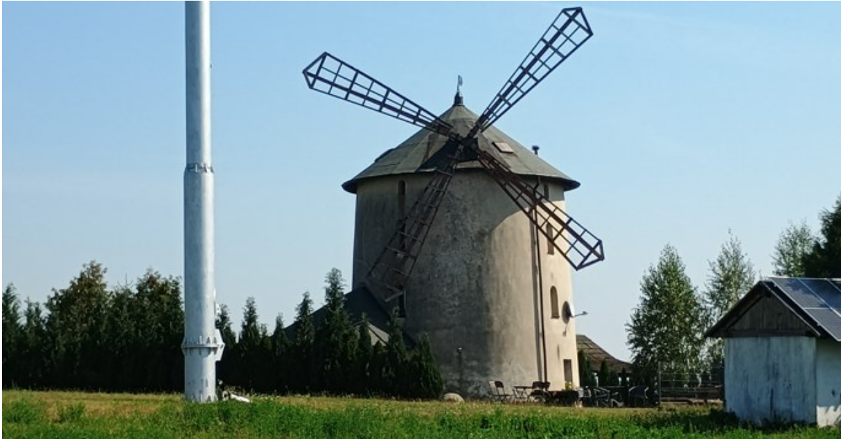
Rysunek 24 Widok wiatraka w Łowkowicach

Do wiatraka od strony zachodniej przylega jednokondygnacyjna przybudówka. Obwód wiatraka lekko zmniejsza się ku górze, w ścianach znajdują się cztery pionowe rzędy zamkniętych łukiem, wąskich okienek. Obiekt odrestaurowany przez prywatnego właściciela i adaptowany do celów użytkowych.