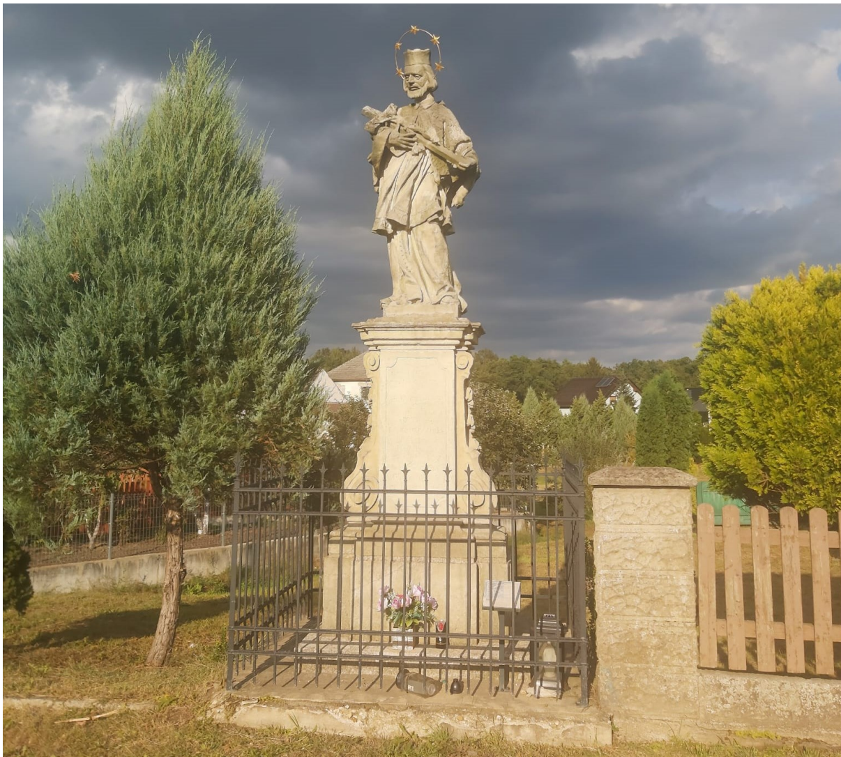
Rysunek 30 Rzeźba św. Jana Nepomucena w Strzeleczkach przy ul. Opolskiej

Kamienna rzeźba św. Jana Nepomucyna przy ul. Opolskiej w Strzeleczkach - barokowa, z 2 ćw. XVIII w., pochodząca z jednego ze śląskich warsztatów kamieniarskich, odrestaurowana w 2013 r. Typowe dla sztuki baroku ikonograficzne przedstawienia Świętego, prezentujące jednocześnie dobry warsztat artystyczny.