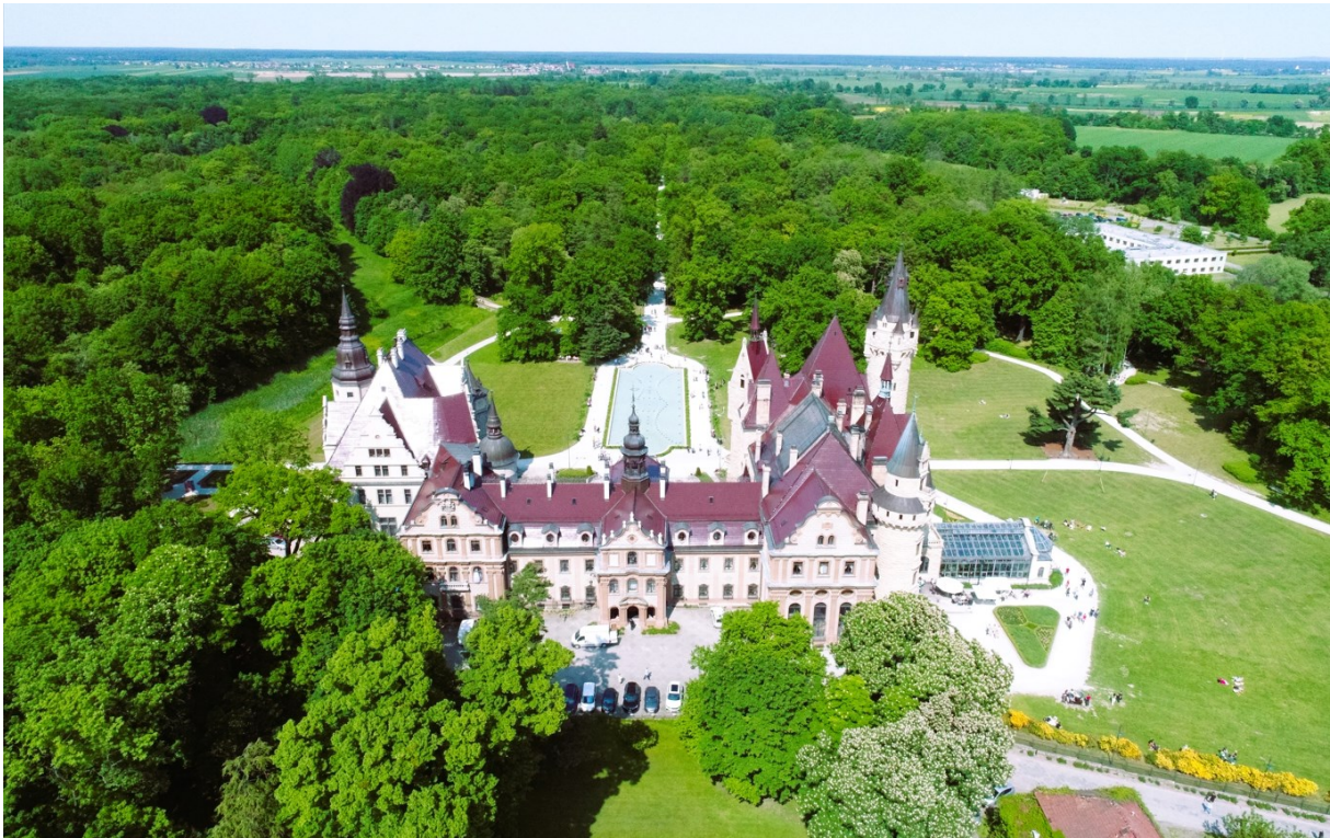
Rysunek 22 Widok pałacu i parku w Mosznej; źródło: fotografia Krzysztof Bucher

Najbardziej znanym zabytkiem gminy jest zespół pałacowo-parkowy w Mosznej. Pałac wzniesiony został w latach 1890-1900 dla Franza Huberta Thiele-Winklera, z częściowym wykorzystaniem części wcześniejszego, barokowego dworu należącego do Seherr-Thossów, a następnie rozbudowany o skrzydło zachodnie w latach 1912-14. Powstał eklektyczny pałac z motywami neogotyckimi, neorenesansowymi i neobarokowymi. Wzniesiony na planie podkowy, dwupiętrowy, kryty wysokimi dwuspadowymi dachami. Bryłę urozmaicają liczne wieże, ryzality i sterczyny, a elewacje zdobi bogaty detal architektoniczny. Do budynku przylega przeszklona oranżeria, do elewacji parkowej prowadzą szerokie kilkubiegowe schody. We wnętrzu zachowana jest część zabytkowego wyposażenia.