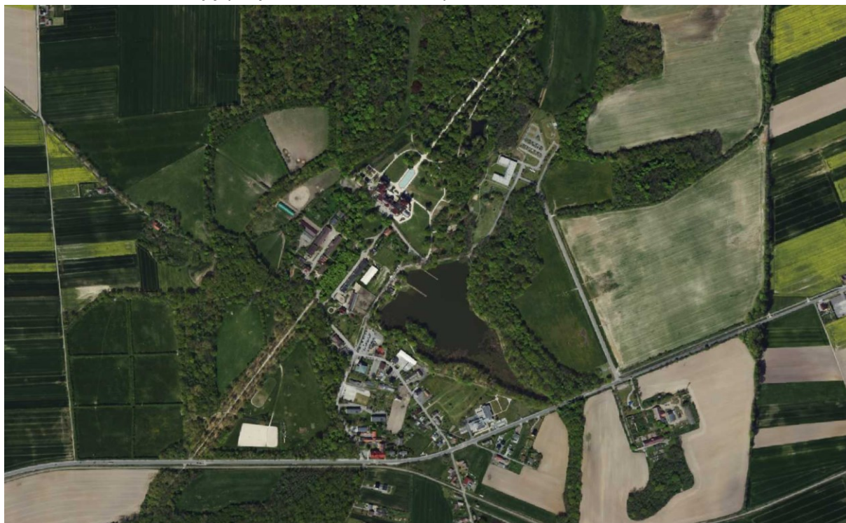
Rysunek 5 Widok układu przestrzennego wsi Moszna

Od głównej osi kompozycyjnej, tj. od tarasu pałacowego biegną pod kątem 45° dwie symetryczne osie widokowe (dziś już mniej czytelne). Jedna zakończona jest stawem północnym, za którym znajduje się las. Druga oś widokowa biegła od tarasu pod tym samym kątem w kierunku wschodnim do nieistniejących już stawów hodowlanych.