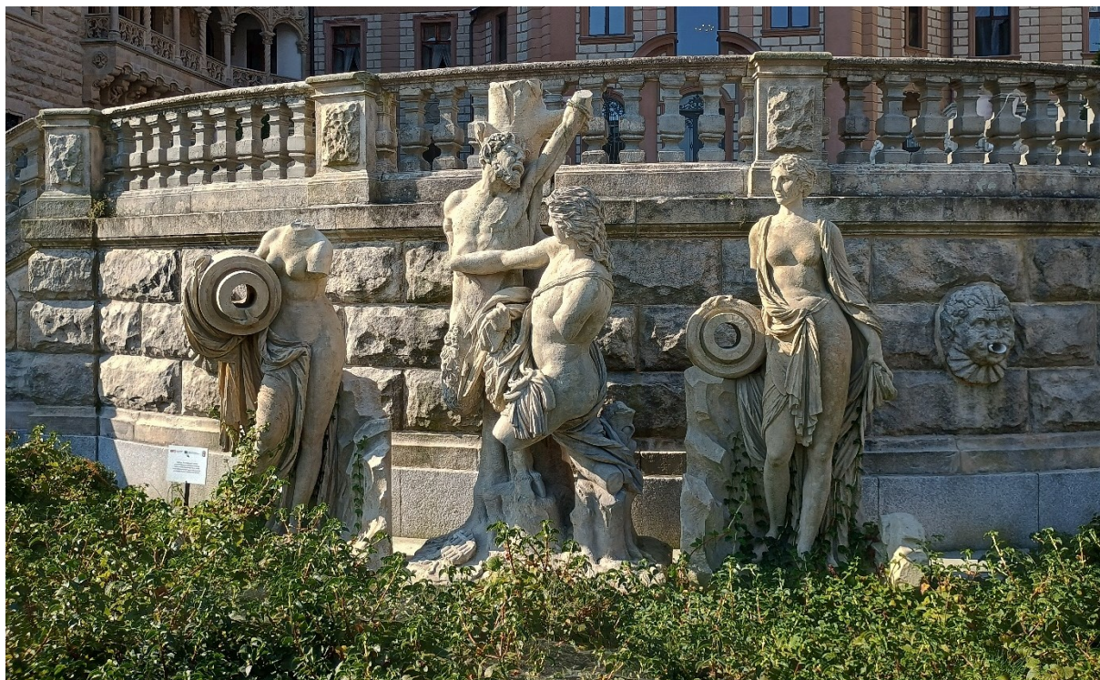
Rysunek 31 Grupa rzeźbiarska przed pałacem w Mosznej, źródło: fotografia Krzysztof Bucher

Rzeźby zostały objęte ochroną konserwatorską z uwagi na wartości historyczne i artystyczne dzieła.