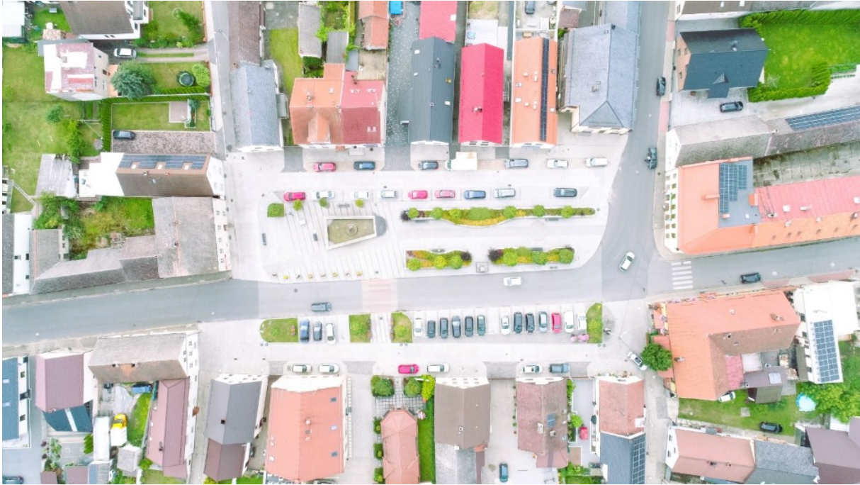
Rysunek 1 Widok Rynku w Strzeleczkach