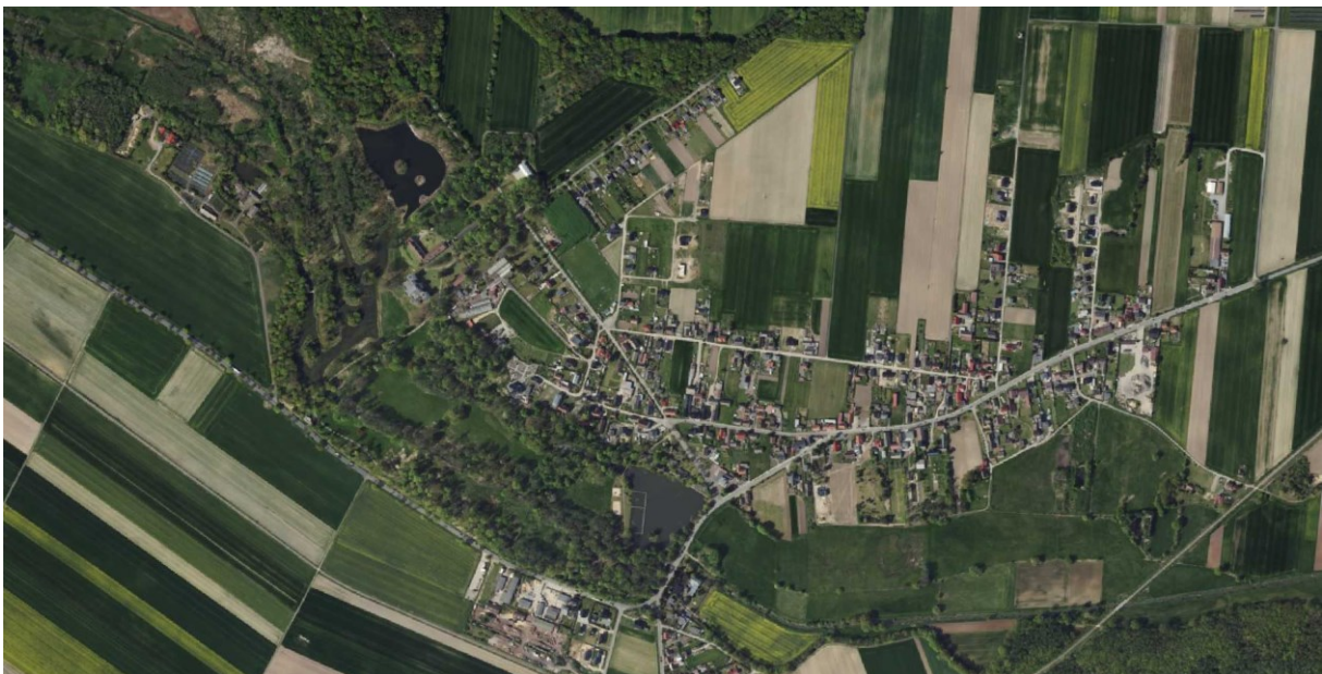
Rysunek 8 Widok układu przestrzennego wsi Dobra

Dominantą wsi Dobra jest zespół pałacowo-parkowy z pałacową wieżą górującą ponad zielonym dachem parku. Sama zieleń parkowa pełni funkcję subdominanty w formie masywu drzew. Od pałacu w kierunku północno-wschodnim prowadzi oś widokowa utworzona z alei lipowej. Ponadto przy drodze wojewódzkiej wzdłuż parku występują jeszcze dwa akcenty przestrzenne ułatwiające zorientowanie pałacu w terenie: dwie bramy parkowe (w tym jedna z budynkiem bramnym). Dla samego centrum wsi dominantę przestrzenną stanowi kościół parafialny pw. św. Jana Chrzciciela.