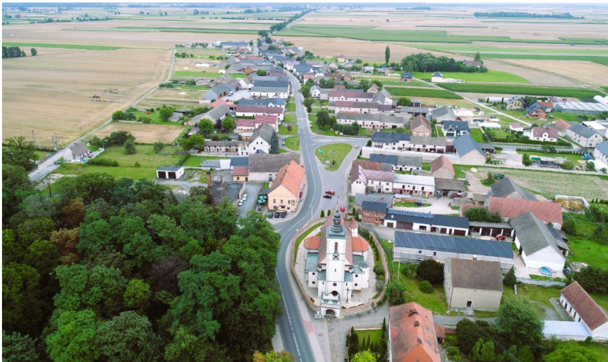
Rysunek 4 Widok wsi Kujawy w kierunku wschodnim

Dla wsi Kujawy charakterystyczne są długie pierzeje szczytowej zabudowy mieszkalnej oraz dominanta w postaci kościoła oraz zespołu pałacowego. Przeważająca ilość zabudowy skupiona jest wzdłuż dwóch głównych ulic ustawionych do siebie prostopadle, mniej domów usytuowanych jest przy bocznych drogach. Najważniejsze budynki znajdują się w okolicy przecięcia się dróg: kościół ujęty w owal muru ogrodzeniowego z renesansową bramą i mniejszą bramką z drugiej strony, okazały budynek sąsiedniej plebanii oraz pałac z przyległym parkiem i zabudowaniami folwarcznymi. W niedalekim sąsiedztwie znajduje się dawny budynek gospody przyległą salą.