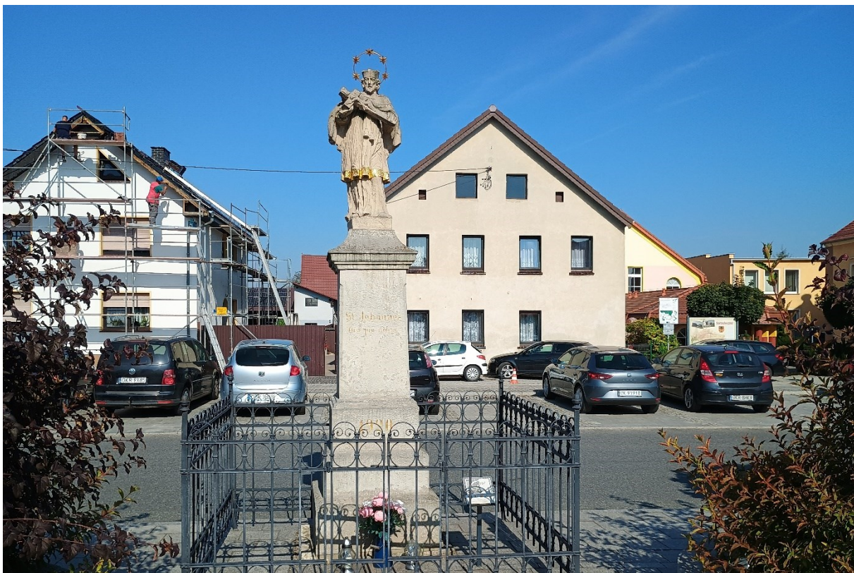
Rysunek 29 Rzeźba św. Jana Nepomucena w Strzeleczkach na Rynku

Kamienna rzeźba św. Jana Nepomucyna na Rynku w Strzeleczkach - późnobarokowa z k. XVIII w. na postumencie z 1920 r., odrestaurowana w 2012 r. Typowe dla sztuki baroku ikonograficzne przedstawienia Świętego, prezentujące jednocześnie dobry warsztat artystyczny.