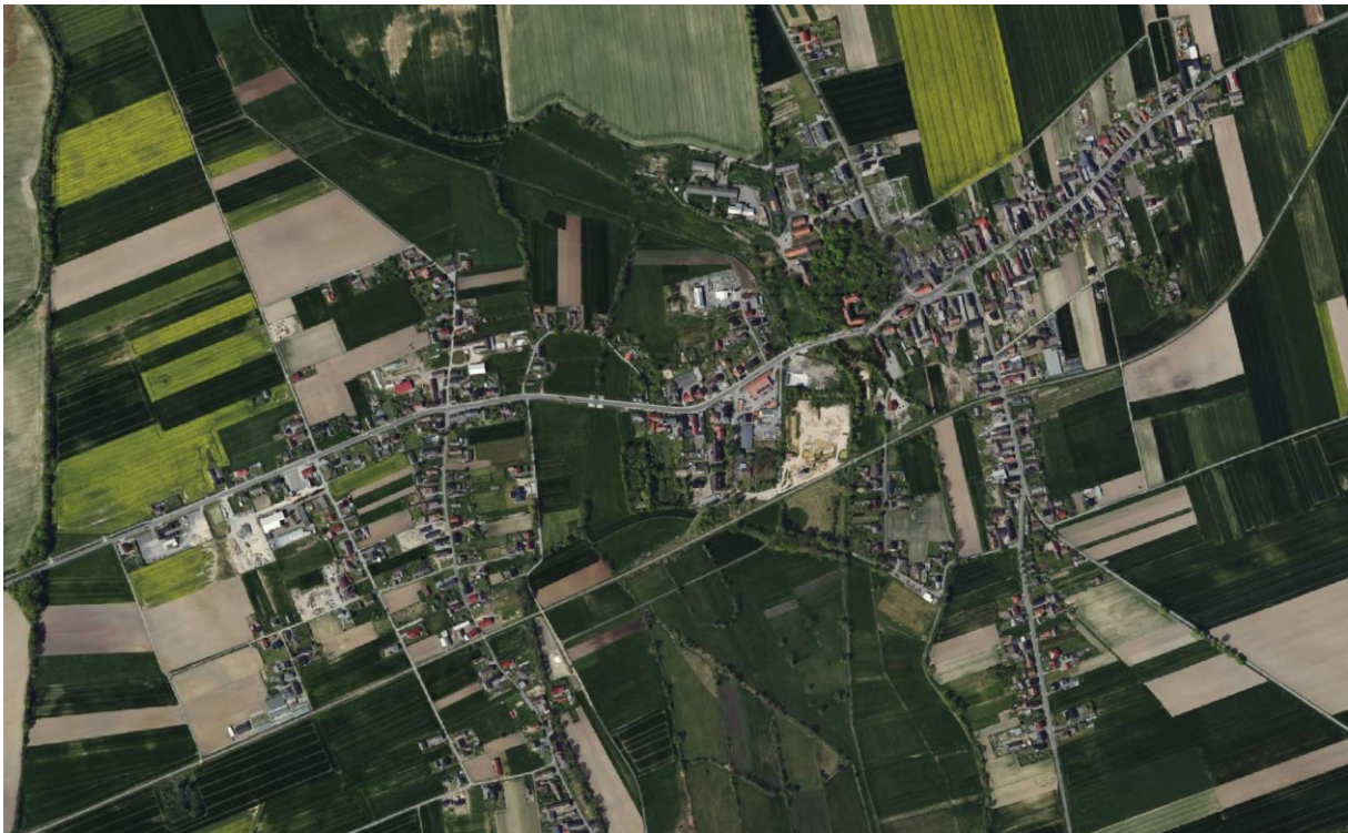
Rysunek 6 Widok układu przestrzennego wsi Kujawy i Zielina

W miejscowości Kujawy dominantą jest kościół pw. św. Trójcy wraz z wieżą widoczny z trzech kierunków. Dodatkowo od strony zachodniej efekt dominacji nad otoczeniem wzmacnia niewysoka brama kościelna (dzwonnica). Naprzeciw kościoła, po drugiej stronie drogi, znajduje się założenie pałacowo-parkowe, częściowo ukryte w masywie drzew i pełniące rolę subdominanty.