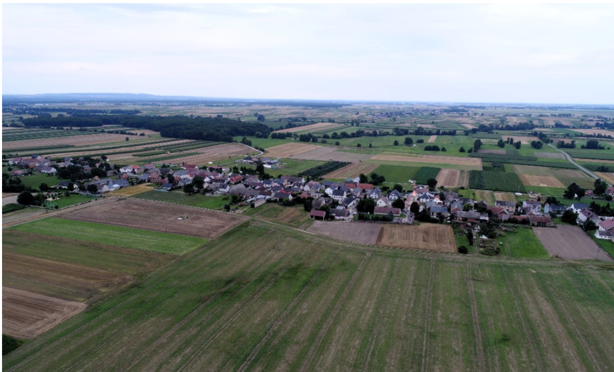
Rysunek 11 Widok układu przestrzennego wsi Pisarzowice