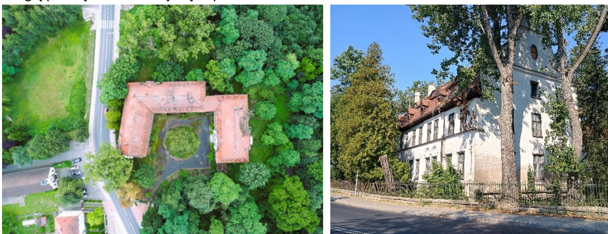
Rysunek 21 Widok pałacu i parku w Kujawach; źródło: fotografia Krzysztof Bucher

Przypałacowy park o powierzchni ok. 2,3 ha powstał przed poł. XIX w. przy istniejącym wówczas barokowym pałacyku. W 2 poł. XIX w. park przebudowano w związku z budową nowego zespołu pałacowego i prawdopodobnie w tym czasie uzyskał charakter założenia krajobrazowego. Po 1900 r. wraz z rozbudową pałacu i folwarku zmieniono kształt podjazdu przed pałacem i utworzono rozległą polanę w zachodniej części parku.