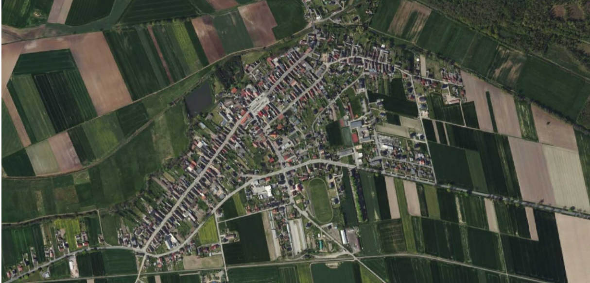
Rysunek 7 Widok układu przestrzennego Strzeleczek

W Strzeleczkach dominantami krajobrazowymi są wieże dwóch kościołów: parafialnego pw. Św. Marcina w centrum wsi oraz cmentarnego pw. Podwyższenia Krzyża Świętego przy wjeździe do Strzeleczek od wschodu. Na miano subdominanty zasługuje ponadto zieleń cmentarna tworząca naturalną ścianę.