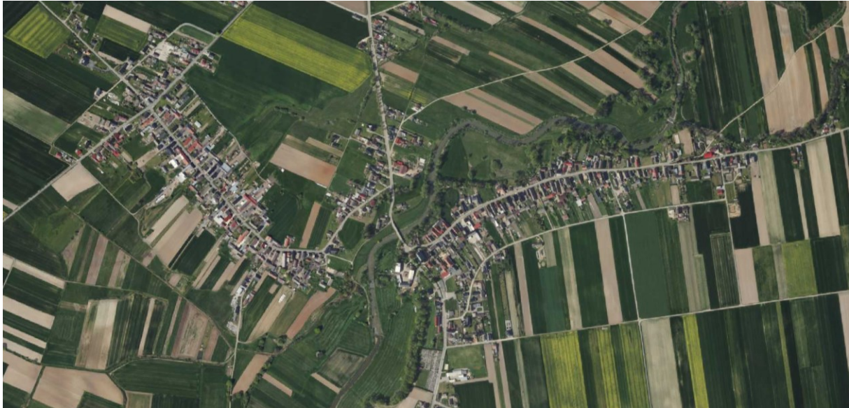
Rysunek 9 Widok układu przestrzennego wsi Łowkowice i Komorniki

W okolicach wsi Łowkowice i Komorniki dominantą krajobrazową jest kościół parafialny pw. Nawiedzenia NMP w Komornikach wybudowany na niewielkim wzniesieniu, otoczonym murem oporowym oraz unikatowy w skali województwa wiatrak typu holenderskiego ustawiony przy wjeździe do Łowkowic od strony Strzeleczek. Akcentem przestrzennym jest natomiast łączący obie miejscowości most nad meandrującą w tym miejscu rzeką Osobłogą.