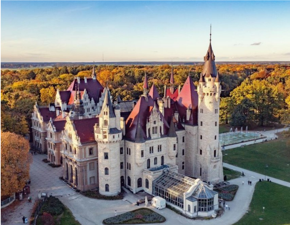
Rysunek 35 Widok na zespół pałacowo-parkowy w Mosznej

Zabytkami o bardzo wysokim znaczeniu dla gminy jest ponadto zachowany układ ruralistyczny wsi Strzeleczki oraz tworzące go obiekty zabytkowe (budynki mieszkalne i gospodarcze oraz kościół parafialny), ponadto pałac w Pisarzowicach.