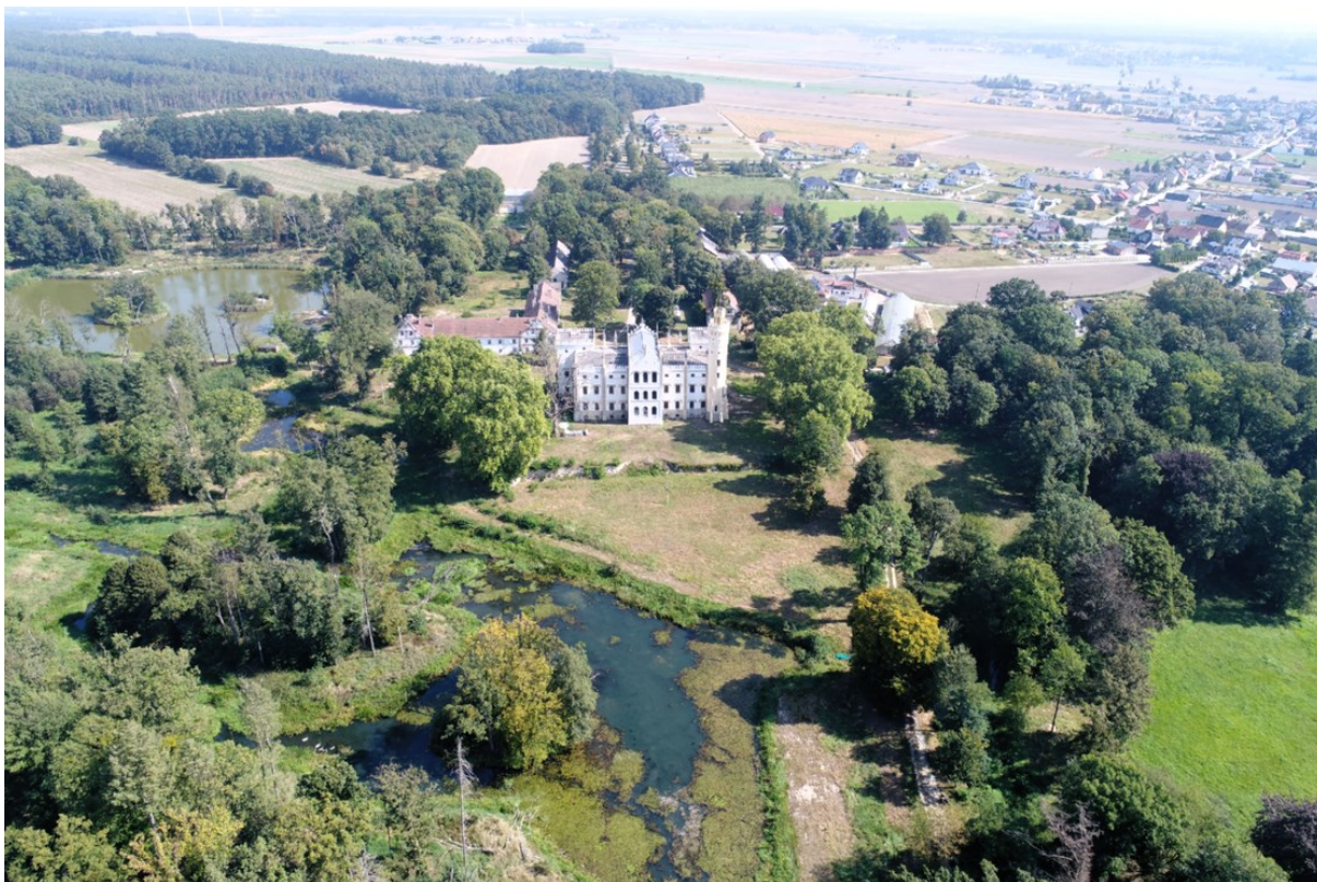
Rysunek 19 Widok pałacu i parku w Dobrej; źródło: fotografia Krzysztof Bucher

Pierwotny pałac został wzniesiony ok. 1720 lub 1750 r., następnie został całkowicie przebudowany i powiększony w latach 1857-60. Spalony w 1945 r. popadł w ruinę, obecnie odbudowywany przez prywatnego właściciela. Neogotycka budowla na planie prostokąta posiada dwa zwieńczone krenelażem boczne ryzality od strony fasady i jeden centralny od strony parku. Główne wejście mieści się w trójosiowym ryzalicie pośrodku 15-osiowej fasady, zwieńczonym trójkątnym szczytem schodkowym. Przy wschodnim narożu znajduje się cylindryczna wieża.