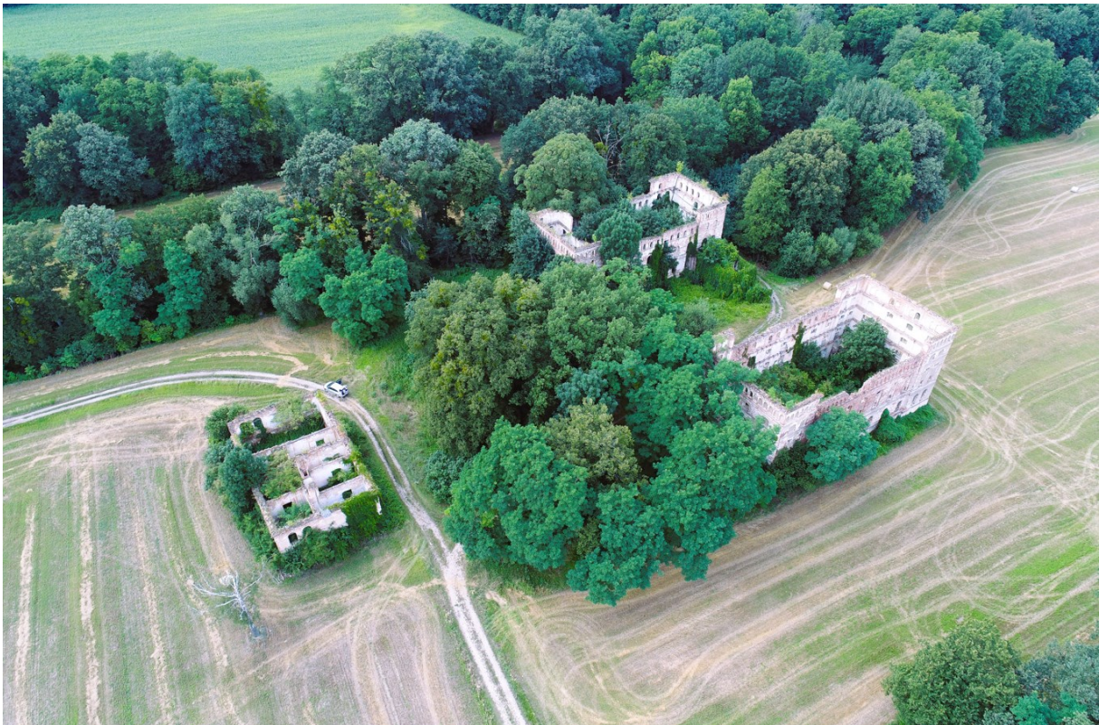
Rysunek 25 Dawny młyn wodny „Amerykan” pod Pisarzowicami

Przykładem połączenia wszystkim powyższych typów krajobrazów są tereny wokół dawnego młyna wodnego pod Pisarzowicami, tzw. „Amerykana”.