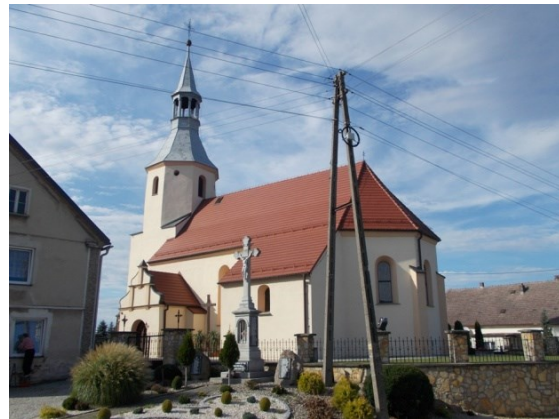
Rysunek 15 Widok kościoła w Pisarzowicach

W południowej ścianie znajduje się płyta nagrobna z ok. 1600 r. z wizerunkiem rycerza, wewnątrz także gotycko-renesansowy krucyfiks, neogotycki prospekt organowy, w oknach prezbiterium witraże z warsztatu A. Rednera. Kościół otoczony jest kamiennym murem. Zabytek w bardzo dobrym stanie.