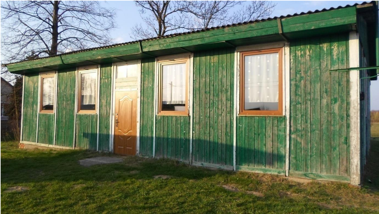
Fotografia własna 4: świetlica wiejska

Głównym źródłem utrzymania mieszkańców jest praca zarobkowa w różnych branżach gospodarki, emerytury oraz niewielkie gospodarstwa rolne prowadzone na własne potrzeby. Na uwagę zasługuje gospodarstwo rolne Państwa Lewandowskich, którzy oprócz działalności rolnej zajmują się hodowlą pszczół oraz prowadzą fermę drobiu.