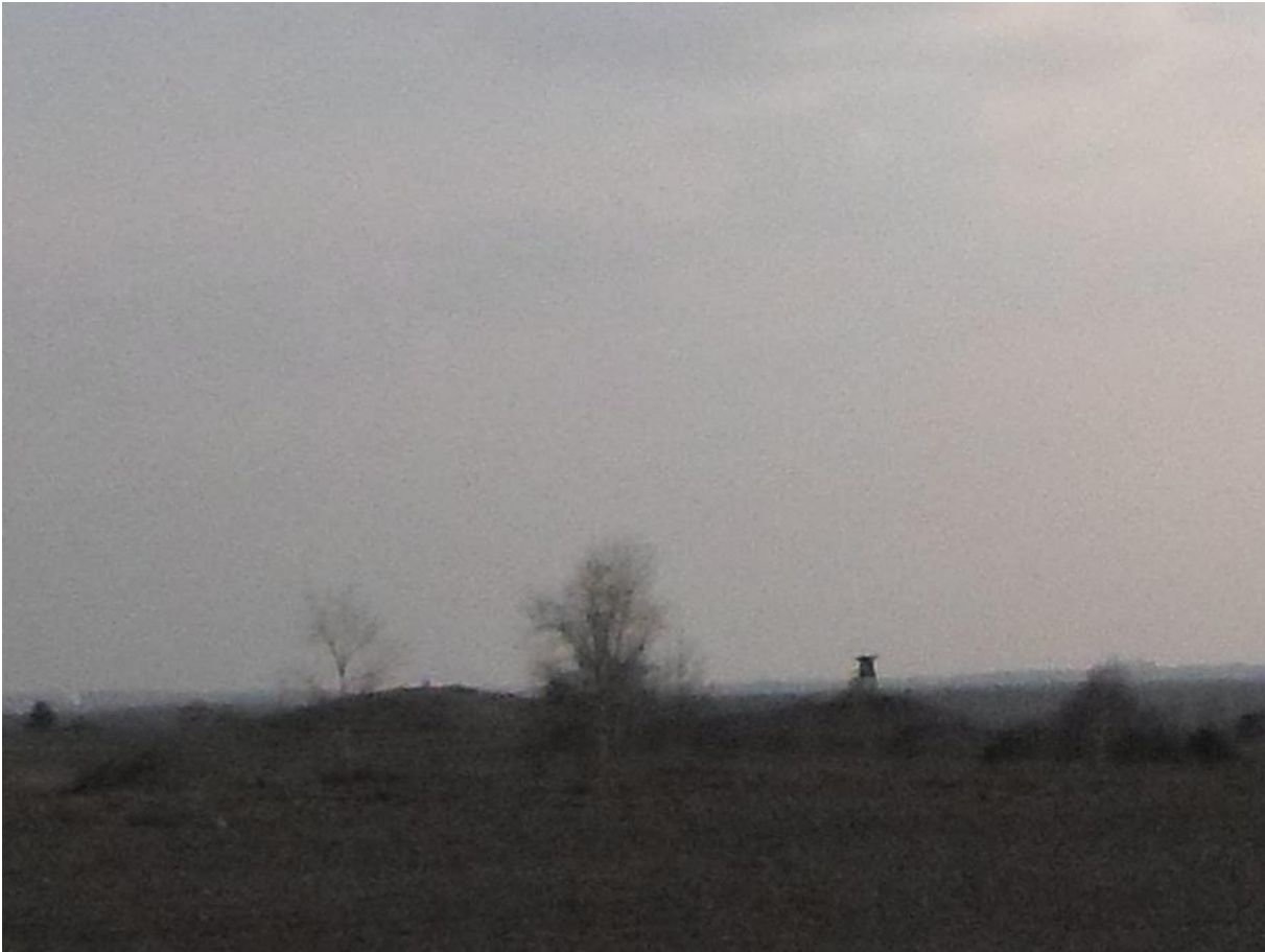
Fotografia własna 1 : Góry Ludwinowskie(Komaskie)