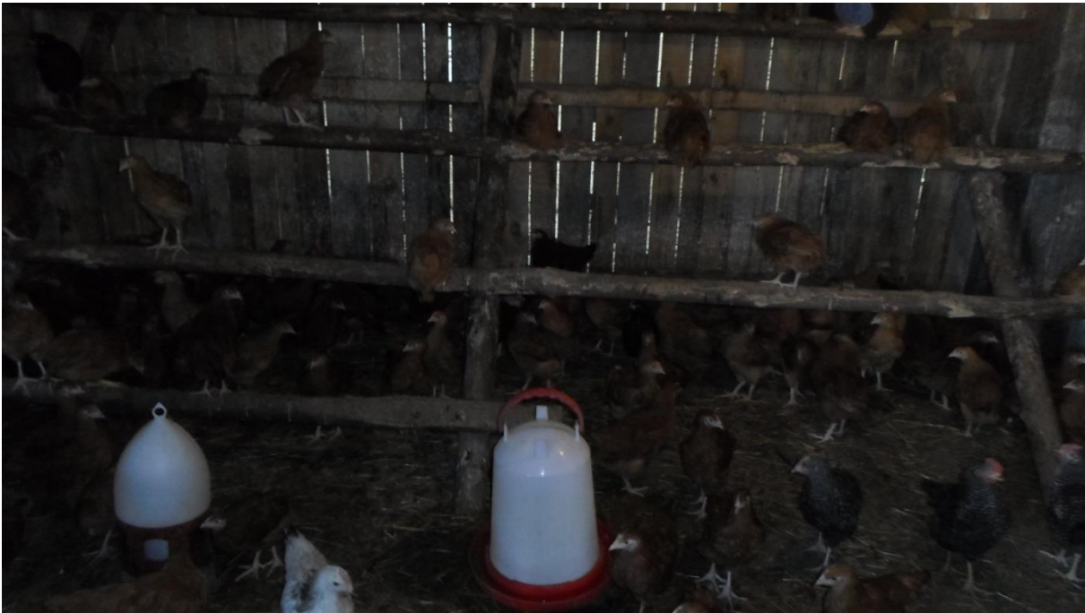
Fotografia własna 6: ferma drobiu