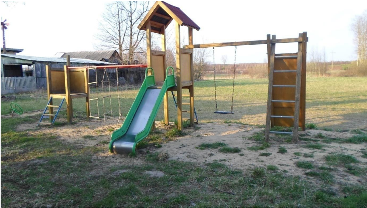
Fotografia własna 3: plac zabaw

Dzięki środkom z funduszu sołectkiego zostały zakupione elementy placu zabaw dla najmłodszych.