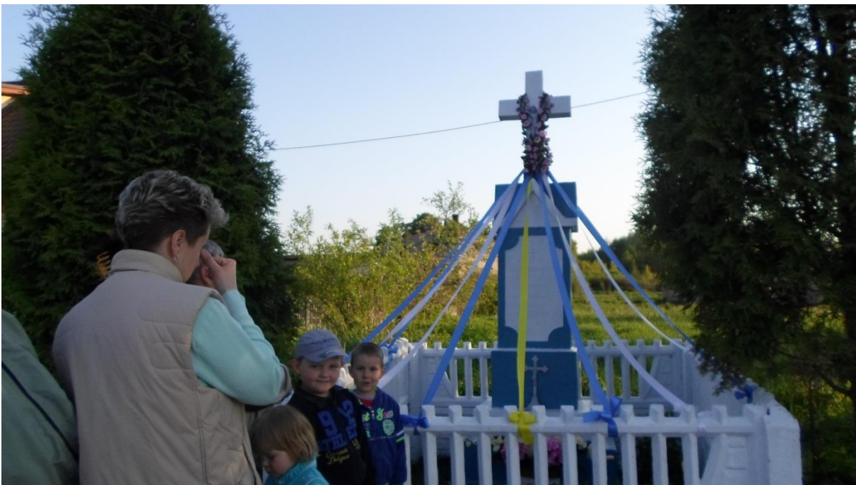
Fotografia własna 2: Kapliczka przydrożna