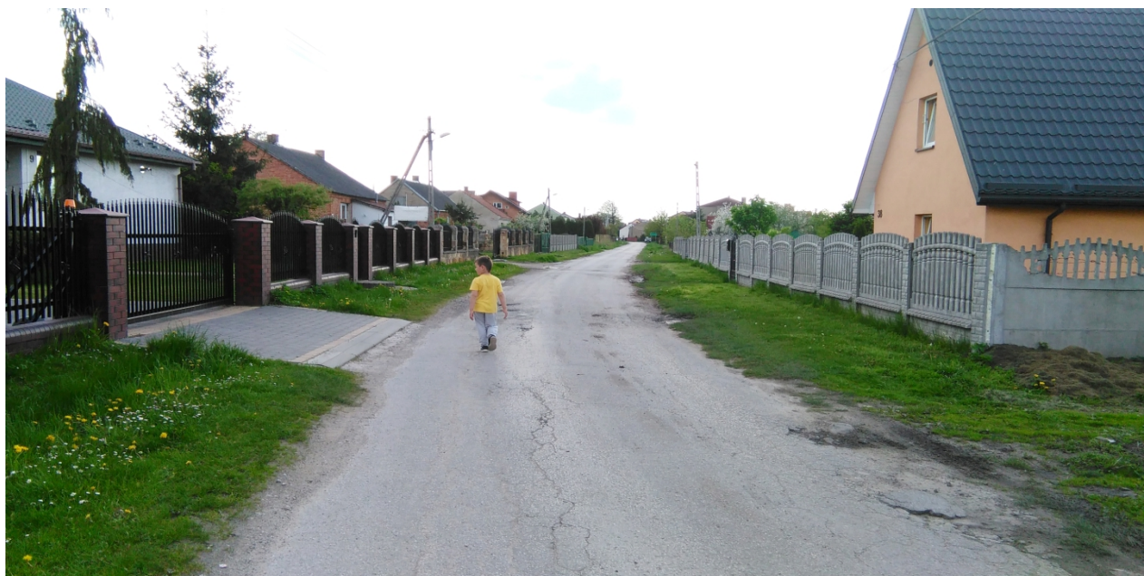
Miejscowość Miłaków-opracowanie własne.

Opracowanie takiego planu umożliwia korzystanie z funduszy Unii Europejskiej i innych źródeł finansowania. Realizacja założeń w nim zawartych może przyczynić się do lepszych warunków rozwoju społeczności lokalnej, atrakcyjności turystycznej wsi, powstania pozytywnych zmian w sołectwie w porozumieniu z mieszkańcami. Sołectwo Miłaków do realizacji tych celów, w maju 2015 r., wypracowało wspólnie z mieszkańcami "Plan Odnowy miejscowości Miłaków na lata 2015-2022", .