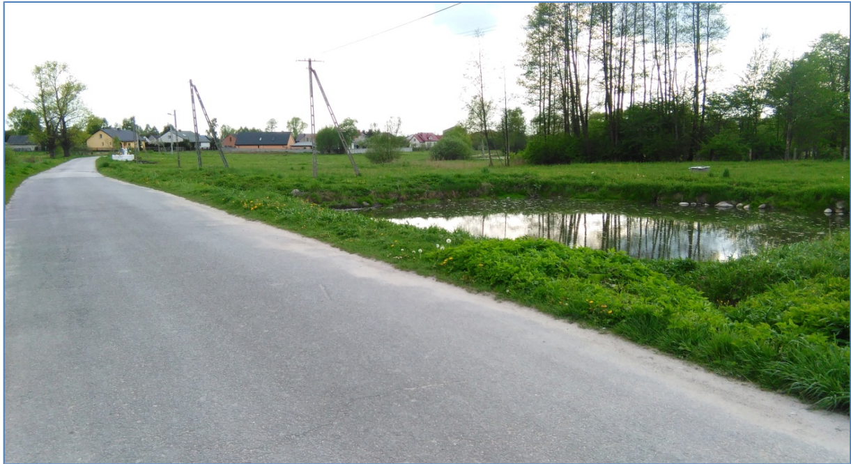
Staw wiejski Miłakowa- opracowanie własne.