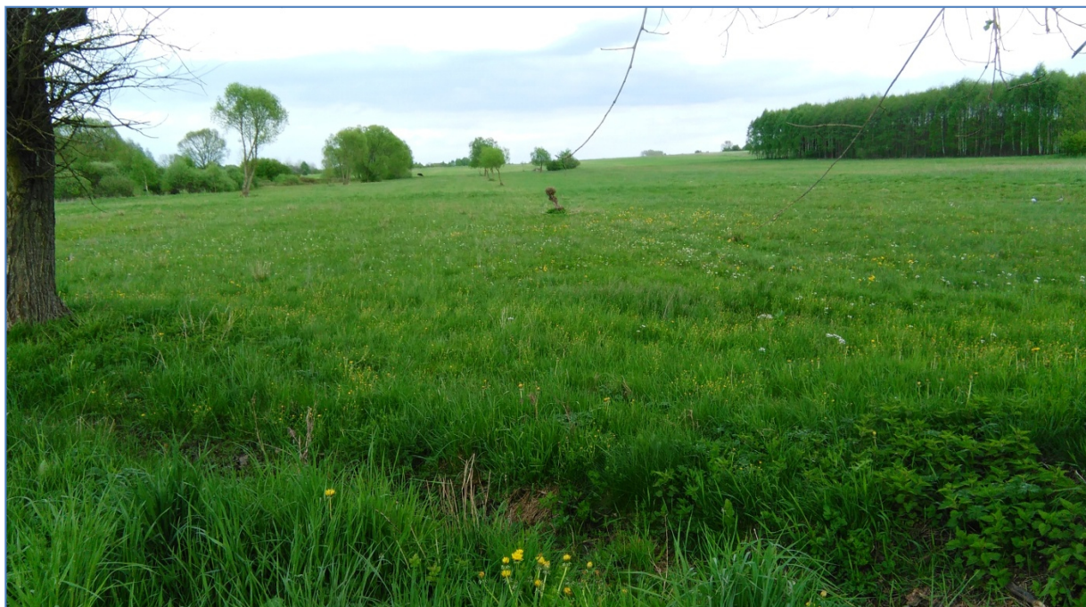
obraz Miłakowa- opracowanie własne.

Na terenie miejscowości Miłaków istnieje również niezagospodarowany zbiornik wodny o pojemności 500 m 3 .