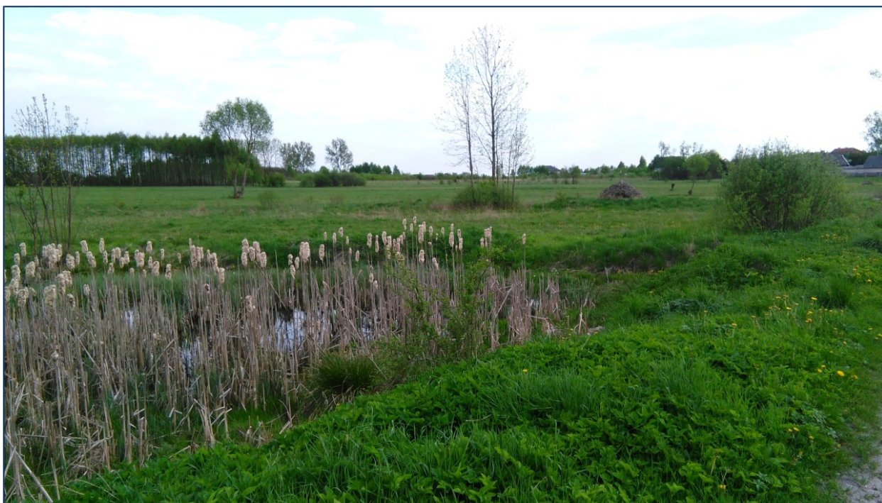
Podmokłe tereny Miłakowa- opracowanie własne.

Miejscowość Miłaków, jako jedna z sołectw gminy Gowarczów charakteryzuje się przeważnie podmokłymi terenami. Na terenie sołectwa niewielki udział mają gleby klas III około 1 %, w strukturze użytków, gleby klas IV i V zajmują po około 35 %, natomiast nieco ponad 25% stanowią gleby klasy VI. Czarne ziemie występują głównie na gruntach ornym i użytkach zielonych, słabe gleby bielcowe występują zarówno pod lasami jak i stanowią użytki rolne. Stan gleby na terenie sołectwa jest trudny do określenia, ponieważ brak jest szczegółowych badań nad ich, jakością.