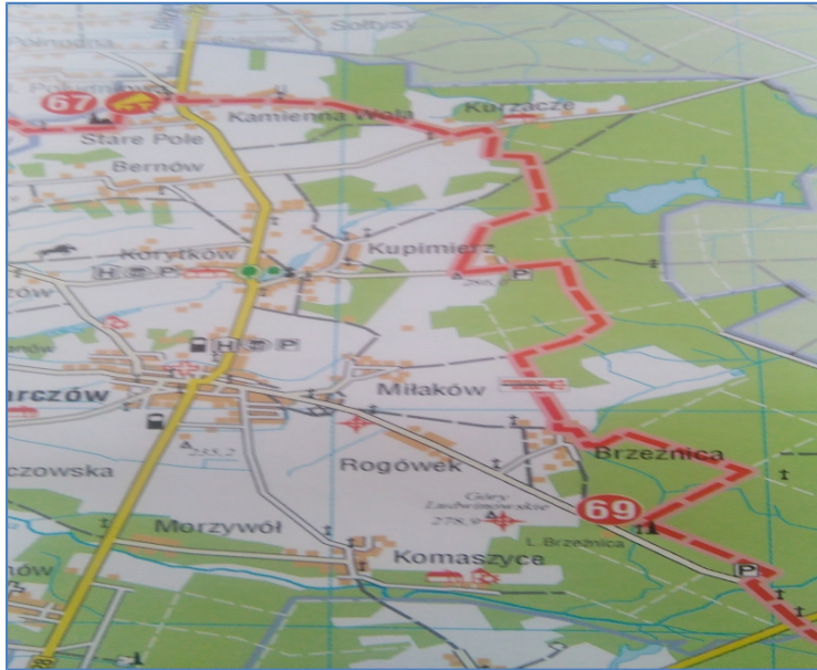
Fragment mapy z przebiegiem „Piekielnego szlaku”.

Poniższa tabela przedstawia strukturę użytków gruntowych sołectwa opracowaną na podstawie zestawienia gruntów: