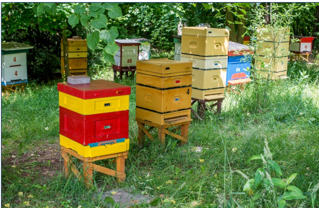
„Cichy” PASIEKA CICHY -Opracowanie własne