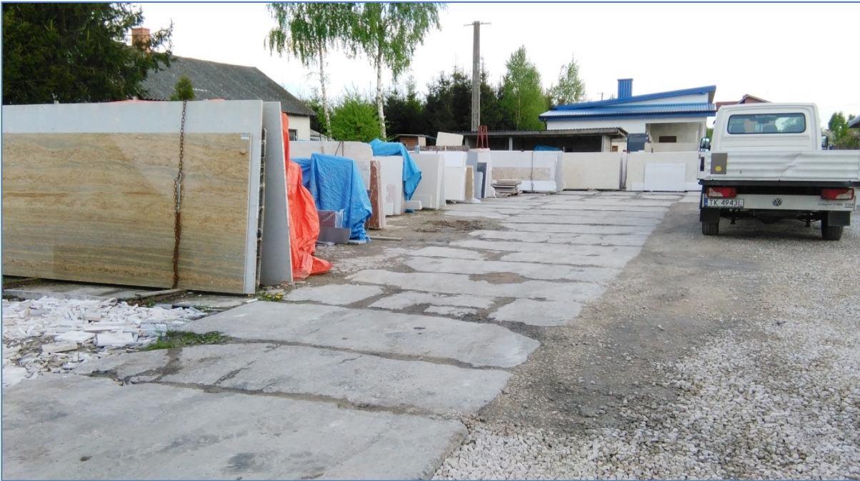
„Marmor”, źródło: Opracowanie własne.