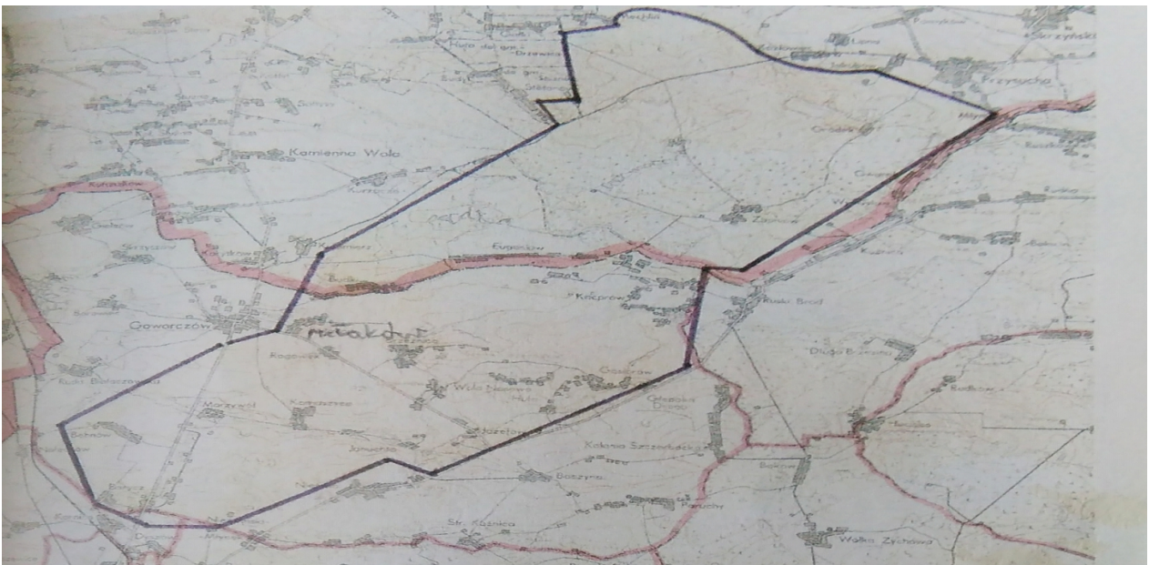
Obszar poligonu Barycz z 1951 roku na mapie powiatu koneckiego.