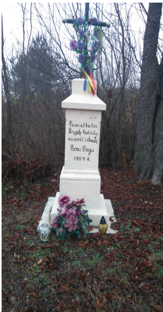
Zdjęcie Nr 5: Przydrożna Kapliczka