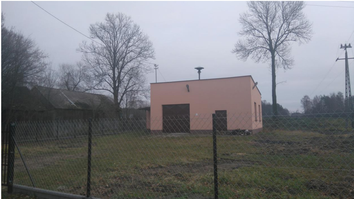
Zdjęcie Nr 2: Remiza strażacka OSP Borowiec

W miejscowości Borowiec funkcjonuje Ochotnicza straż pożarna.