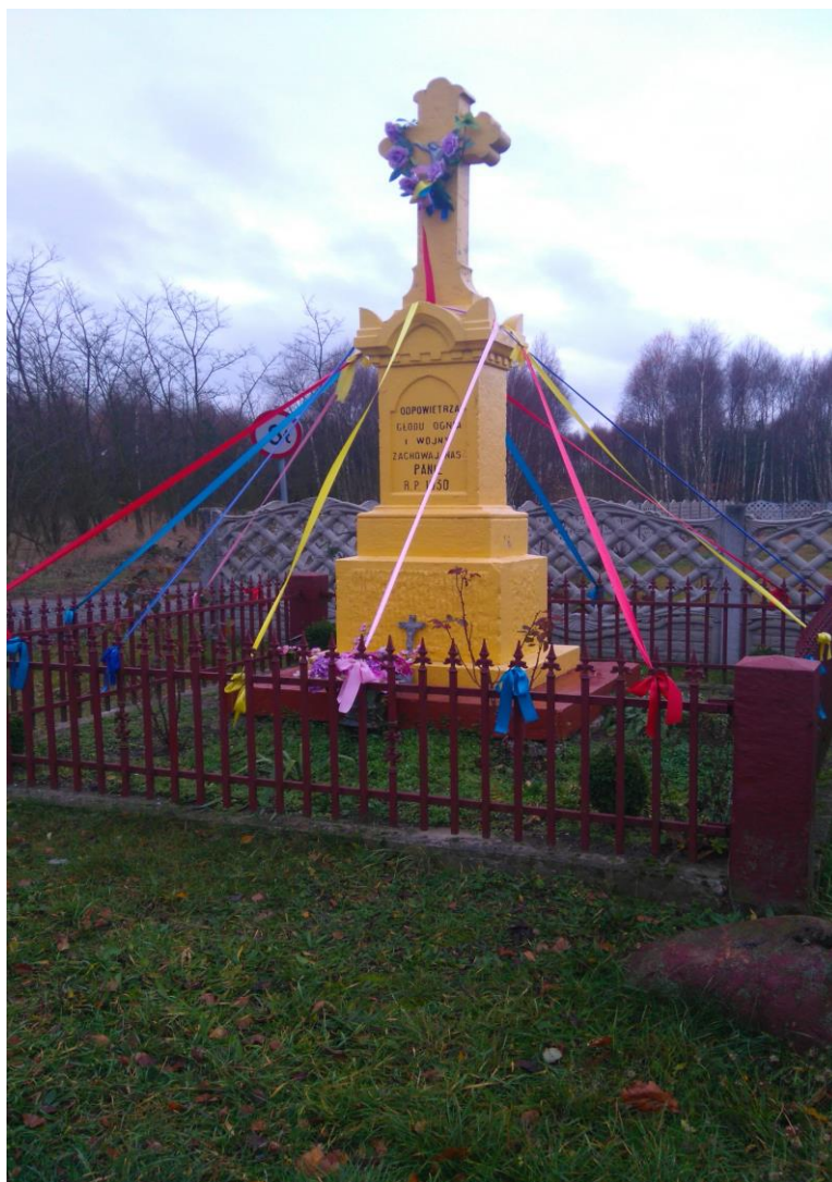
Zdjęcie Nr 7: Przydrożna Kapliczka w miejscowości Borowiec