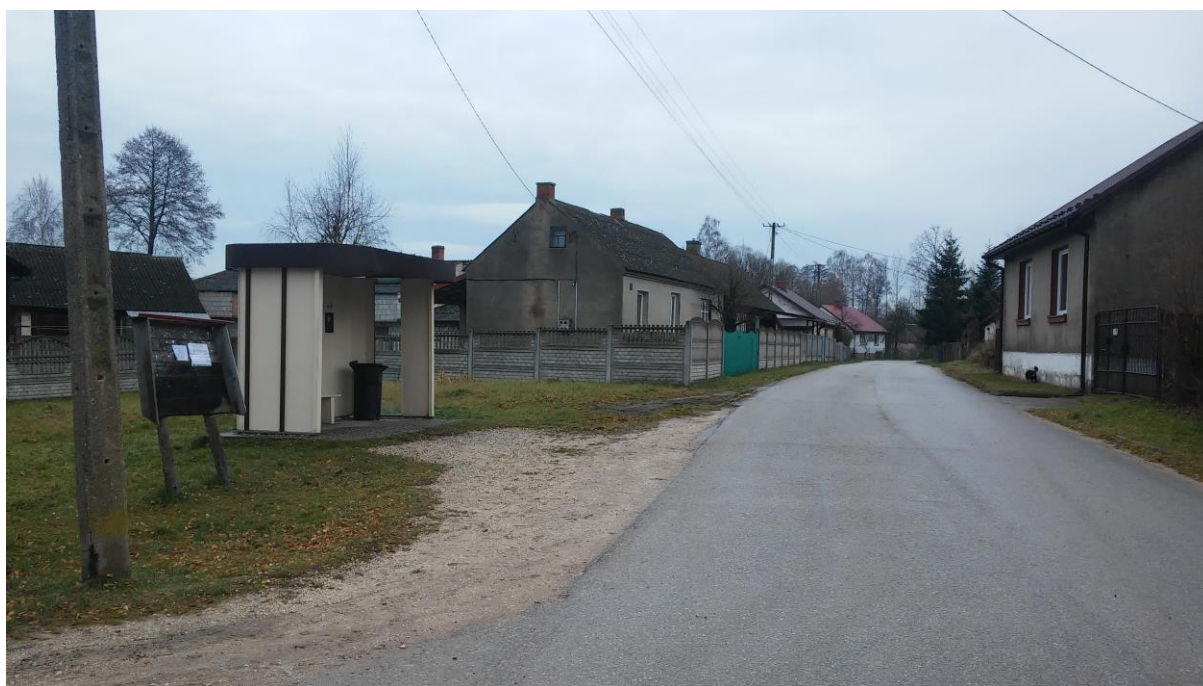
Zdjęcie Nr 1: Wieś Borowiec