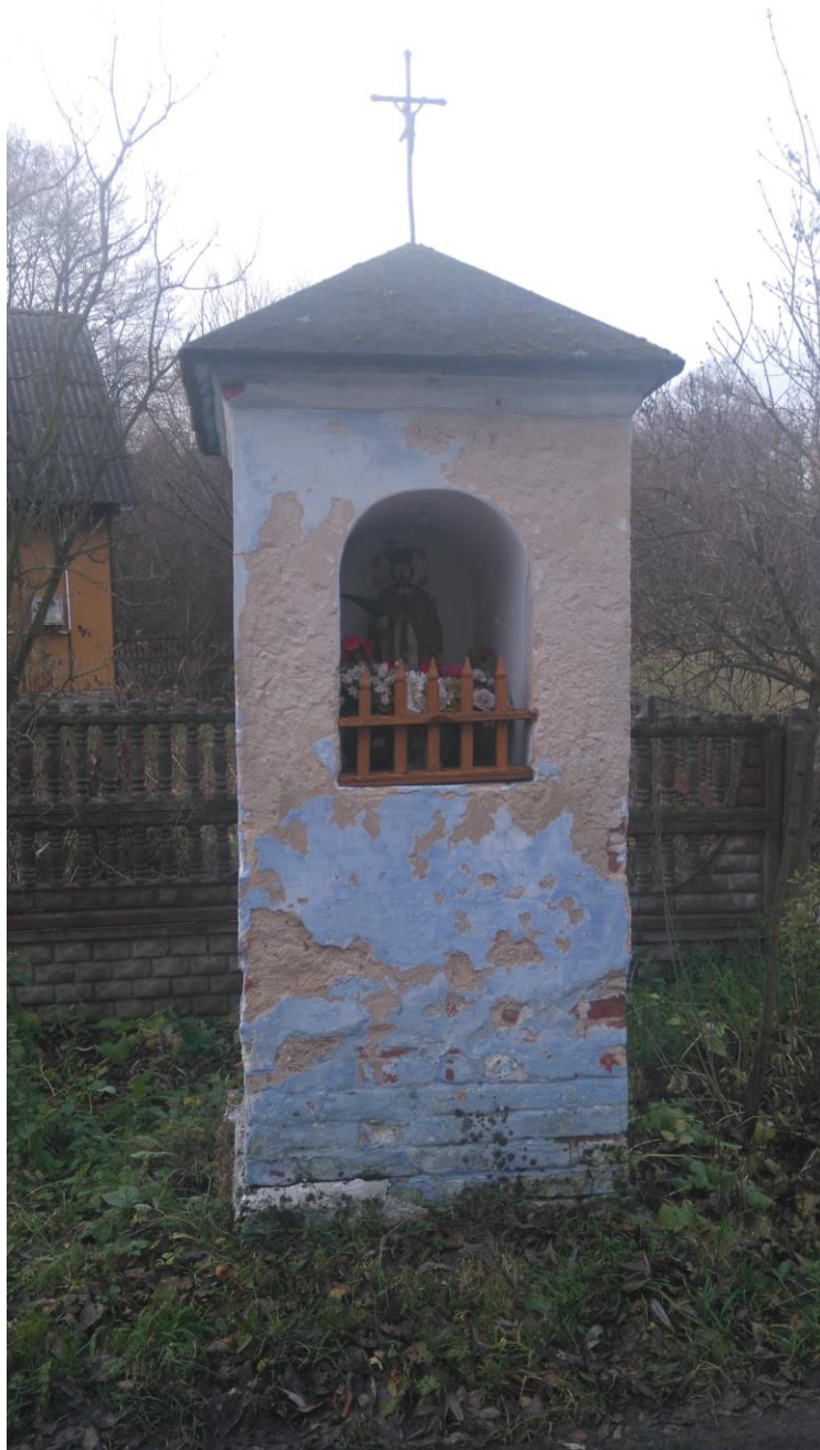
Zdjęcie Nr 6: Przydrożna Kapliczka w miejscowości Borowiec