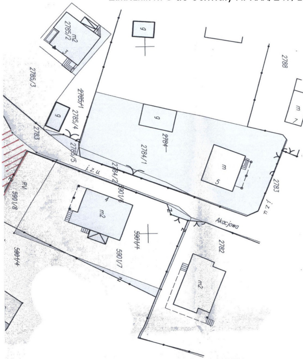
Załącznik Nr 3 do Uchwały Nr XXX/249/16 Rady Miejskiej w Staszowie z dnia 31 sierpnia 2016 r.