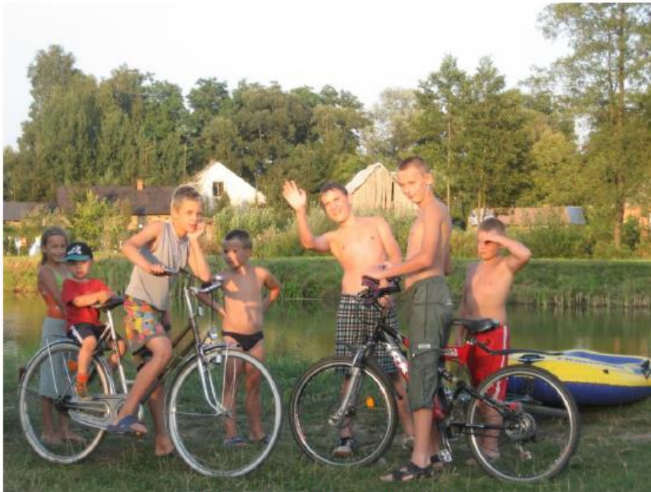
Wakacje nad stawem „Na Błoniu”