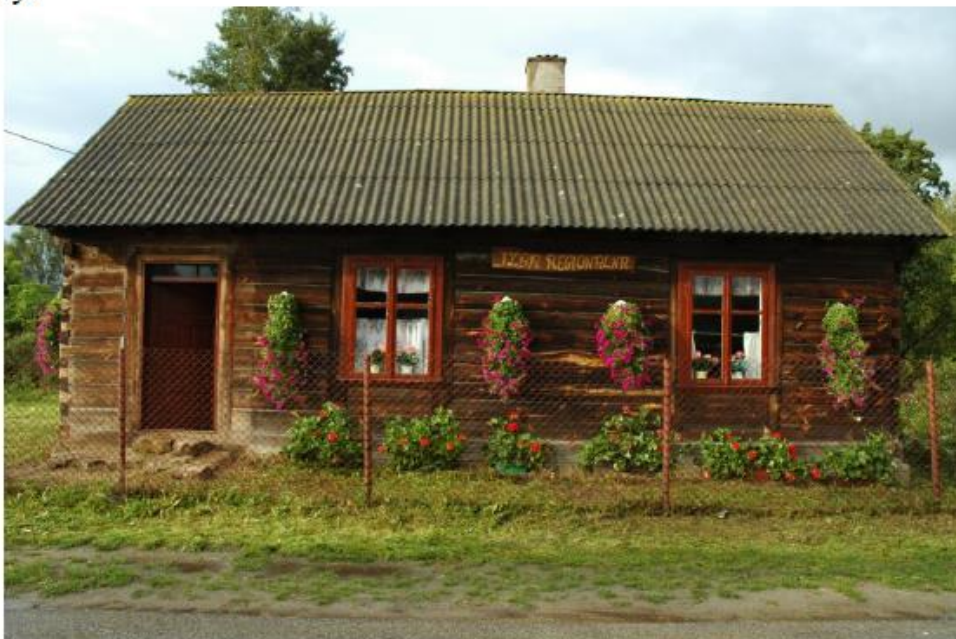
Izba Regionalna zorganizowana przez Stowarzyszenie w wydzierżawionej, charakterystycznej dla naszej wsi zagrodzie.

Natomiast jeśli chodzi o niematerialną stronę życia wiejskiego ( jakość życia oraz tożsamość wsi i wartości życia wiejskiego ) to sami odczuwamy, co potwierdziła analiza SWOT, że jest ona zadowalająco korzystna. Nie oznacza to jednak, że w tej dziedzinie nie mamy już nic do zrobienia. Mieszkańcy potrafią się zorganizować do wspólnego działania, a pewne doświadczenia w realizacji małych projektów sprawiają, że coraz lepiej przygotowani są do mądrego i planowego działania. Wielu z nas często bierze udział w szkoleniach organizowanych w naszej świetlicy, w Gminie oraz organizowanych przez inne Stowarzyszenia. Mamy nadzieję, że dzięki przynależności do Lokalnej Grupy Działania – U ŹRÓDEŁ, będziemy mieć lepszy dostęp do aktualnej wiedzy i możliwość korzystania z dodatkowych funduszy.