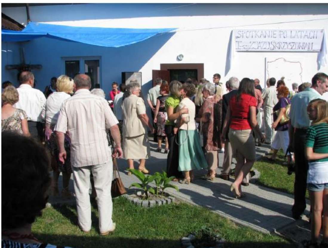
I Zjazd Skrzyszowian odbył się na Błoniu w sierpniu 2009 roku