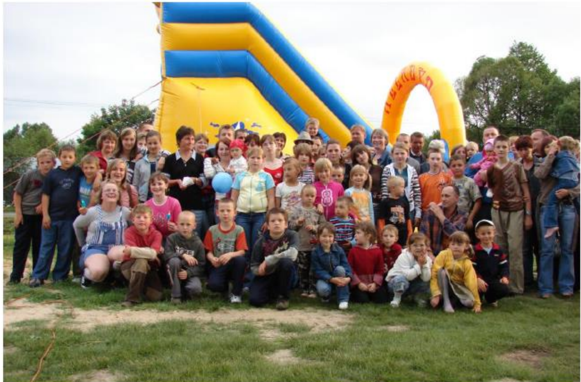
Na Dzień Dziecka tłumnie przybywają dzieci z sąsiednich miejscowości, a nawet z miast

Przez organizację festynów (żniwnego, święta wody), zawodów wędkarskich oraz pola biwakowego i letniej bazy noclegowej chcemy przyciągnąć turystów i w dalszej kolejności rozwinąć działalność dla ich potrzeb.