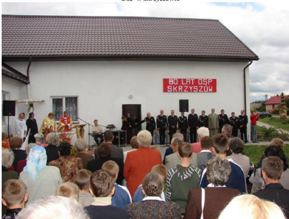
Obchody 80 lat OSP w Skrzyszowie (2008 rok)