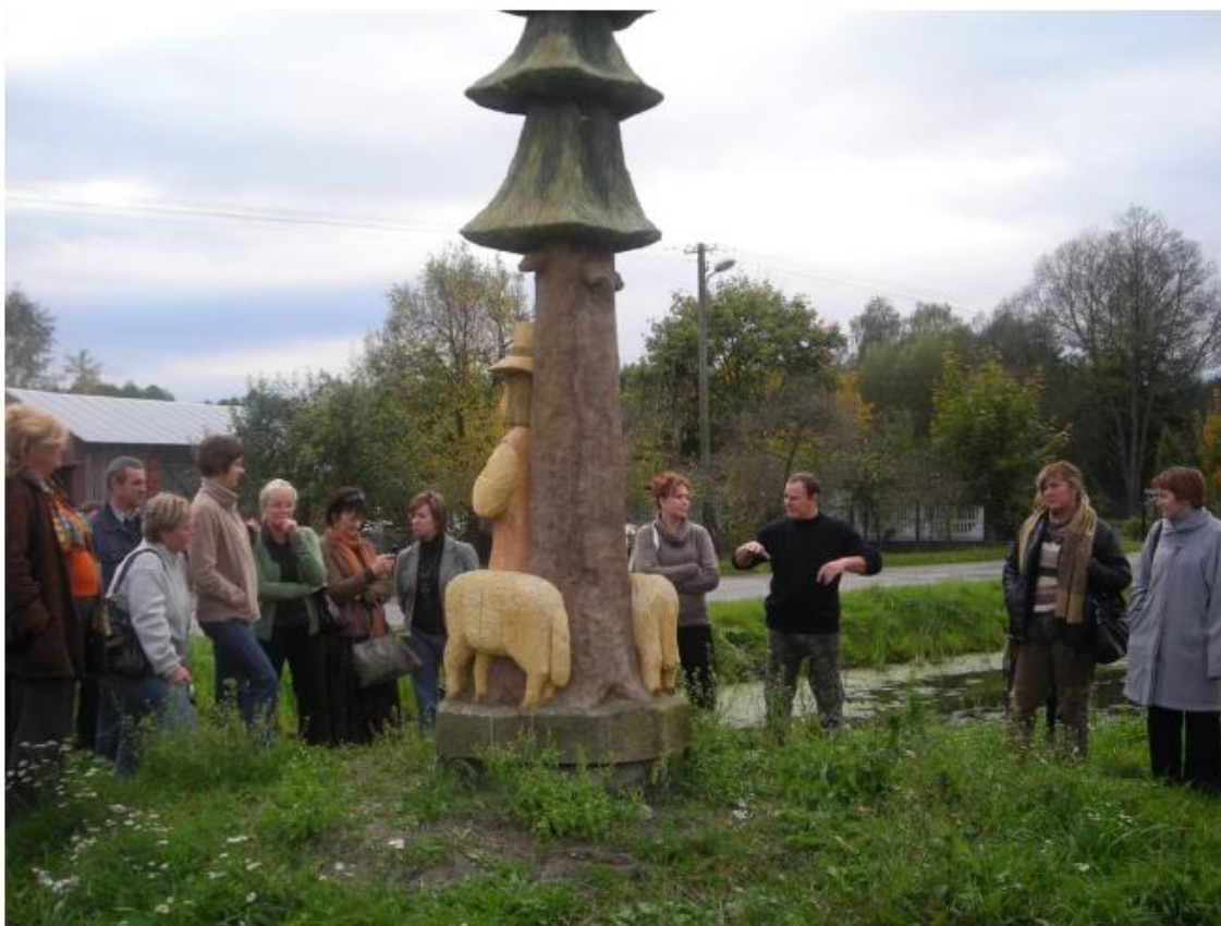
Wycieczka przed rzeźbą na Błoniu (2010 rok)