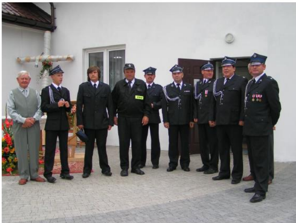
Przed budynkiem nowej świetlicy w dniu obchodów 80 rocznicy istnienia OSP w Skrzyszowie