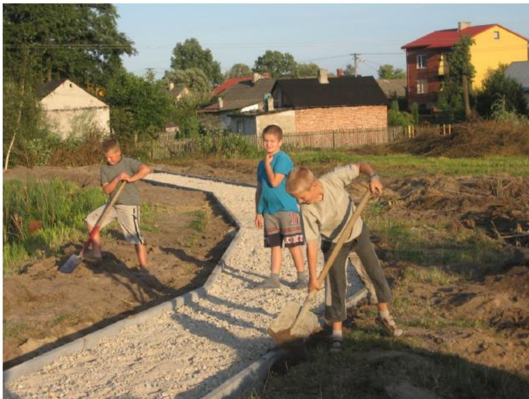
Nawet najmłodszy włączyli się do prac (2007 rok)