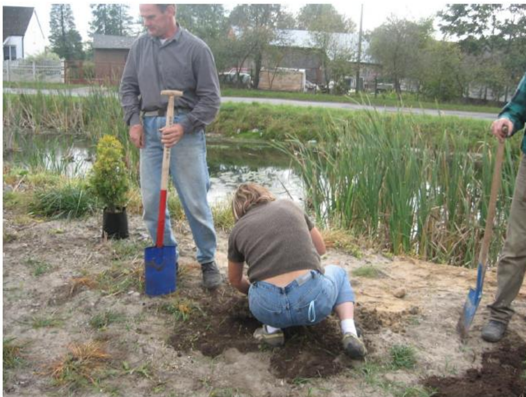
Urządzanie zieleni na Błoniu (2007 rok)