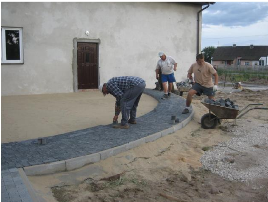
Prace wykonywane przez mieszkańców w ramach odnowy wsi w 2007 roku