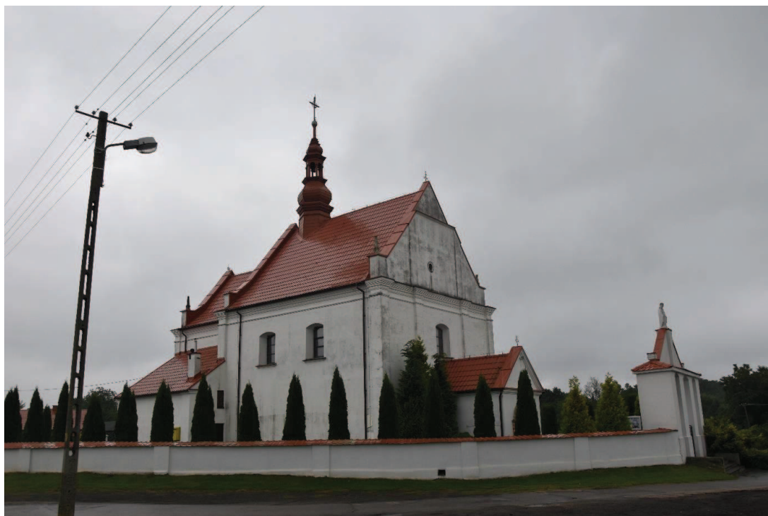
Fot. 2. Kościół parafialny p.w. św. Katarzyny w Łukawie.