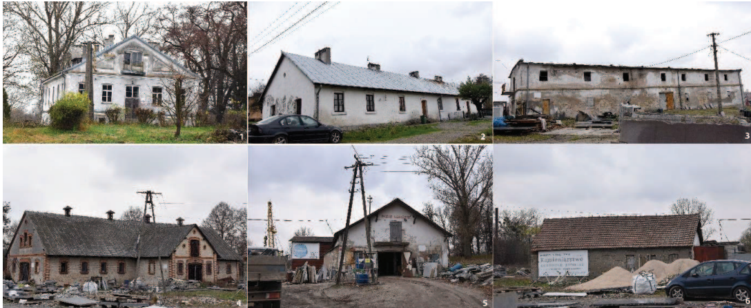
Fot. 3. Zabudowania wchodzące w skład zespołu dworsko-parkowego z folwarkiem w Wilczycach. 1) Dwór; 2) Czworak; 3) Czworak, ob. magazyn; 4) Obora; 5) Obora; 6) Magazyn.