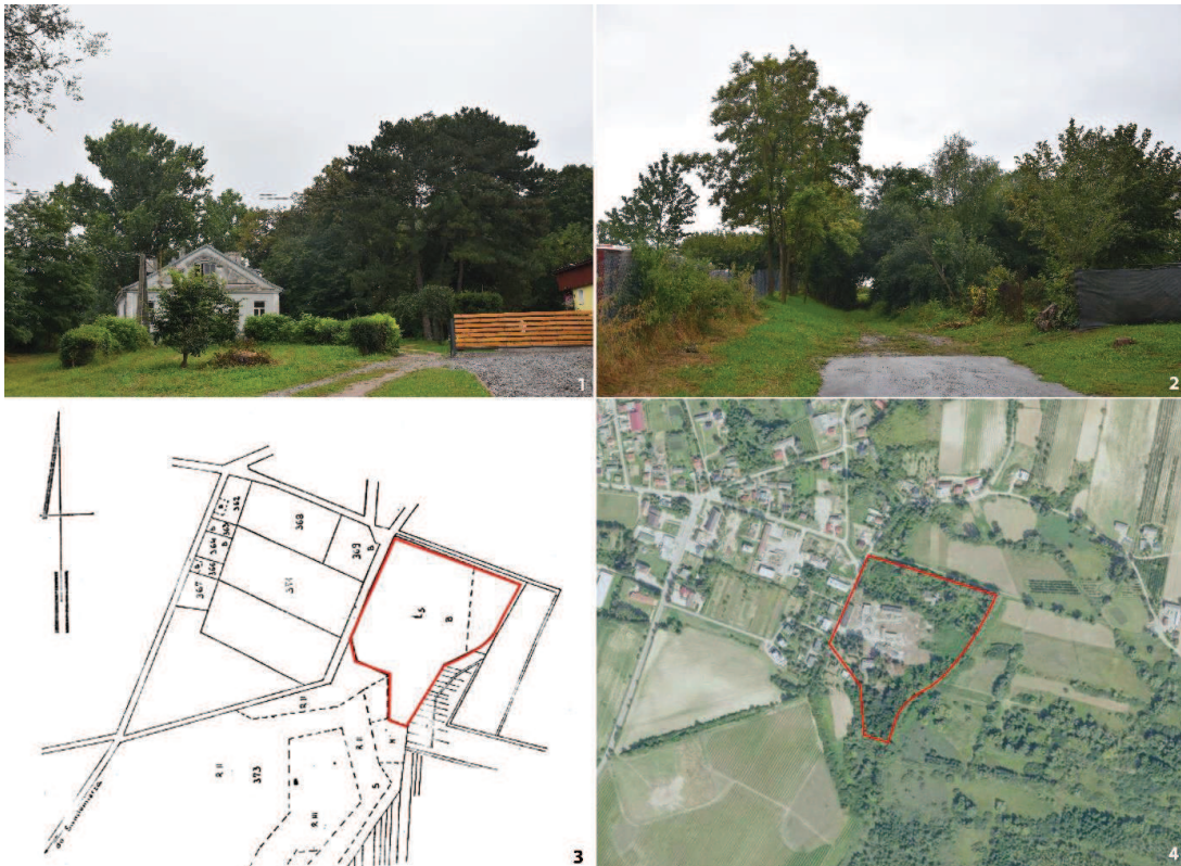
Fot. 4. Park w zespole dworsko-parkowym z folwarkiem w Wilczycach. 1) Widok od zach.; 2) Widok od pn.; 3) Mapa, skala 1:5000, podkład: Karta parku; 4) Mapa, skala 1:5000, podkład: www.geoportal.gov.pl.