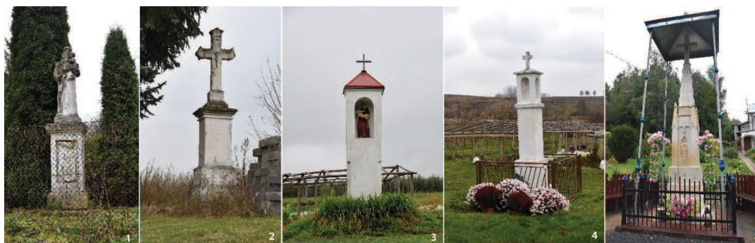
Fot. 5. Przykładowe kapliczki występujące na terenie gminy Wilczyce. 1) Daromin; 2) Łukawa; 3) Ocinek; 4) Radoszki; 5) Tulkowice.

W przeważającej większości obiekty te zachowane są w dobrym stanie technicznym, otoczone opieką właścicieli prywatnych, władz samorządowych czy stowarzyszeń. Niestety niejednokrotnie efektem wielokrotnych remontów, napraw czy renowacji przeprowadzanych bez znajomości podstawowych zasad postępowania z obiektami zabytkowymi są niekorzystne zmiany i przekształcenia tych obiektów będące wynikiem stosowania niewłaściwych materiałów (beton, lastrico, płytki ceramiczne, metal, współczesne tynki, olejne farby, wymiana stolarki), przekształceń ich formy, dekoracji architektonicznej, likwidacji elementów zdobniczych.