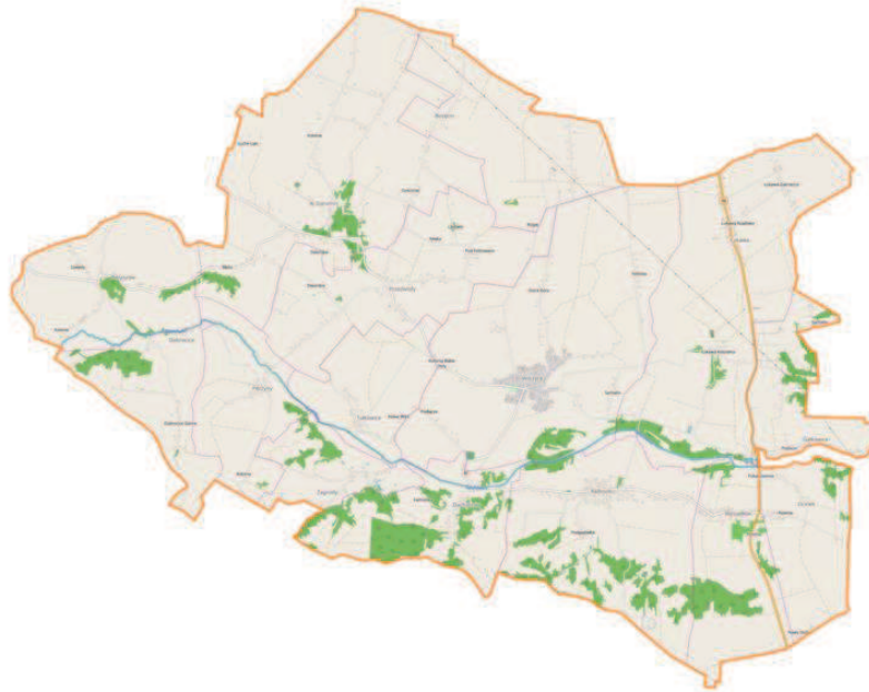
Ryc. 1. Położenie Gminy Wilczyce.

Gmina Wilczyce jest gminą wiejską położoną w województwie świętokrzyskim, w powiecie sandomierskim. Sąsiaduje z gminami: Dwikozy, Lipnik, Obrazów, Ożarów i Wojciechowice. Znajduje się we wschodniej części Wyżyny kielecko-sandomierskiej, w dolinie rzeki Opatówki, w pobliżu miasta Sandomierz, w odległości ok. 90 km od Kielc, będących największym miastem regionu i jednocześnie miastem wojewódzkim. Siedzibą gminy są Wilczyce.