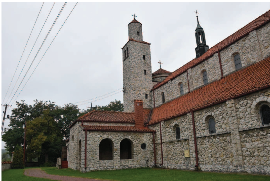
Fot. 1. Kościół parafialny p.w. Najświętszego Serca Pana Jezusa w Jankowicach Kościelnych.