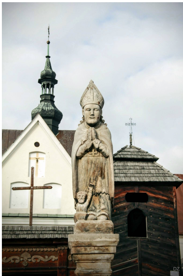
Fot. 2 Figura Św. Stanisława biskupa na tle modrzewiowej bramy i kościoła parafialnego pw. Najświętszej Maryi Panny w Krynkach z 1727 r.