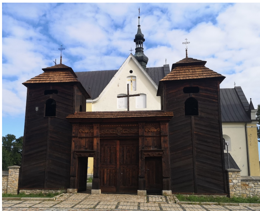
Fot. 3 Brama drewniana z dwiema dzwoniczami datowana na 1779 r.