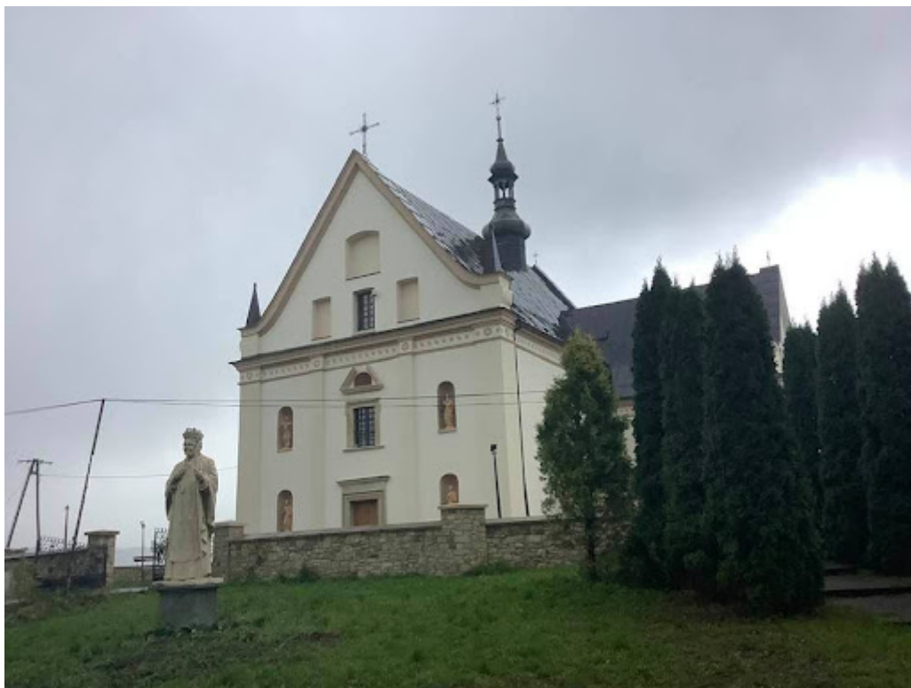
Fot. 1 Kościół parafialny pw. Najświętszej Maryi Panny w Krynkach z 1727 r.

Jednym z cenniejszych zabytków naszej gminy wyróżniający się na tle innych w naszym regionie jest zespół kościoła parafialnego w miejscowości Krynki. Pochodzi z okresu od XV- XVIII wieku i został uznany za zabytek decyzją WKZ w Kielcach z dnia 04.10.1956 r., a następnie 23.06.1967 r. wpisany do rejestru zabytków woj. Kieleckiego. W skład zespołu kościoła parafialnego wchodzi kościół, brama drewniana z dwiema dzwonicami oraz otoczenie w granicach ogrodzenia (cmentarz przykościelny).