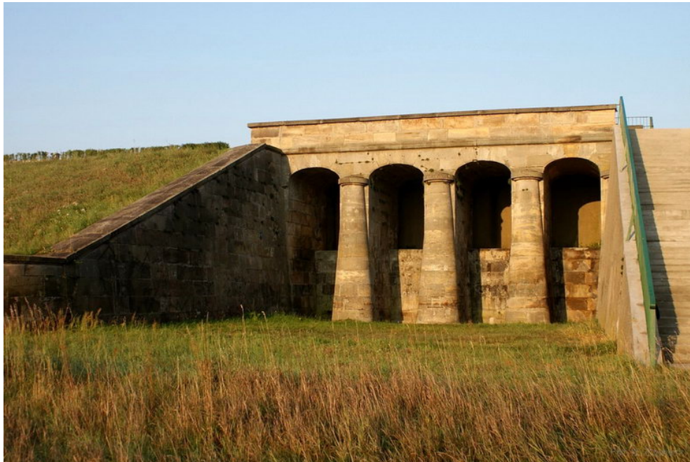
Fot. 4 Zabytkowy przelew wodny z 1840 r.

Kolejnym cennym zabytkiem są pozostałości układu wodnego, w skład którego wchodzi tama oraz przepust uznany za zabytek budownictwa przemysłowego oraz wpisany do rejestru zabytków woj. Kieleckiego dnia 15.06.1967 r. Zabytkowy przelew z uwagi na jego duże znaczenie znalazł się w herbie gminy Brody.