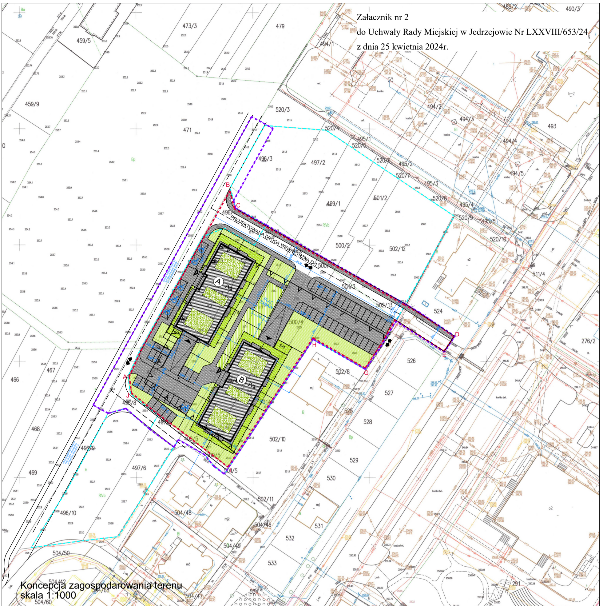
Koncepcja zagospodarowania terenu skala 1:1000

Załącznik nr 2 do Uchwały Rady Miejskiej w Jędrzejowie Nr LXXVIII/653/24 z dnia 25 kwietnia 2024r.