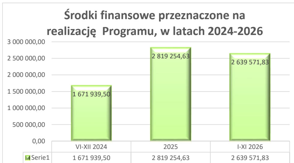
Wykres Nr 2. Środki finansowe przeznaczone na realizację Programu, w podziale na lata 2024-2026 (w zł)