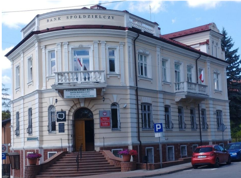
kamienica przy ulicy dr. Zysmana 1 w Klimontowie (obecnie siedziba banku spółdzielczego oraz urzędu miasta i gminy)

Do ważnego elementu krajobrazu należą zespoły kościelne w Goźlicach, Olbierzowicach i Klimontowie. Pierwszymi parafiami były Goźlice oraz Olbierzowice, zaś niektóre obszary obecnej gminy należały do parafii ościennych. Sama parafia klimontowska powstała późno, bo w XVII w. Z zabudowy sakralnej, jaka dziś znajduje się na omawianym terenie wspomnieć należy kościół w Goźlicach, cenną budowlę, która obecnie stanowi ważną dominantę krajobrazową północnych obszarów gminy. Kościół w Olbierzowicach jest szczególnie ważnym składnikiem krajobrazu zachodniej części gminy, gdyż położony na wzgórzu, posiadający wysoką wieżę, kościół jest widoczny z odległości kilkunastu kilometrów. Dominuje nad doliną Koprzywianki i posiada łączność widokową ze świątyniami Klimontowa. Istotnym elementem krajobrazu kulturowego jest dawna synagoga, wybudowana w stylu klasycystycznym w połowie XIX wieku. Synagoga jest świadectwem po dawnej społeczności żydowskiej.