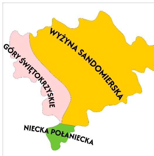
Gmina Klimontów – regionalizacja fizyczno-geograficzna obszaru według Kondrackiego

o powierzchni 1 135,97 ha, wydzielony na potrzeby ochrony siedlisk takich jak, starorzecza, łąki świeże i trześlicowe, murawy kserotermiczne i napiaskowe, łągi, buczyny, dąbrowy, bory bagienne czy grądy ze stanowiskami rzadkich roślin, wiśni karłowatej i ornaty złocistej. Występują tu rzadkie mięczaki – poczwarówka zwężona i skójka gruboskorupowa, owady – pachnica dębowa i modraszek, także ryby – głowacz białopłetwy, minóg i różanka, płaz – kumak nizinny i ssaki, w tym nietoperz – mopek zachodni, bóbr i wydra. Jeleniowsko-Staszowski OChK obejmuje ochroną głównie charakterystyczne dla regionu kserotermiczne zbiorowiska roślinne pochodzenia południowoeuropejskiego (pontyjskie); obszar Jeleniowsko-Staszowskiego OChK w gminie Klimontów zajmuje część położoną w Górach Świętokrzyskich i charakteryzuje się środowiskiem z wysokimi temperaturami gleby i powietrza oraz niedoborami w suplementacji wody i pozwala na utrzymywanie się wyżej wymienionego rodzaju siedlisk, zdomowianych przez różne rośliny kserotermiczne i piaskolubne.