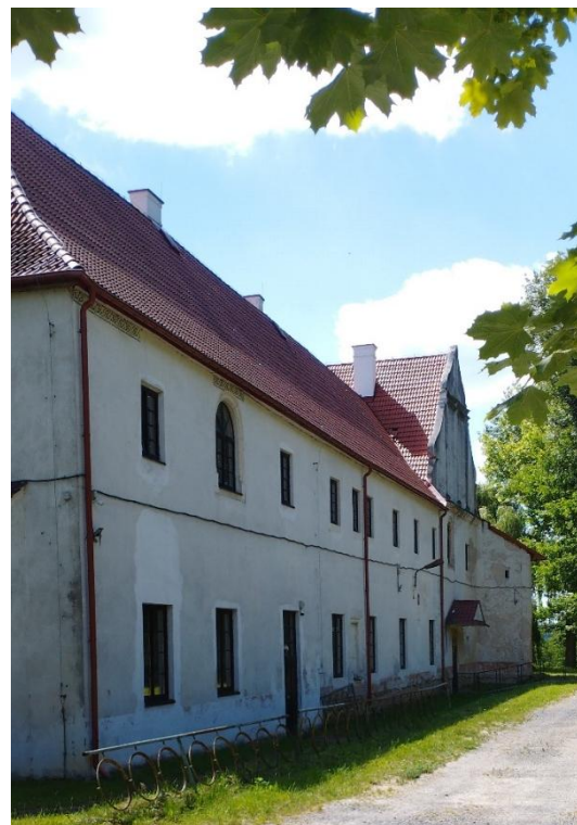
Kościół pw. NMP i św. Jacka oraz klasztor poddominikański