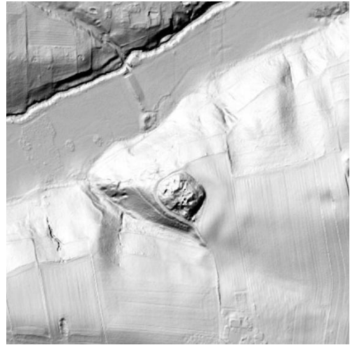
Gródek (Zamek) na Mapie Galicji Zachodniej z lat 1801-1804 ( https://maps.arcanum.com ) oraz na mapie NMT ( https://mapy.geoportal.gov.pl )