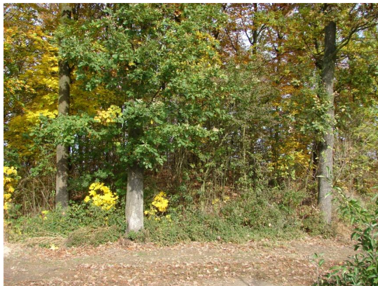
Kurhan w Nowej Wsi

Innymi interesującymi zabytkami archeologicznymi są kurhany w Nowej Wsi, Konarach Kolonii czy Olbierzowicach na cmentarzu. Kopiec w Nowej Wsi o średnicy 20 m i wysokości 2 m, odkryty został w 1991 roku przez M. Florka, a w 1994 roku wpisany do rejestru zabytków. Kopiec w Olbierzowicach, znajdujący się obecnie na cmentarzu parafialnym, na Mapie Galicji Zachodniej z lat 1801-1804 oznaczony był, tak jak i poprzedni, krzyżem. Na początku XIX wieku kurhany te musiały być doskonale widoczne w topografii.