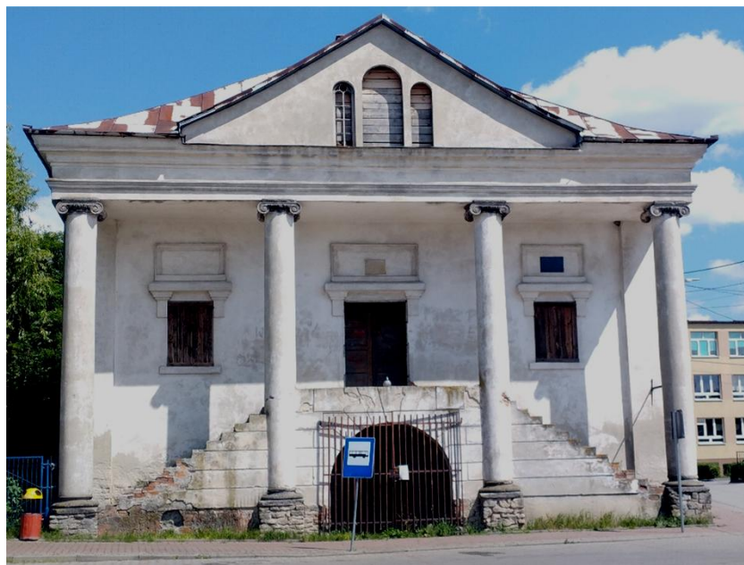
synagoga w Klimontowie