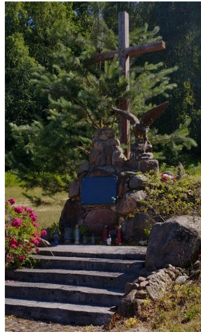
pomnik poświęcony powstańcom styczniowym w Olbierzowicach i Rybnicy

W ramach represji popowstaniowych wiele miast straciło prawa miejskie. Klimontów w 1870 roku sam zrezygnował z praw miejskich.