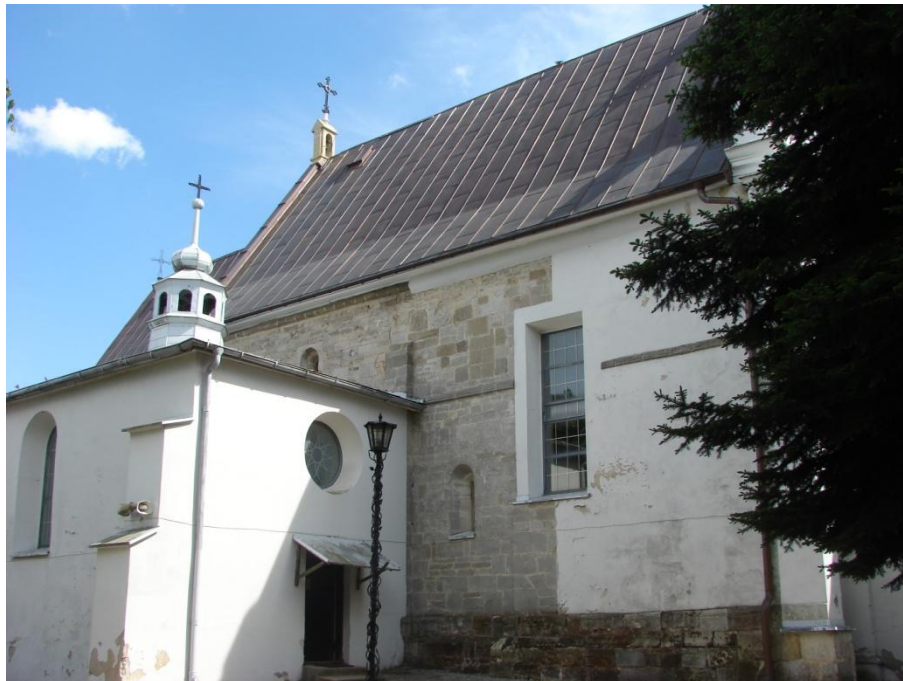
kościół w Goźlicach od północy

- kościół pw. WNMP w Goźlicach, w zrębie romański, orientowany, murowany, z początku. XIII w. Uszkodzony w czasie najazdów tatarskich, powiększony w XV w. W latach 1559-1620 użytkowany jako zbór przez kalwinów, następnie rozbudowany w latach 1620-1639. Odnowiony w 1879 r. spalony w czasie działań wojennych 1915 r. i 1945 r. Wyeksponowane elementy romańskie przy odbudowach 1920 r. i lat 1946-1948.