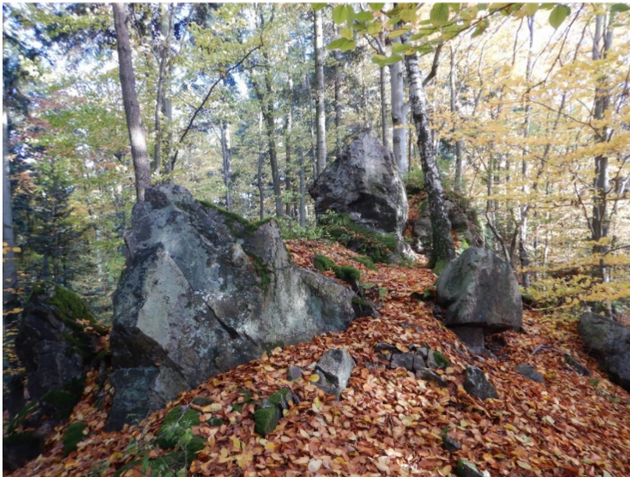
Fot. 2. Kamieniec koło Kostomłotów – skałki w obrębie pomnika przyrody, listopad 2025 r.