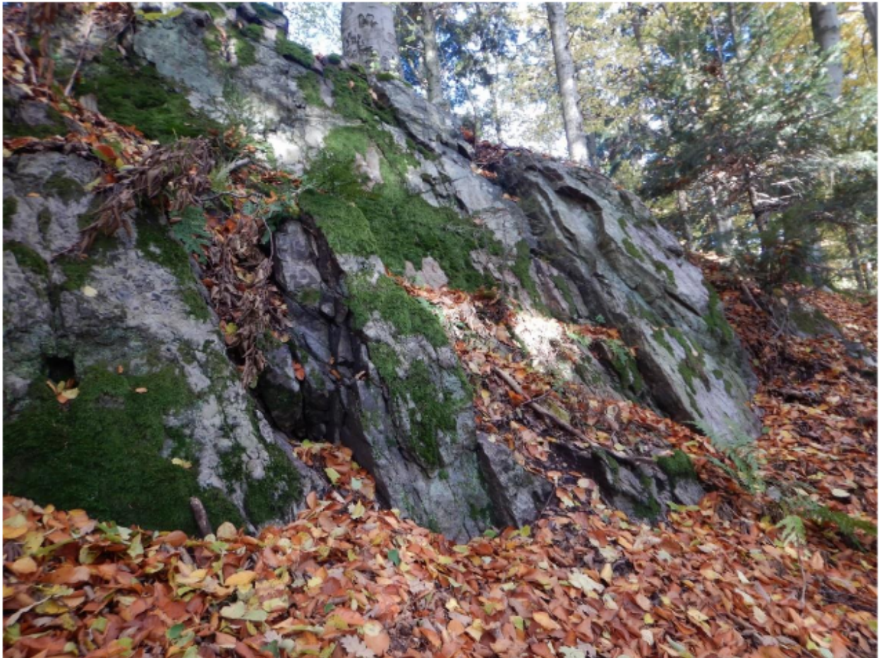
Fot. 1. „Kamieniec koło Kostomłotów” – skałki w obrębie pomnika przyrody, listopad 2025 r. (fot. A. Kasza).

Załącznik nr 3 do uchwały nr XXVIII/222/2026 Rady Gminy Masłów z dnia 22 stycznia 2026 r.