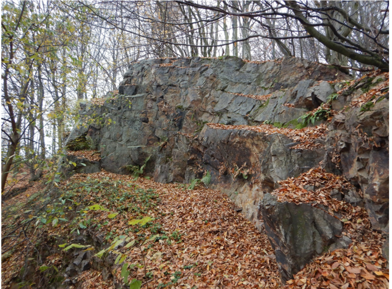
Fot. 1. „Skalki Kamieńczyk na Klonówce” – skalki w południowej części (II) pomnika przyrody od strony północno-wschodniej, listopad 2025 r..

Załącznik nr 3 do uchwały nr XXVIII/223/2026 Rady Gminy Masłów z dnia 22 stycznia 2026 r.