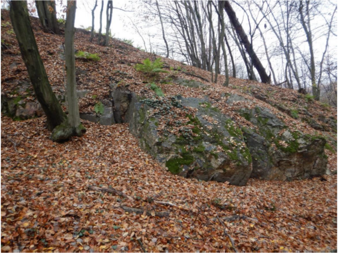
Fot. 2. Skalki Kamieńczyk na Klonówce – skalki w północnej części (I) pomnika przyrody od strony południowo-zachodniej, listopad 2025 r. (fot. A. Kasza).