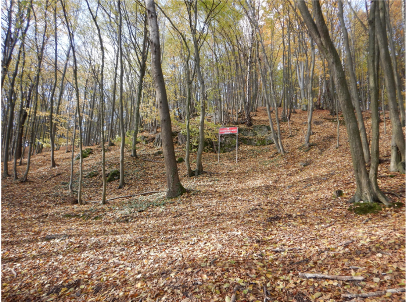
Fot. 1. Skalki w zachodniej części (I) pomnika przyrody od strony wschodniej, listopad 2025 r..

Załącznik nr 3 do uchwały nr XXVIII/224/2026 Rady Gminy Masłów z dnia 22 stycznia 2026 r.