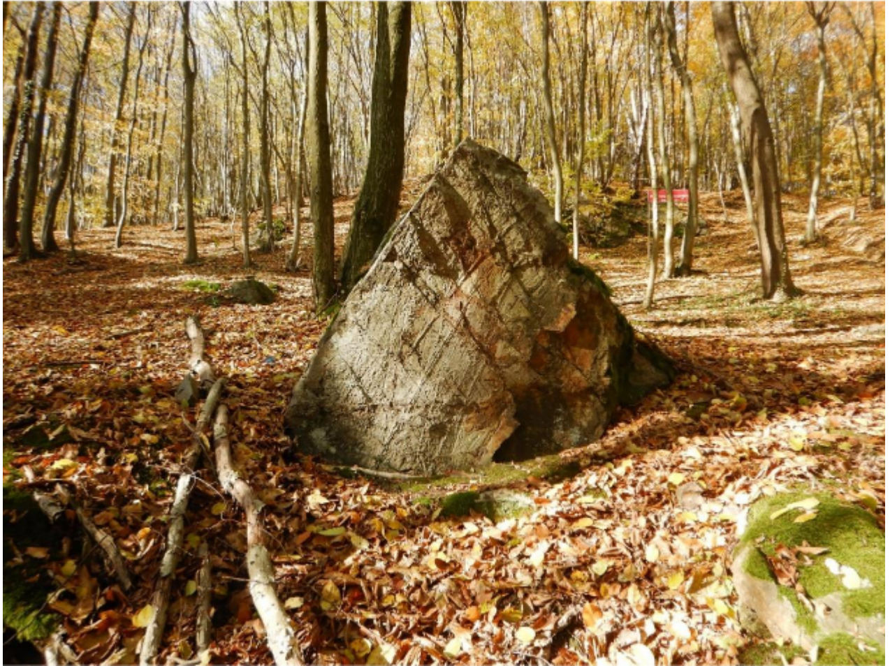
Fot. 2. Pomnik przyrody - blok skalny we wschodniej części (II) pomnika przyrody, od strony zachodniej, listopad 2025 r.