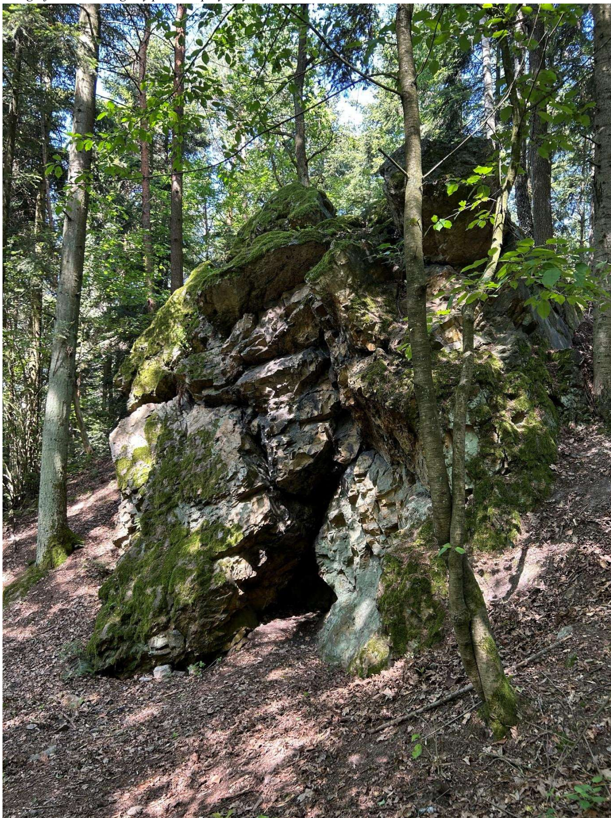
Fotografia 1. Widok ogólny pomnika przyrody „Urwisko skalne Piekło”.

Załącznik nr 1 do Uchwały Nr XXVIII/279/26 Rady Gminy Miedziana Góra z dnia 26 marca 2026 r.