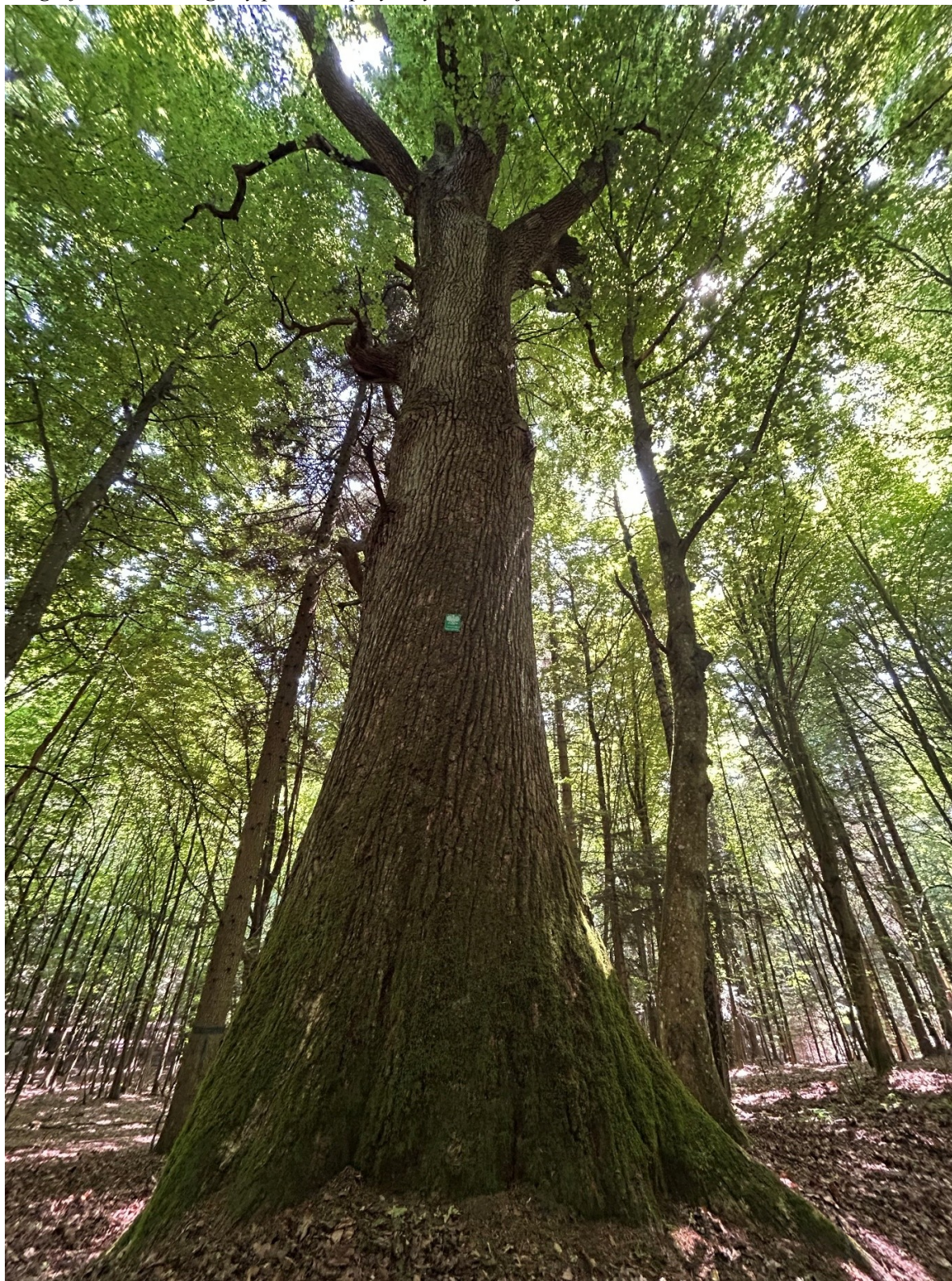
Fotografia 1. Widok ogólny pomnika przyrody „Radziej”.

Załącznik nr 2 do Uchwały Nr XXVIII/280/26 Rady Gminy Miedziana Góra z dnia 26 marca 2026 r.