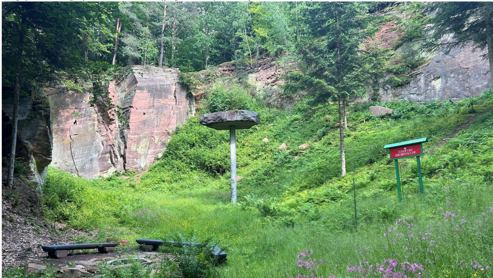
Fotografia 1. Widok ogólny stanowiska dokumentacyjnego „Odsłonięcie skalne piaskowców triasowych”.

Załącznik nr 1 do Uchwały Nr XXVIII/282/26 Rady Gminy Miedziana Góra z dnia 26 marca 2026 r.