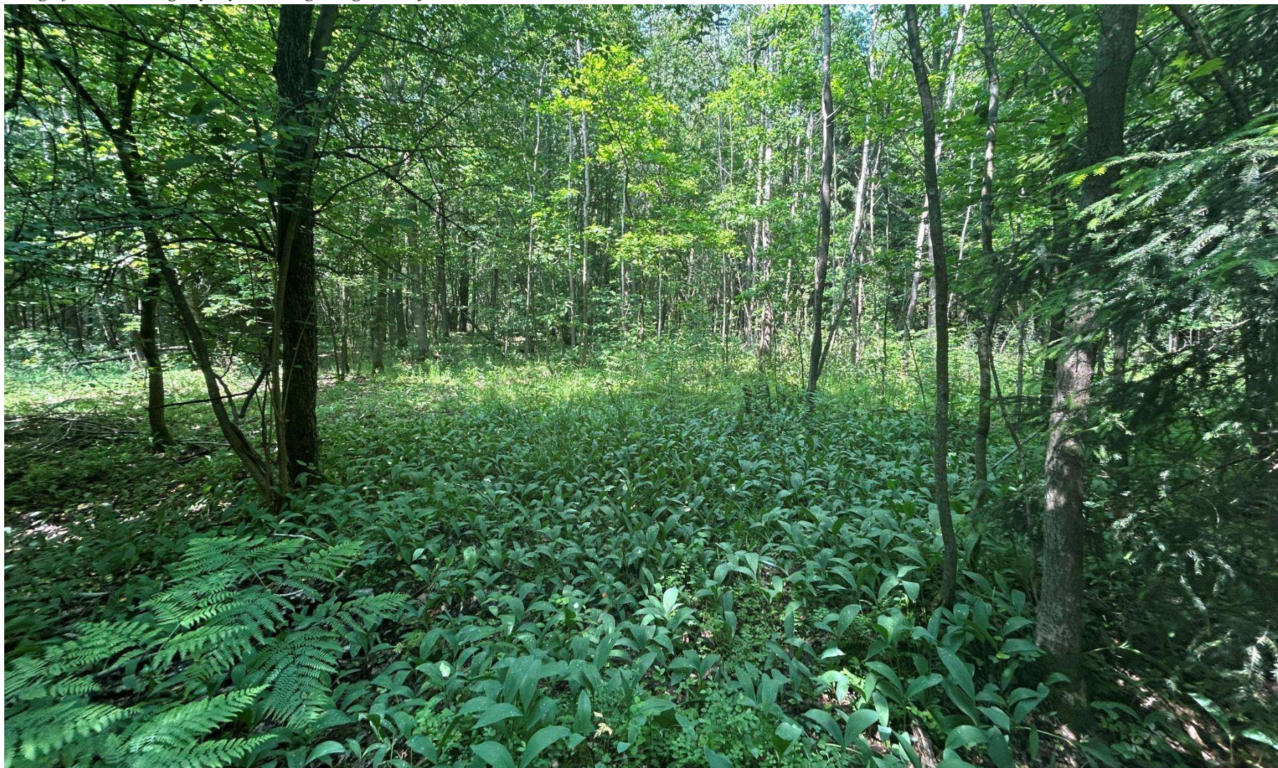
Fotografia 1. Widok ogólny użytku ekologicznego „Ostoja Horezińska”.

Załącznik nr 1 do Uchwały Nr XXVIII/283/26 Rady Gminy Miedziana Góra z dnia 26 marca 2026 r.