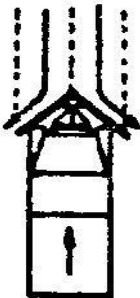
a - pługiem jednostronnym,