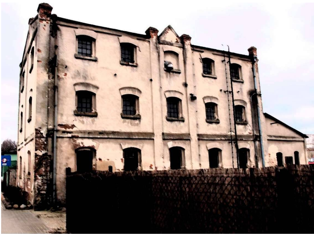
Fot. 2. Budynek dawnego młyna.

Budynek z cegły, otynkowany, zbudowany na planie prostokąta, ustawiony krótszym bokiem do ulicy Piłsudskiego. Obiekt posiada trzy kondygnacje, z dachem dwuspadowym krytym papą. Elewacje proste ze skromnymi zdobieniami w formie zaznaczonych- pogrubionych w tynku, gzymsów, nadproży okiennych, belek i pilastrów. Okna żeliwne, przeszklone - przemysłowe. Obecnie obiekt nieużytkowany, wymaga podjęcia prac konserwatorskich.