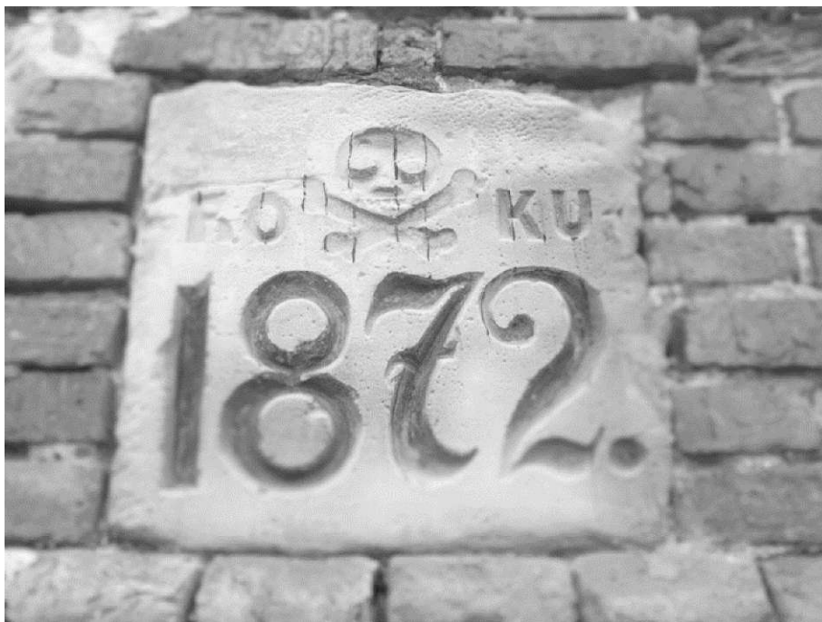
Fot. 3. Tablica z piaskowca wmurowana w ogrodzenie cmentarne - fragment grobu zbiorowego, wcześniej opisywanego (fot. i stylizacja: Ewa Kubska-Oleksy).