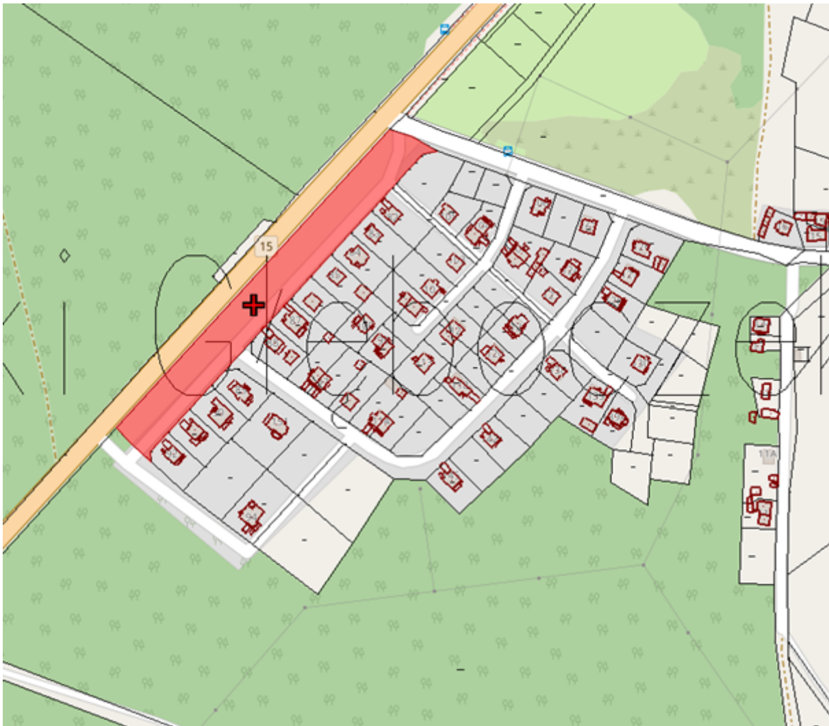
Droga wewnętrzna proponowana do zaliczenia do kategorii dróg gminnych w Gminie Brzozie