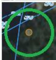
POMNIK PRZYRODY DĄB SZYPUŁKOWY DZ. EW. 3 OBR. 481