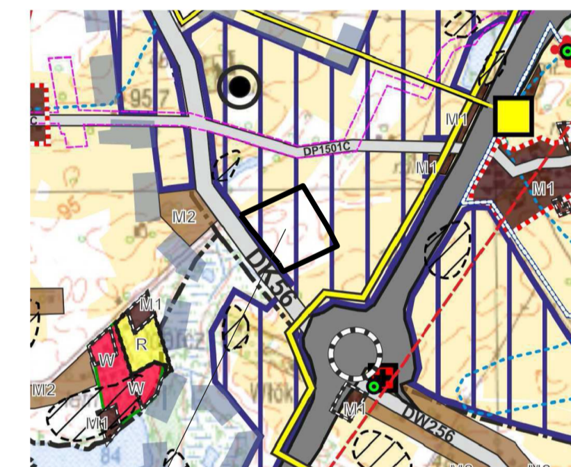
TEREN MIEJSCOWEGO PLANU ZAGOSPODAROWANIA PRZESTRZENNEGO