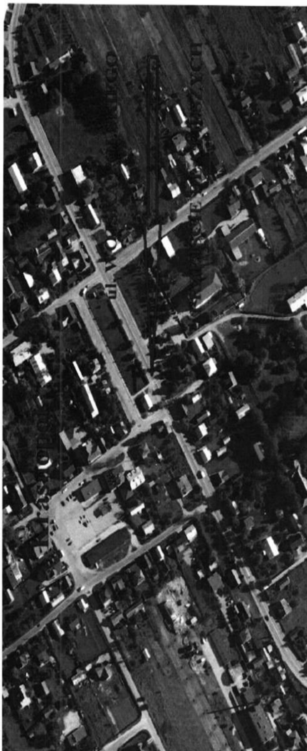
ZALĄCZNIK NR 1 LOKALIZACJA PRZEJŚCIA DLA PIESZYCH PRZEZNACZONEGO DO PRZEBUDOWY ZE WSKAZANIEM LOKALIZACJI OBIEKTÓW, KTÓRE W NATURALNY SPOSÓB GENERUJĄ ZWIĘKSZONY RUCH PIESZYCH NA PRZEDMIOTOWYM PRZEJŚCIU.