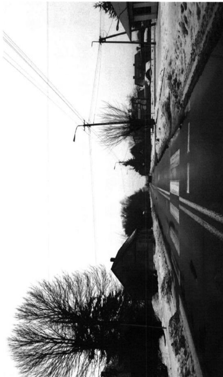
ZALĄCZNIK NR.2 WYDRUK ZDJĘĆ PRZEJŚCIA PRZEZNACZONEGO DO PRZEBUDOWY