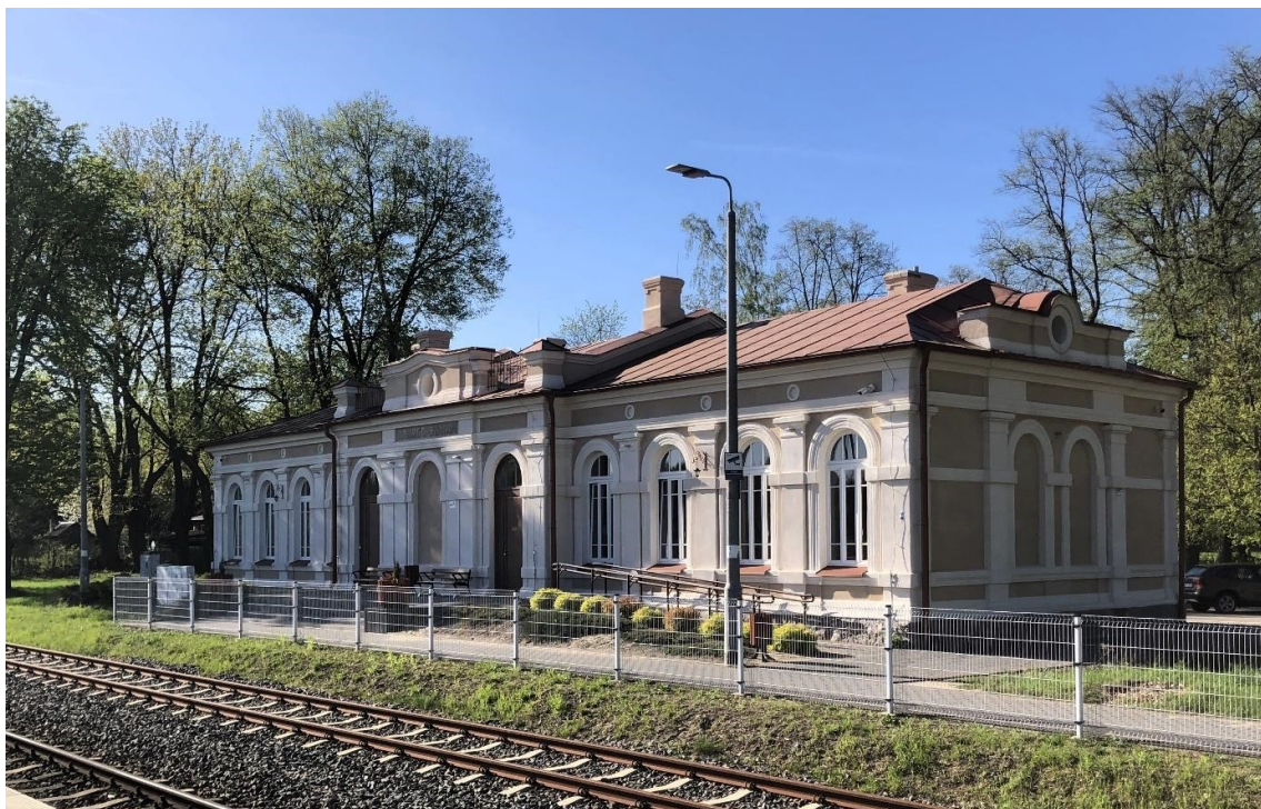
Nurzec-Stacja, budynek dworca kolejowego