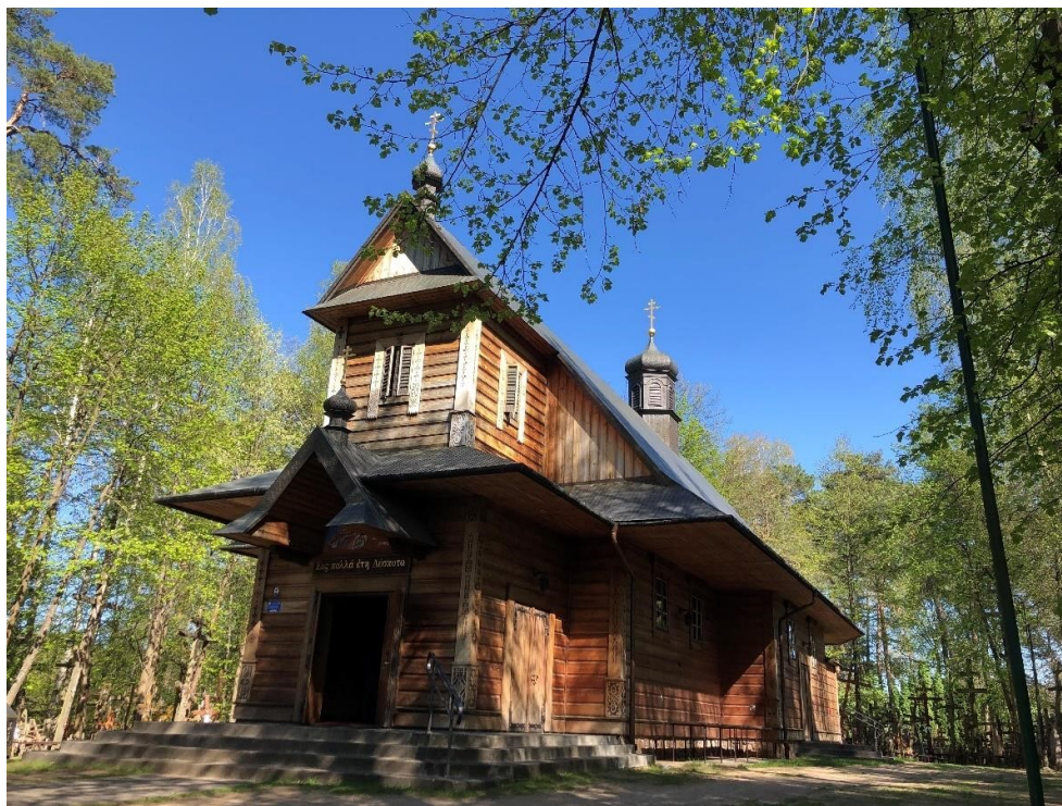
Grabarka, cerkiew pw. Przemienienia Pańskiego

Zespół usytuowany jest na zalesionym wzgórzu ok. 1 km na pd.-wsch. od wsi Grabarka. U podnóża góry znajduje się kapliczka nad źródłem. Wokół cerkwi ustawione są setki drewnianych krzyży wotywnych, przyniesionych przez pielgrzymów. Na pd. od cerkwi położona jest drewniana kaplica (tzw. cerkiew „trapezna”) pw. Ikony Matki Bożej „Radość Wszystkich Strapionych”, całkowicie przebudowana w 2015 r., będąca pierwotnie siedzibą żeńskiego zakonu św. Marty i Marii. Pomiędzy cerkiewiami stoi parterowy drewniany budynek (d. dom pielgrzyma), ob. mieszczący sklepik z pamiątkami. W wsch. części założenia zlokalizowany został cmentarz grzebalny, służący miejscowej ludności i zakonnicom, na którym zachowały się drewniane i kamienne krzyże z 2. poł. XIX i pocz. XX wieku. W części pd.-wsch. wzgórza usytuowane są współczesne murowane budynki: klasztor, plebania i dom gościnny. Święta Góra otoczona jest u podnóża kamiennym murem ukończonym w 2001 roku.