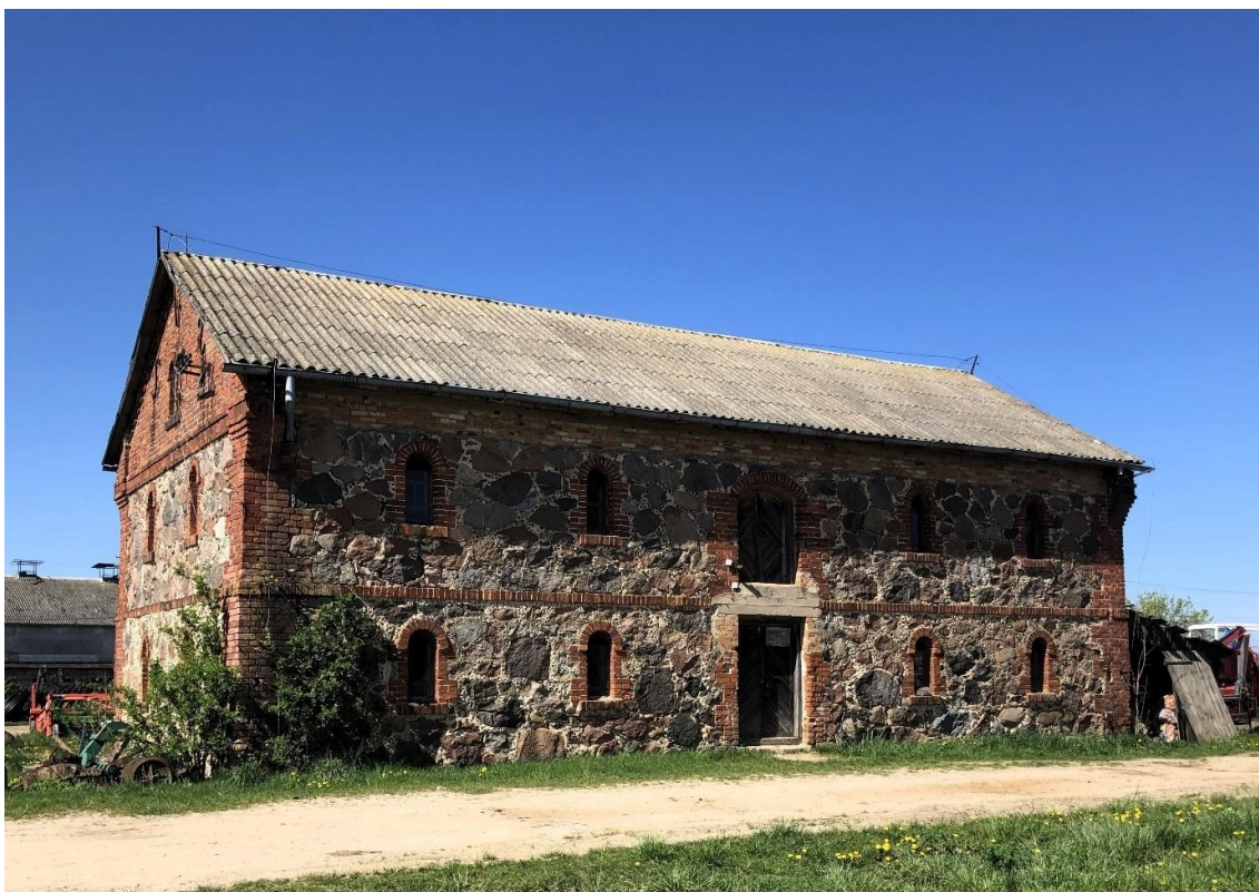
Klukowicze, murowany spichlerz w zespole dworsko-folwarczno-parkowym

Poza opisanym zespołem dworsko-folwarczno-parkowym w Klukowiczach, relikdami analogicznych założeń są parki dworskie w Nurczyku, Nurcu i Zabłociu. Ich stan jest jednak bardzo zły, pozostałościami po nich jest obecnie nieliczny starodrzew.