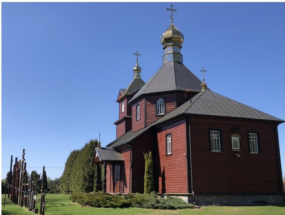
Telatycze, cerkiew pw. Świętych Kosmy i Damiana