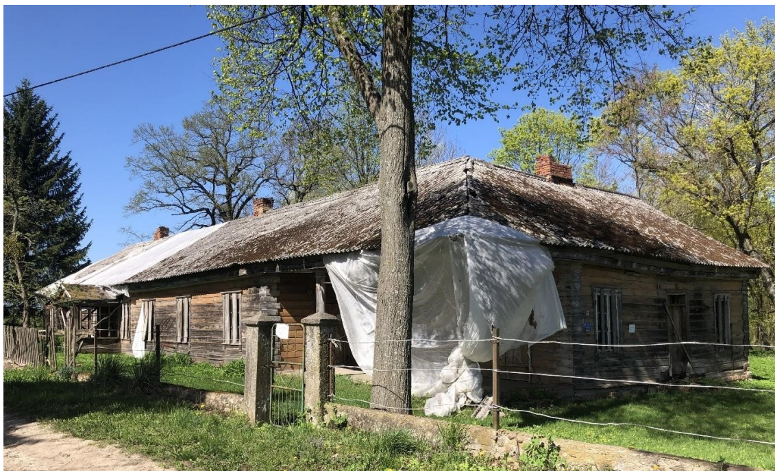
Klukowicze, drewniany dwór w zespole dworsko-folwarczno-parkowym