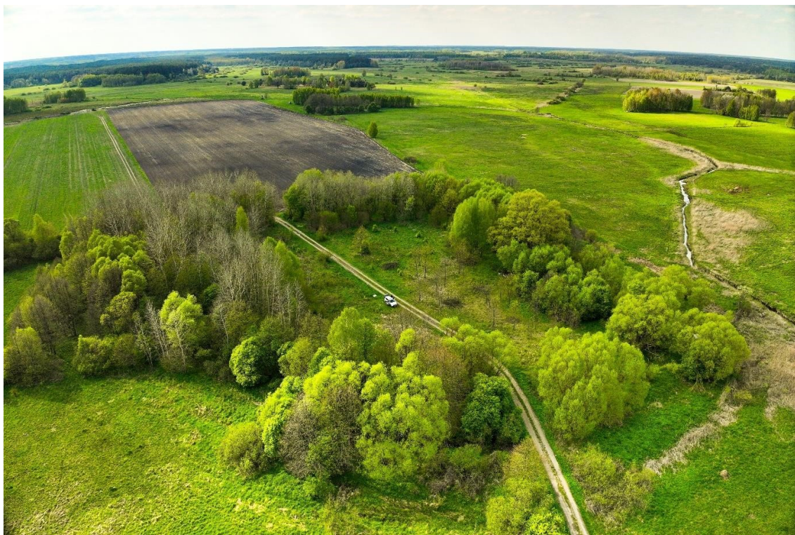
Grodzisko w Klukowiczach, st. 1