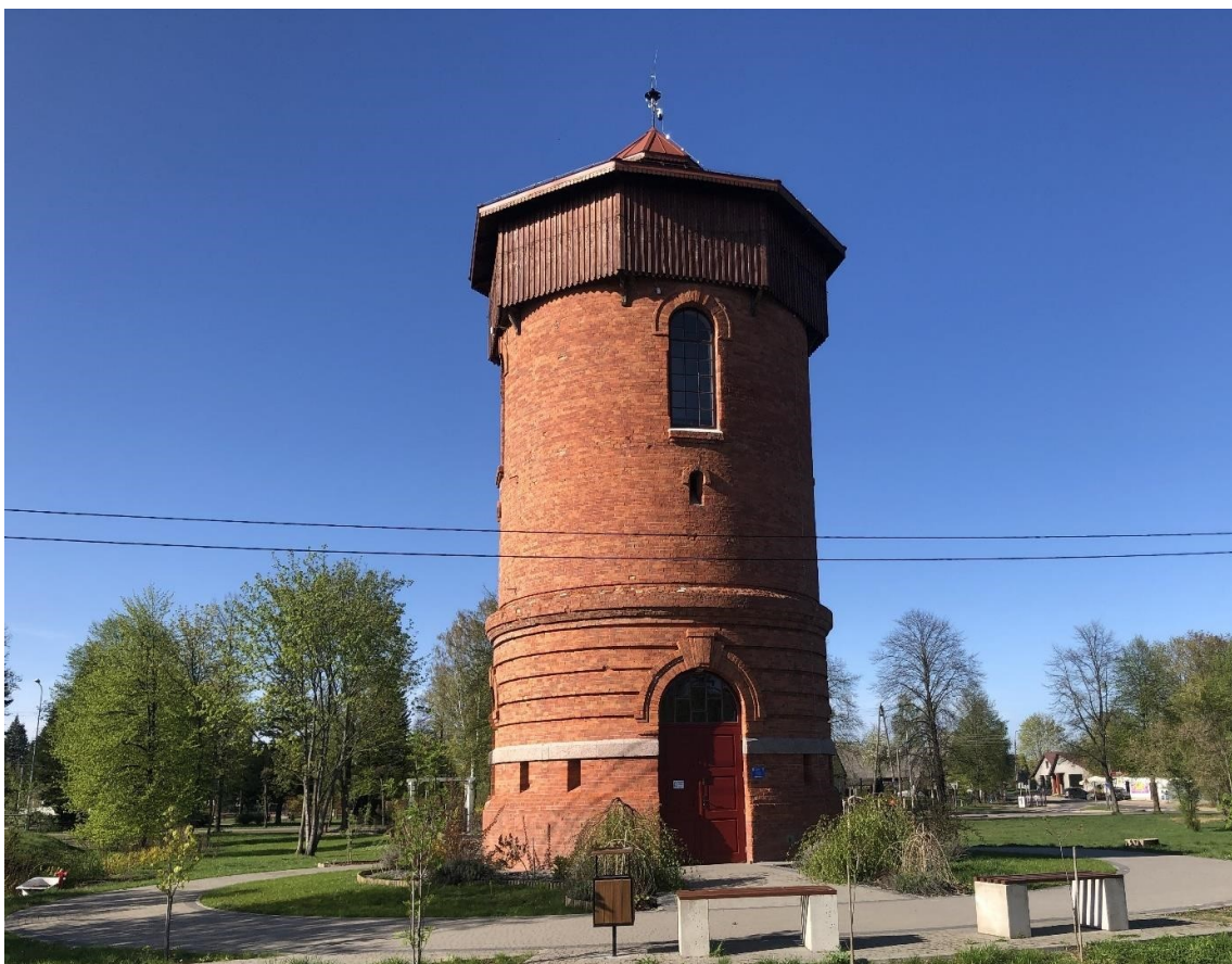
Nurzec-Stacja, kolejowa wieża ciśnień

Wieżę ciśnień zbudowano na początku XX wieku. Jest to budowla murowana z czerwonej cegły, na zaprawie. Budynek na planie koła z dolną partią boniowaną poziomymi pasami.