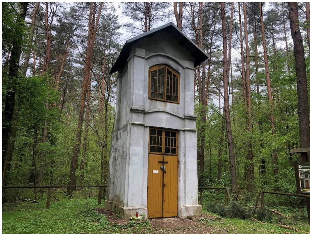
Telatycze (Anusin), kaplica pw. św. Andrzeja Boboli