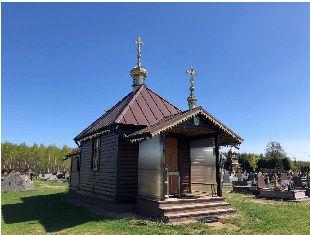
Telatycze, cerkiew cmentarna pw. Ścięcia Głowy św. Jana Chrzciciela