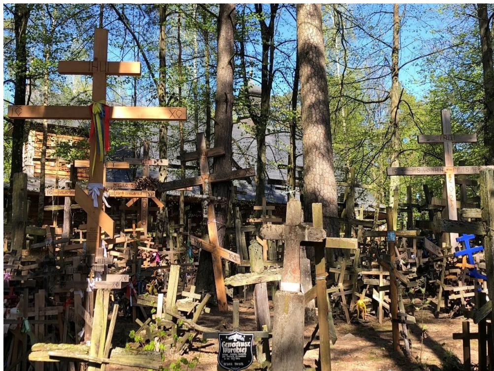
Grabarka, krzyże wokół cerkwi pozostawione przez pielgrzymów