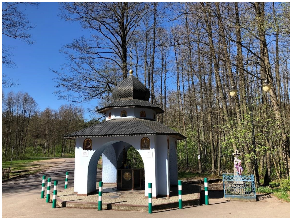
Grabarka, studnia-kapliczka u podnóża wzgórza klasztornego