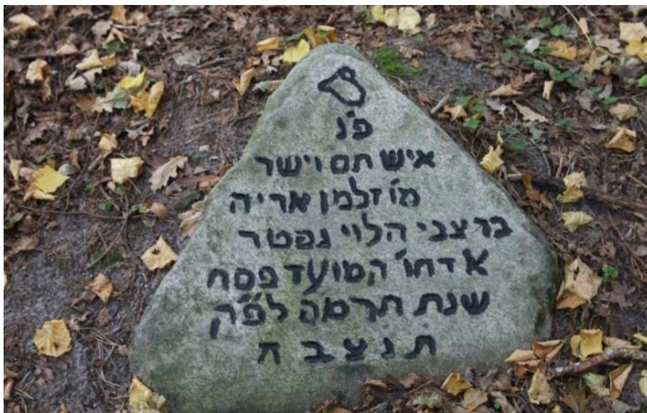
Macewa na knyszyńskim kirkucie.

W XVIII wieku w Knyszynie zaczęła działać gmina żydowska. W 1786 r. otrzymała ona zgodę na dokonywanie pochówków na groblach sadzawek królewskich. Pochówki na tym obszarze odbywały się już wcześniej. Cmentarz zajmuje 2,8 ha. Zlokalizowany jest po wschodniej stronie drogi będącej przedłużeniem ulicy Białostockiej w Knyszynie. Podzielony jest na dwie części: starą i nową. Nowa część powstała ok. 1930 r. Obok znajduje się zbiorowa mogiła, w której leżą zwłoki 74 zamordowanych 2 listopada 1942 r. mieszkańców Knyszyna wyznania mojżeszowego. Obecnie na terenie cmentarza znajduje się 700 zabytkowych macew. Teren porasta starodrzew.