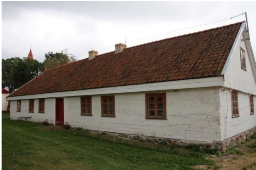
Dom przy ul. Kościelnej 6 w Knyszynie. Fot. Urząd Miejski w Knyszynie.2019

dawnych mieszkańcach. Od 1995 r. mieści się w nim Izba Regionalna. W 2011 r. obiekt zdobył I miejsce w konkursie organizowany przez Urząd Marszałkowski Województwa Podlaskiego na „Najlepiej zachowany zabytek budownictwa drewnianego w Województwie Podlaskim”.