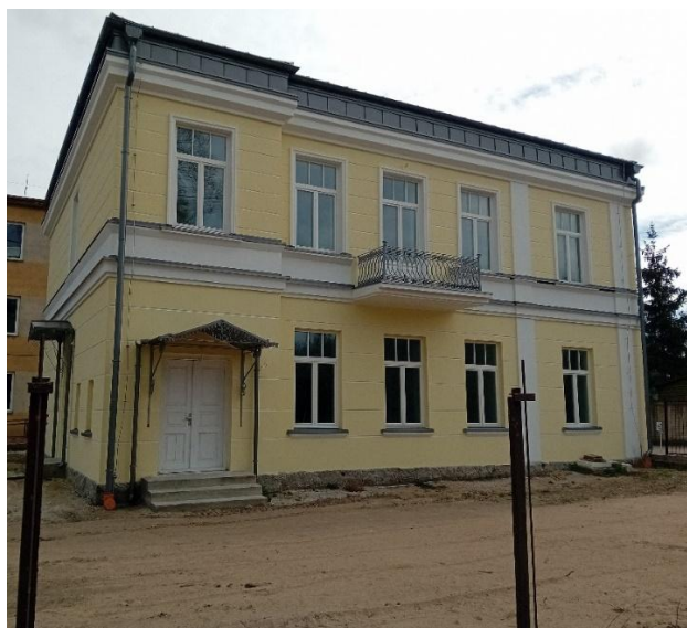
Budynek szpitalny w Knyszynie, fot. E. Rożko 2025

Budynek pierwotnie wykorzystywany, jako mieszkania dla lekarzy, później jako przychodnia. Wzniesiony około 1910 r., murowany z cegły, tynkowany. Budowla dwukondygnacyjna na planie litery T. Budynek po byłej przychodni, za zgodą Podlaskiego Wojewódzkiego Konserwatora Zabytków w Białymstoku został w 2019 r. sprzedany w drodze przetargu nieograniczonego. Obecny właściciel prowadzi tam prace rewitalizacyjne z zachowaniem zaleceń Konserwatora Zabytków.