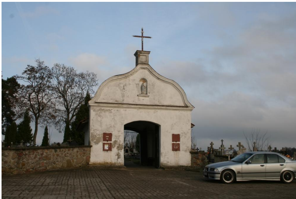
Wejście główne na cmentarz parafialny w Kalinówce Kościelnej. Fot. M. Andron 2019.

Cmentarz założony w początku XIX wieku. Najstarszy zachowany do dziś nagrobek pochodzi z 1848 r. Najstarsze pochówki koncentrują się na wyniesieniu, na osi głównej alei. Cmentarz założony na planie prostokąta, układ grobów w przybliżeniu rzędowy wzdłuż linii północ-południe. Współcześnie cmentarz powiększony w kierunku wschodnim.