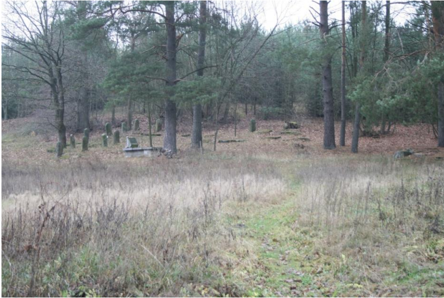
Nowa część cmentarza