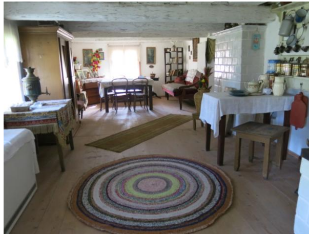
Wnętrze Izby Regionalnej Knyszynie

współpracy z Urzędem Miejskim w Knyszynie, Knyszyńskim Ośrodkiem Kultury i proboszczem parafii. Gromadzone są tu eksponaty historyczne (dokumenty, fotografie, monety), etnograficzne (maszyny rolnicze, tkaniny). Z informacji zamieszczonej na stronie Knyszyńskiego Ośrodka Kultury wynika, że w Izbie znajdują się zabytki przekazane przez parafię w Knyszynie.