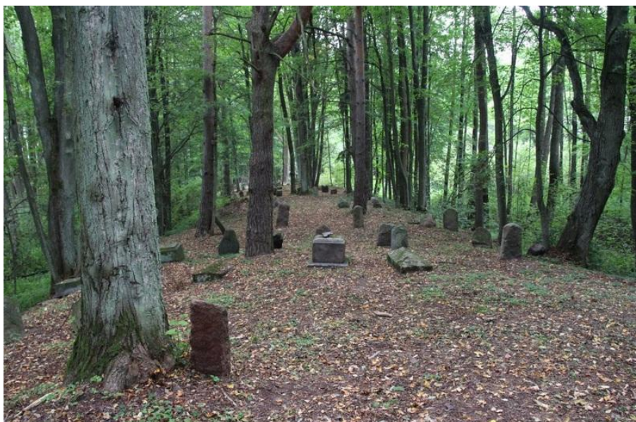
Cmentarz żydowski w Knyszynie. Fot. Urząd Miejski w Knyszynie, 2018