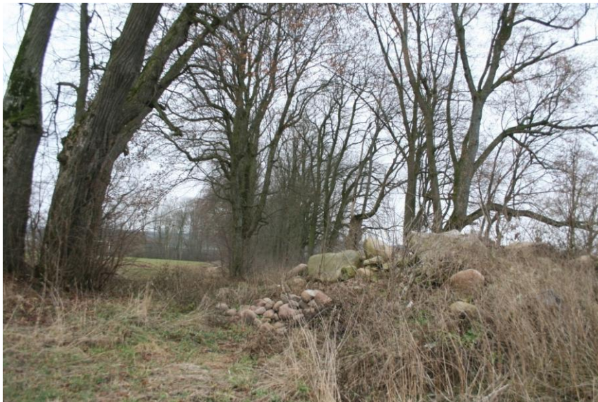
Knyszyn- Zamek. Fragment pozostałości parku dworskiego.

Założenie parkowe powstało w XVI wieku, w połowie XVIII wieku przekomponowane w stylu barokowym. Obecnie założenie parkowe zachowane jest szczątkowo.