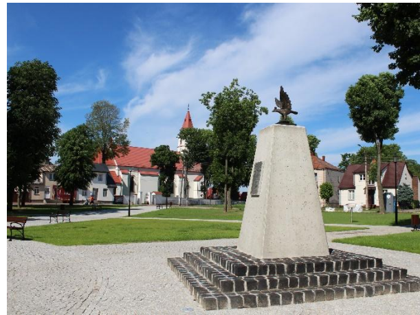
Centrum miasta Knyszyn po rewitalizacji. Fot. Urząd Miejski w Knyszynie.2020