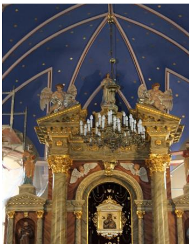
Fragment wnętrza kościoła.

W trakcie przeprowadzanych w 2020 roku prac remontowo-malarskich, odkryta została pierwotna malatura ścian, pochodząca najprawdopodobniej z okresu pomiędzy 1905 a 1910 r., Okazało się, że ściany były bogato dekorowane w przedstawienia ornamentalne i figuralne, w charakterystycznym stylu secesji krakowskiej z początku XX w. Na ścianach bocznych znajdowały się przedstawienia św. Stanisława, biskupa krakowskiego, patrona Polski z jednej strony, a z drugiej św. Kazimierza Jagiellończyka, patrona Litwy. Sklepienie pokrywało przedstawienie nocnego, gwiazdzistego nieba. W taki sposób zostało to zrekonstruowane.