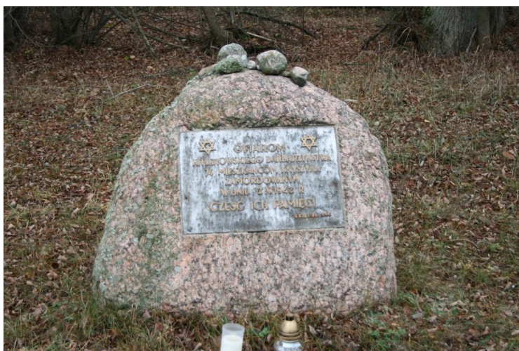
Głaz z tablicą pamiątkową na cmentarzu żydowskim.