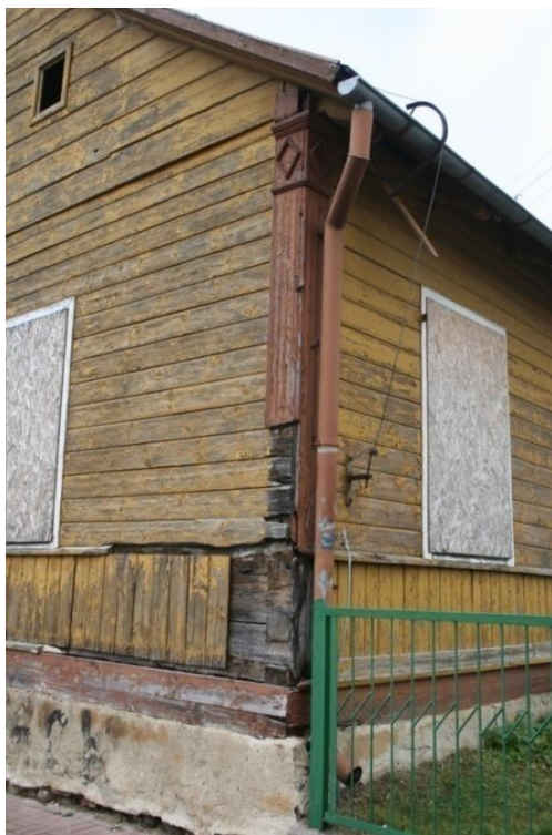
Knyszyn ul. Białostocka 38. Fot. M. Andron 2020