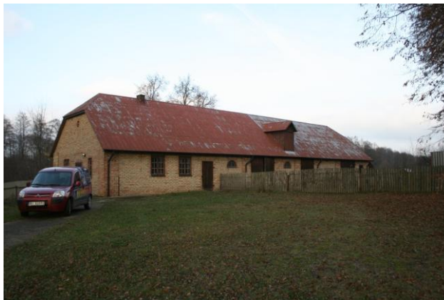
Budynek inwentarsko-gospodarczy. Fot. M. Andron 2019 r.

Zbudowany w pocz. XIX wieku, jako drewniano- murowany. Rozebrany i zrekonstruowany w 1998 r. jako murowany, nietynkowany.