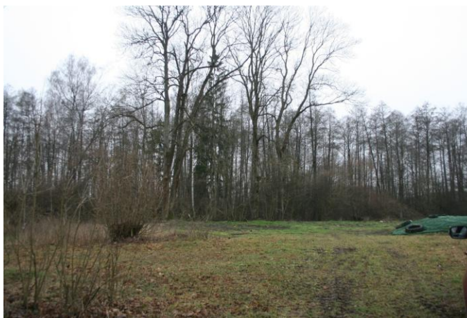
Fragment dawnego założenia, fot. M. Andron 2020

Założenie dworsko-ogrodowe powstałe w XVI wieku, do poł. XIX wieku wchodziło w skład dóbr jasionowskich. Po ich rozpadzie; zniszczone w 1914 r., zrekonstruowane w latach 20 - tych XX wieku. Obecnie park dworski zachowany jest szczątkowo. Obiekt zaniedbany.