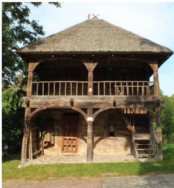
Lamus w Kalinówce Kościelnej.

Obiekt wzniesiony w 1782 r. Zbudowany na planie czworokątnym, dwukondygnacyjny, drewniany. Ściany konstrukcji zrębowej i sumikowo- łątkowej, zwęglowane na jaskółczy ogon. Narożniki szalowane. Cechą charakterystyczną jest dwukondygnacyjny podcień słupowy. Słupy podcieniowe wzmocnione łukowatymi zastrzałami. Górna kondygnacja podcienia zabezpieczona balustradą. Dach czterospadowy, pokryty trzcina.