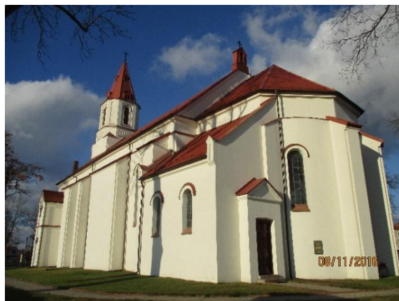
Kościół parafialny w Knyszynie.

W 2020 r. Parafia rzymskokatolicka w Knyszynie obchodziła 500 lecie istnienia i z tej okazji wydano monografię parafii „Parafia Knyszyn 1520- 2020. Odkrywanie dziejów” pod red. ks. A. Szota.