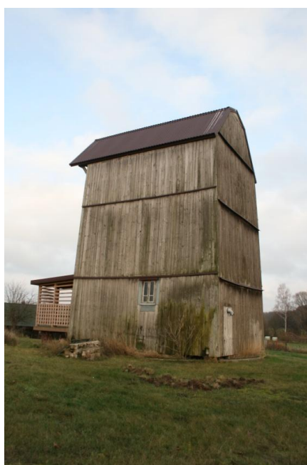
Wiatrak. Widok z drogi do wsi. Fot. M. Andron 2019

Został zbudowany w 1924 r. w konstrukcji szkieletowej, ściany odeskowane pionowo, dach dwuspadowy pokryty blachą ocynkowaną, w dobrym stanie techniczny. Jest ważnym zabytkiem techniki w gminie.