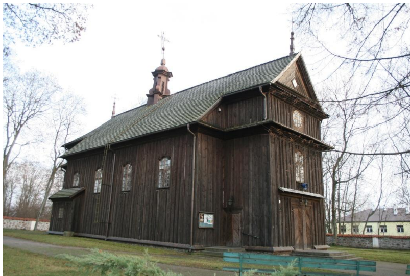
Kościół p.w. św. Anny w Kalinówce Kościelnej.

głównym dach dwuspadowy pokryty gontem; nad przybudówkami dachy pulpitowe także pokryte gontem.