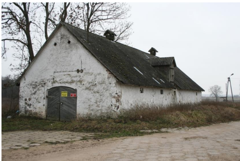
Ogrodniki, budynek gospodarczy, fot. M. Andron. 2019

Założenie parkowe powstałe około połowy XIX wieku zachowało się szczątkowo. Po przejęciu majątku przez PGR w 1949 r. nastąpiło częściowe przekształcenie założenia (układu przestrzennego) oraz dewastacja drzewostanu.