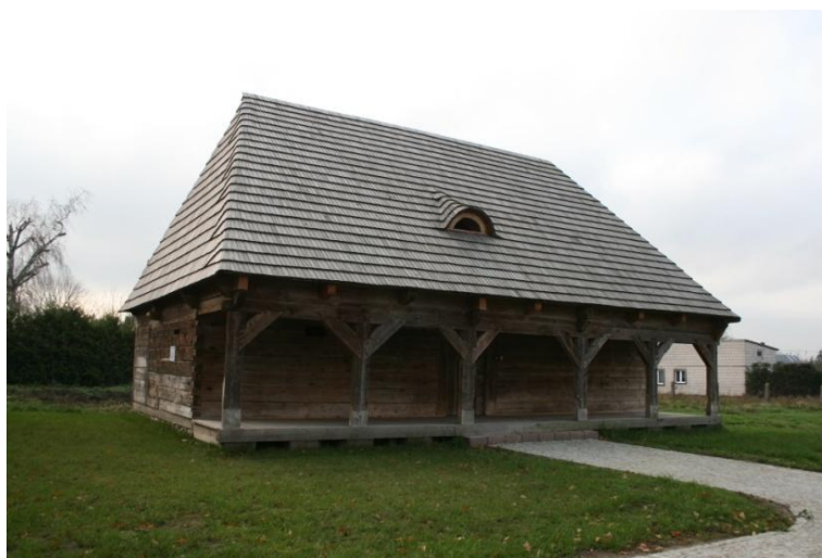
Lamus w Knyszynie.

Lamus wzniesiony w początku XIX wieku. W latach 2017-2018 przeprowadzono kapitalny remont. W trakcie prac zmieniono lokalizację obiektu, sytuując go bliżej ul. Kościelnej. Zbudowany został na planie prostokąta, drewniany; ściany w konstrukcji zrębowej i sumikowo-łatkowej, zwęglowane na jaskółczy ogon. W elewacji frontowej podcień słupowy. Słupy podcieniowe (6 sztuk) wzmocnione łukowatymi zastrzałami. Dach czterospadowy pokryty gontem. Koszt remontu ok. 305 tys. Zarząd Województwa dofinansował prace kwotą wysokości 199,9 tys. zł. Gmina Knyszyn przekazała na prace elektryczne 3600 zł. W 2020 r. lamus plebański w Knyszynie został laureatem w konkursie organizowanym przez Narodowy Instytut Dziedzictwa „Zabytek Zadbane” w kategorii architektura i budownictwo drewniane.