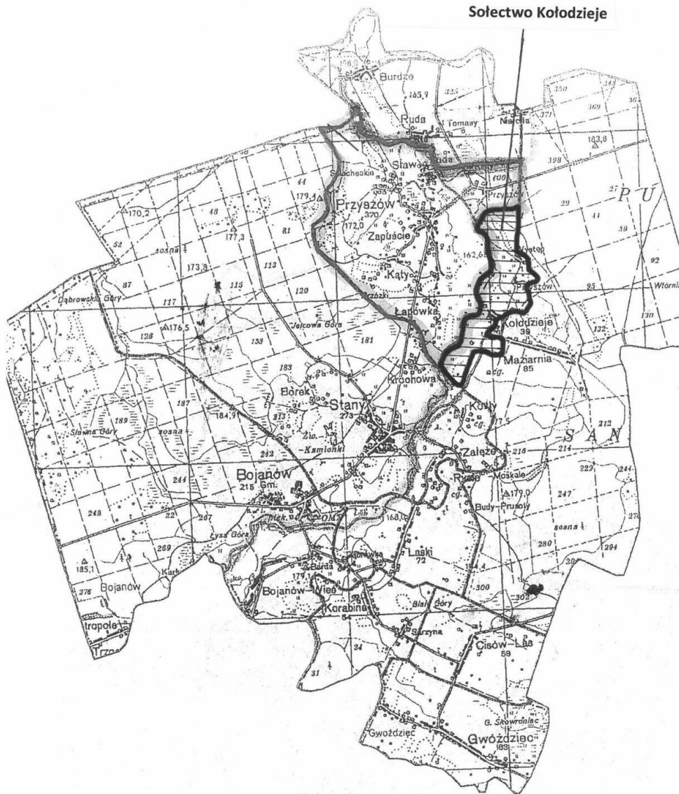
Załącznik graficzny dla statutu sołectwa Kołodzieje