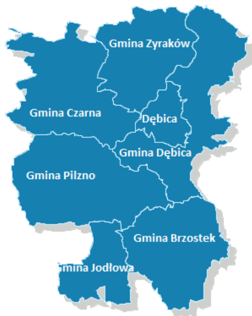
Położenie Gminy Brzostek na tle powiatu dębickiego

Gmina Brzostek położona jest w zachodniej części województwa podkarpackiego i terytorialnie przynależy do powiatu dębickiego. Leży na pograniczu Pogórza Ciężkowickiego i Strzyżowsko – Dynowskiego, wchodzącego w skład Pogórza Karpackiego. Graniczy z gminami: Jodłowa, Pilzno, Dębica, Brzyska, Kołaczyce, Frysztak, Wielopole Skrzyńskie i Ropczyce. Położona jest w odległości ok. 27 km od Dębicy - siedziby powiatu i 75 km od Rzeszowa – siedziby województwa.