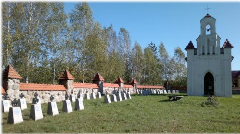
Cmentarz wojenny nr 220 oraz kaplica p.w. Św. Leonarda w Kleciach

Spośród cmentarzy wpisanych do rejestru zabytków najlepiej zachowany jest cmentarz wojenny nr 220 w Kleciach (z zachowaną na jego terenie kaplicą p.w. Św. Leonarda). Pozostałe zabytkowe nekropolie to cmentarz nr 217 w Januszkowicach, cmentarz nr 218 w Bukowej oraz cmentarz nr 227 w Gorzejowej, Brzostku nr 222 i Zawadce Brzosteckiej nr 226 Cmentarz niewpisane do rejestru znajdują się także w Przeczycy.