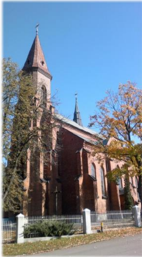
Sanktuarium NMP Wniebowziętej w Przemyślu