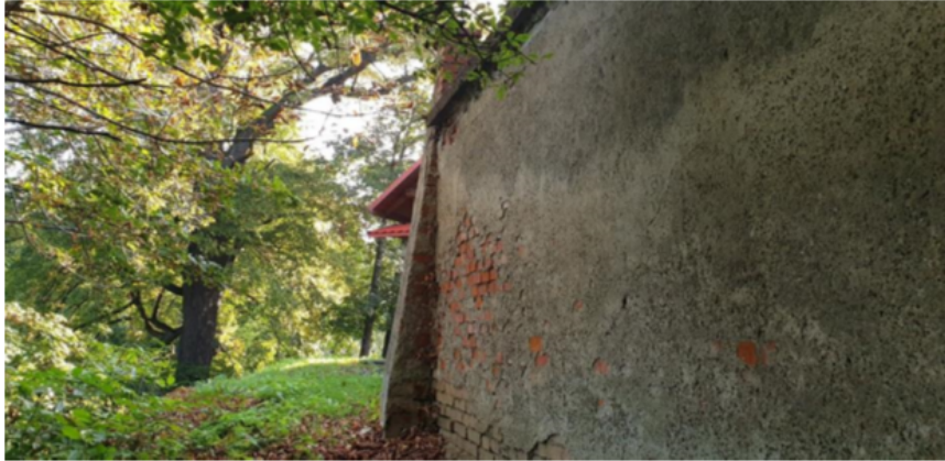
Zdjęcie 5 Pozostałości fortyfikacji przy kościele w Hyżnem

Ziemne z XV – XVII w., z fragmentem ogrodzenia murowanego zachowane po stronie północnej.