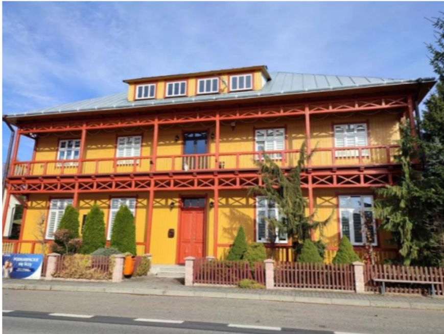
Zdjęcie 10 Budynek dawnego urzędu gminy w Hyżnem (obecnie budynek GOK w Hyżnem)

wschodniej dwutraktowy, w części zachodniej dwu- i półtraktowy. Sień wzdłuż całej szerokości budynku, z sieni drewniane schody na piętro. To jedyny tego typu zabytek w dawnym woj. rzeszowskim.