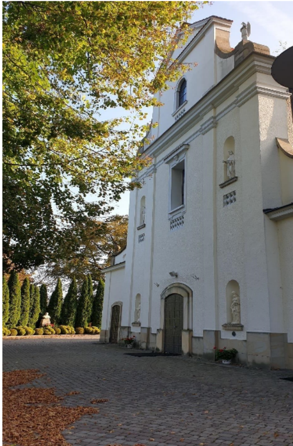
Zdjęcie 3 Kościół parafialny p.w. Narodzenia NMP w Hyżnem

Jest to przykład późnobarokowej architektury sakralnej. Sanktuarium wyposażone jest w cenne renesansowe i barokowe elementy wystroju wnętrza.