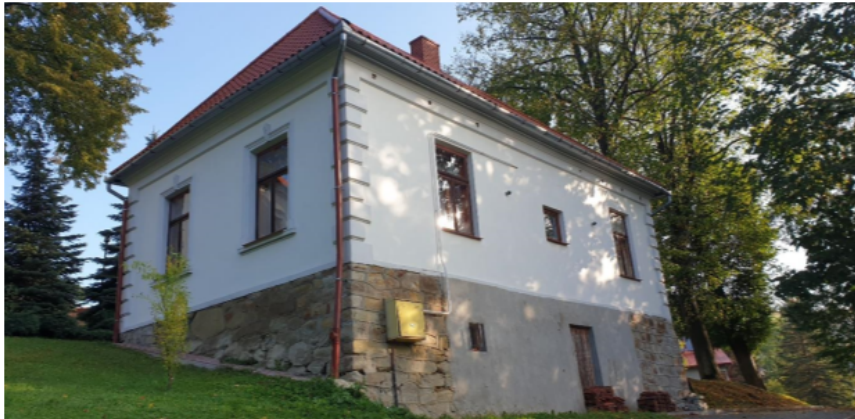
Zdjęcie 6 Wikarówka przy kościele w Hyżnem