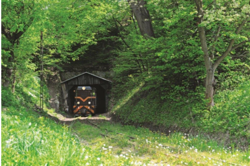
Zdjęcie 2 Tunel kolejki wąskotorowej w Szklarach

Wólka Hyżneńska - Najmłodsza wieś gminy Hyżne. Powstała w roku 1973 po połączeniu w całość kilku przysiółków wsi Hyżne i Dylągówka (Dział, Kąty, Majerowskie, Poklasne, Zapady i Żabnik) oraz ciągu zabudowań wzdłuż drogi łańcuckiej, które wznoszone były po parcelacjach z 2 poł. XIX wieku. Do roku 1975 wieś należała do parafii p.w. Narodzenia NMP w Hyżnem. W 1975 r. została konsekrowana parafia p.w. Matki Bożej Bolesnej w Grzegorzówce i w Wólce Hyżneńskiej.