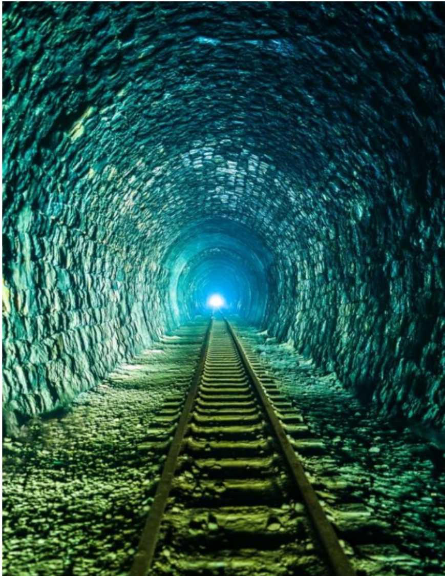
Zdjęcie 11 Tunel w Szklarach