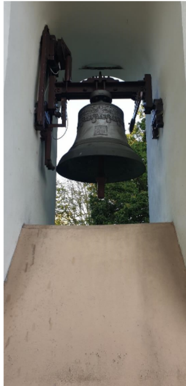
Zdjęcie 6 Zabytkowy dzwon „Jan”