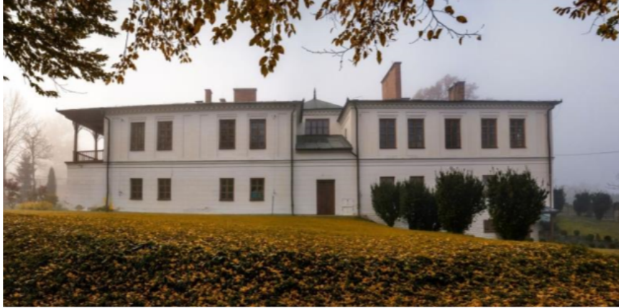
Zdjęcie 8 „Dworek Sikorskiego” w Hyżnem (obecnie przedszkole)