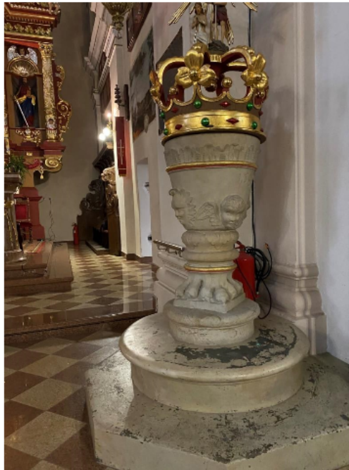
Zdjęcie 1 Chrzcielnica z 1592 r., znajdująca się w kościele pod wezwaniem Najświętszej Maryi Panny w Hyżnem

W ww. Programie możemy znaleźć informację o zabytkowej chrzcielnicy z 1592 r., a także o obrazie Łaskawej Matki Bożej Hyżnieńskiej znajdujących się w Sanktuarium Matki Bożej Hyżnieńskiej.