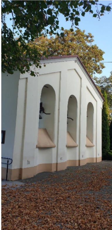
Zdjęcie 5 Dzwonnica przy kościele w Hyżnem

Tynkowana, na cokole z nieregularnego kamienia łamanego trójjarkadowa z dzwonem „Jan” z 1649 r., zamknięta dwuspadowym daszkiem.