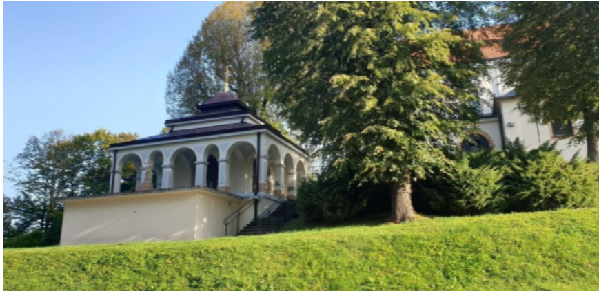
Zdjęcie 4 Kaplica pielgrzymia w Hyżnem

Wzniesiona ok. 1934 r. usytuowana południowej stronie kościoła, murowana, otynkowana, parterowa, zamknięta dachami namiotowymi, łamanymi z kopułowym zwieńczeniem. W elewacji wschodniej, zachodniej i południowej znajdują się otwarte loggie arkadowe przykryte sklepieniem kolebkowo – krzyżowym. Wnętrze jednoprzestrzenne sklepienie krzyżowo.