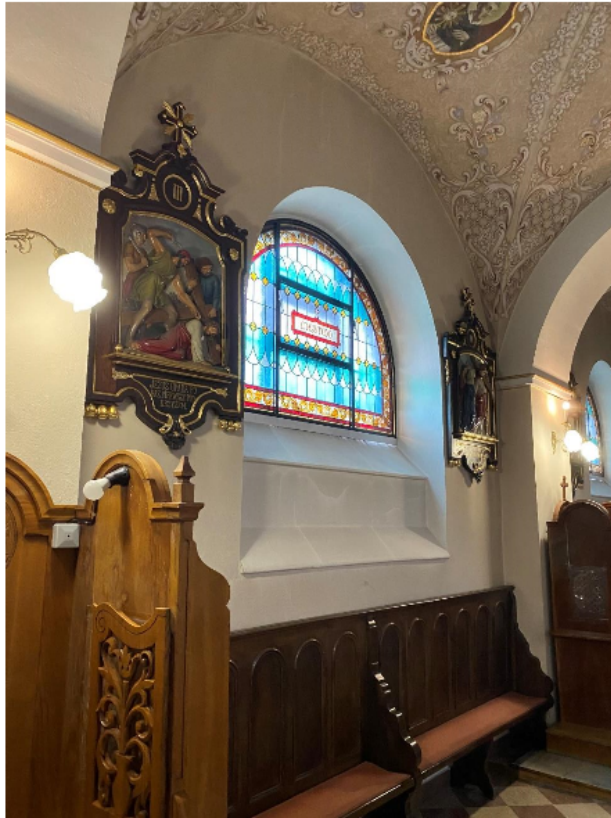
Zdjęcie 12 Stacje drogi krzyżowej jako wyposażenie kościoła p.w. Narodzenia NMP w Hyżnem

Stacje drogi krzyżowej (14 sztuk), neobarokowe z 1919 r., terrakota (prawdopodobnie masa stiukowa) polichromowana w ramie drewnianej, politurowanej, pozłacanej o wymiarach około 150x90 cm w świetle ramy 70x58 cm. Reliefy wypukłe zamknięte łukiem odcinkowym o wykrojonych łukami wklęsłymi narożnikach scenami Męki Pańskiej. Kompozycje wielopostaciowe o statycznych układach. Postacie w klasycznych proporcjach, antycznych strojach. Fałdy szat leżące się, miękkie. Idealizowane rysy twarzy. Polichromia barwna o lokalnej tonacji z zastosowaniem