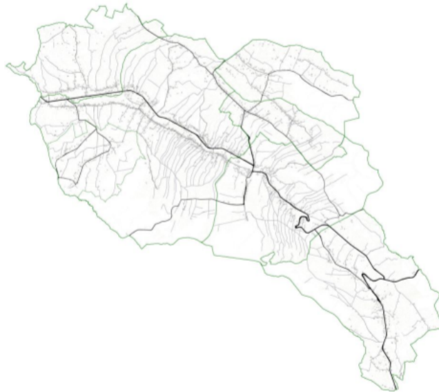
Rysunek 1 Obszar Gminy Hyżne.