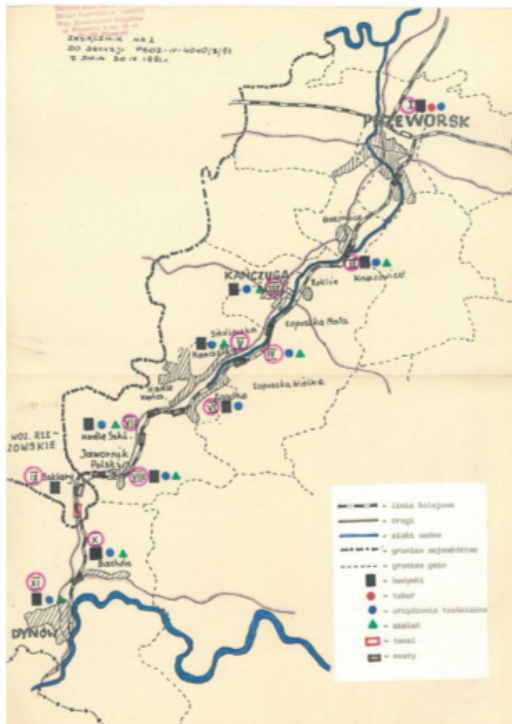
Rysunek 3 Załącznik graficzny do decyzji o wpisie „kolejki” do rejestru zabytków (źródło: decyzja z dnia 30.09.1991 r. o wpisie do rejestru zabytków)

wartość historyczną. Trasa kolei ma ponadto walory turystyczno – krajobrazowe. Szczególną atrakcją jest kamienny tunel o długości 602 m zlokalizowany w miejscowości Szklary, gm. Hyżne – jeden z najdłuższych tuneli kolejki wąskotorowej w Europie. Tunel cechuje się sklepieniem półokrągłym o splywach zwężających się ku dołowi, obudowa ścian z ciosów piaskowca, w środku tory, po obu ich stronach przykryte kanały wodne, wjazdy do tunelu zamykane bramami płycinowymi w obudowie drewnianej zwieńczonej trójkątnym tympanonem, listwy szczytu zakończone ząbkami.