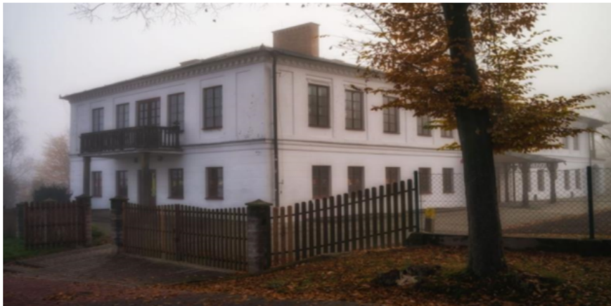
Zdjęcie 9 Widok na Zespół dworski od strony parkingu przy SP w Hyżnem