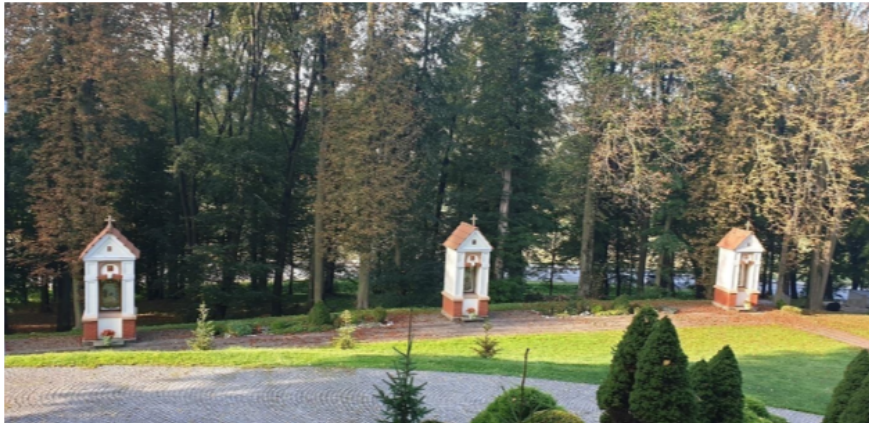
Zdjęcie 7 Część kapliczek Bolesci Matki Bożej położonych na wzgórzu kościelnym w Hyżnem