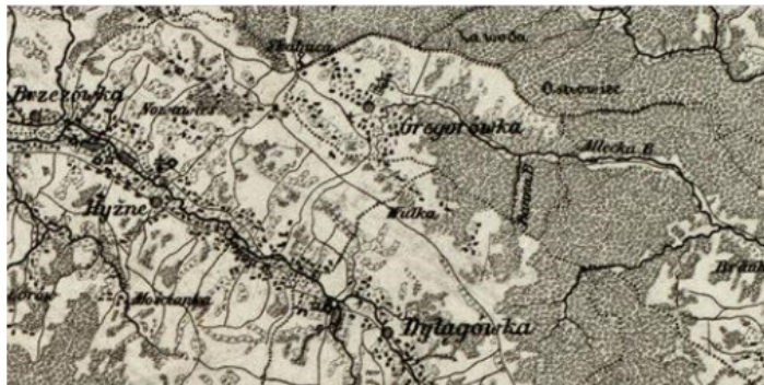
Rysunek 2 Hyżne, austriacka mapa Galicji Wschodniej z roku 1855 (źródło: http://igrek.amzp.pl/details.php?id=11769035 )