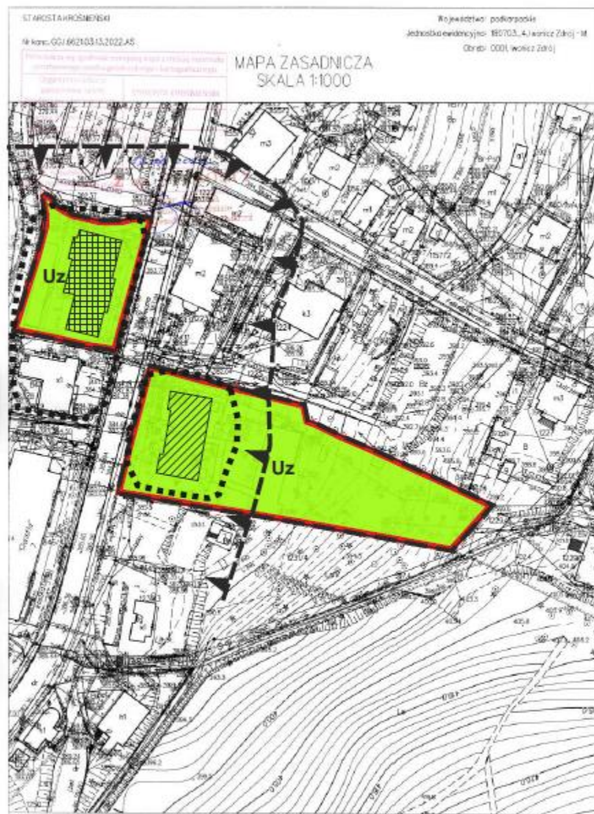
UKŁAD WSPÓLRZĘDNYCH MAPY PL-2000 str 7