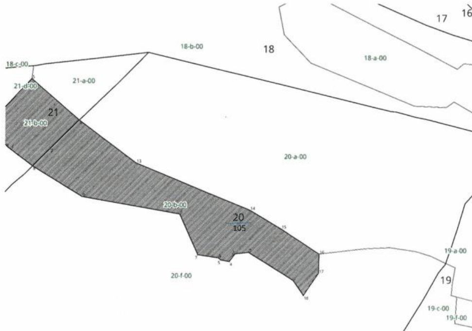
Tab. 2 Wykaz współrzędnych punktów numerycznego opisu granic użytków ekologicznych w układzie PUWG 1992

Nadl: Cisna Obr. leśny: Wetlina Leśnictwo: Jaworzec