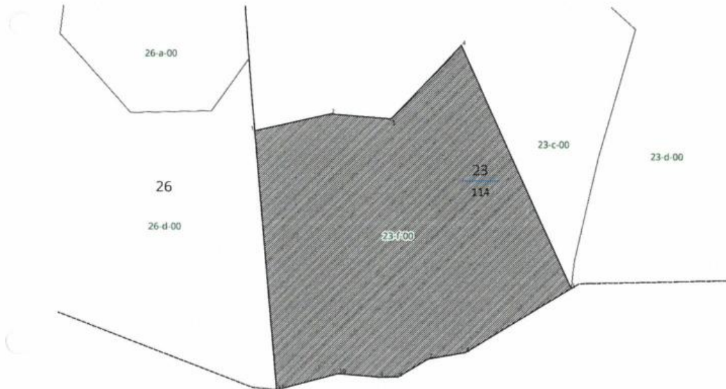
Tab. 2 Wykaz współrzędnych punktów numerycznego opisu granic użytków ekologicznych w układzie PUWG 1992

Nadl: Cisna Obr. leśny: Wetlina Leśnictwo: Jaworzec