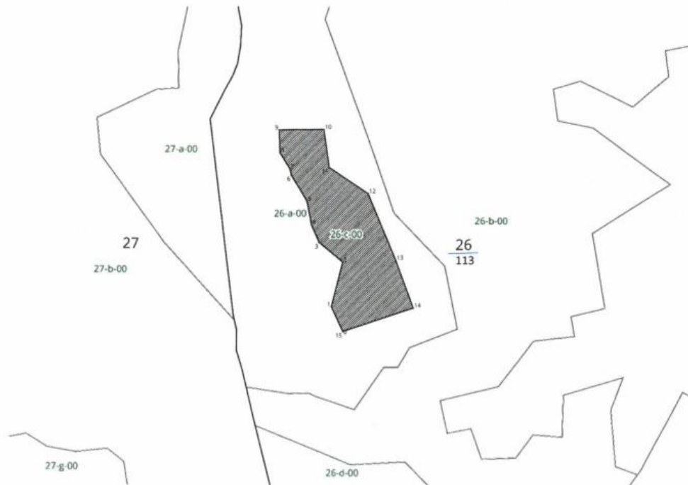
Tab. 2 Wykaz współrzędnych punktów numerycznego opisu granic użytków ekologicznych w układzie PUWG 1992

Nadl: Cisna Obr. leśny: Wetlina Leśnictwo: Jaworzec