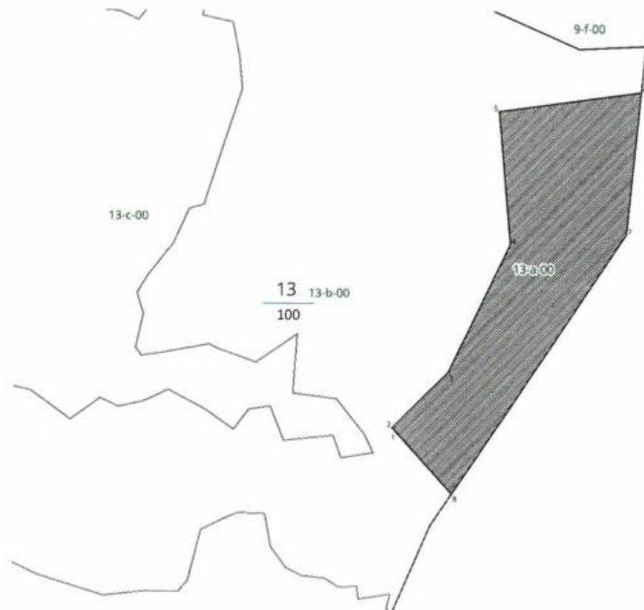
Tab. 2 Wykaz współrzędnych punktów numerycznego opisu granic użytków ekologicznych w układzie PUWG 1992

Nadl: Cisna Obr. leśny: Wetlina Leśnictwo: Jaworzec