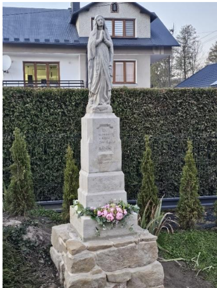
Figura przydrożna Matki Bożej Różańcowej – wpisana do rejestru zabytków pod numerem rejestru B-1062