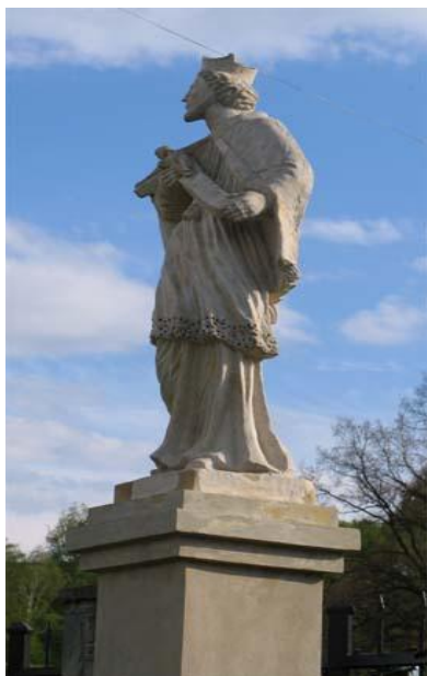
Figura św. Jana Nepomucena w Pstrągowej – wpisana do rejestru zabytków pod poz. B-58 z dnia 24.04.2002 r. Stoi na placu obok kościoła parafialnego. Położona jest na terenie pierwotnego założenia kościelnego.

Usytuowana jest w południowo-zachodnim narożniku placu kościelnego, obok nowszego krzyża misyjnego. Jest to późnobarokowa, kamienna rzeźba pochodząca z XVIII wieku. Obecnie umieszczona jest na nowym cokole wykonanym z cegły i pomalowanym na kolor bordo. Postać św. Jana Nepomucena jest przemalowana.