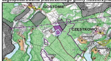
Wyrys ze studium uwarunkowań i kierunków zagospodarowania przestrzennego gminy Kościerzyna