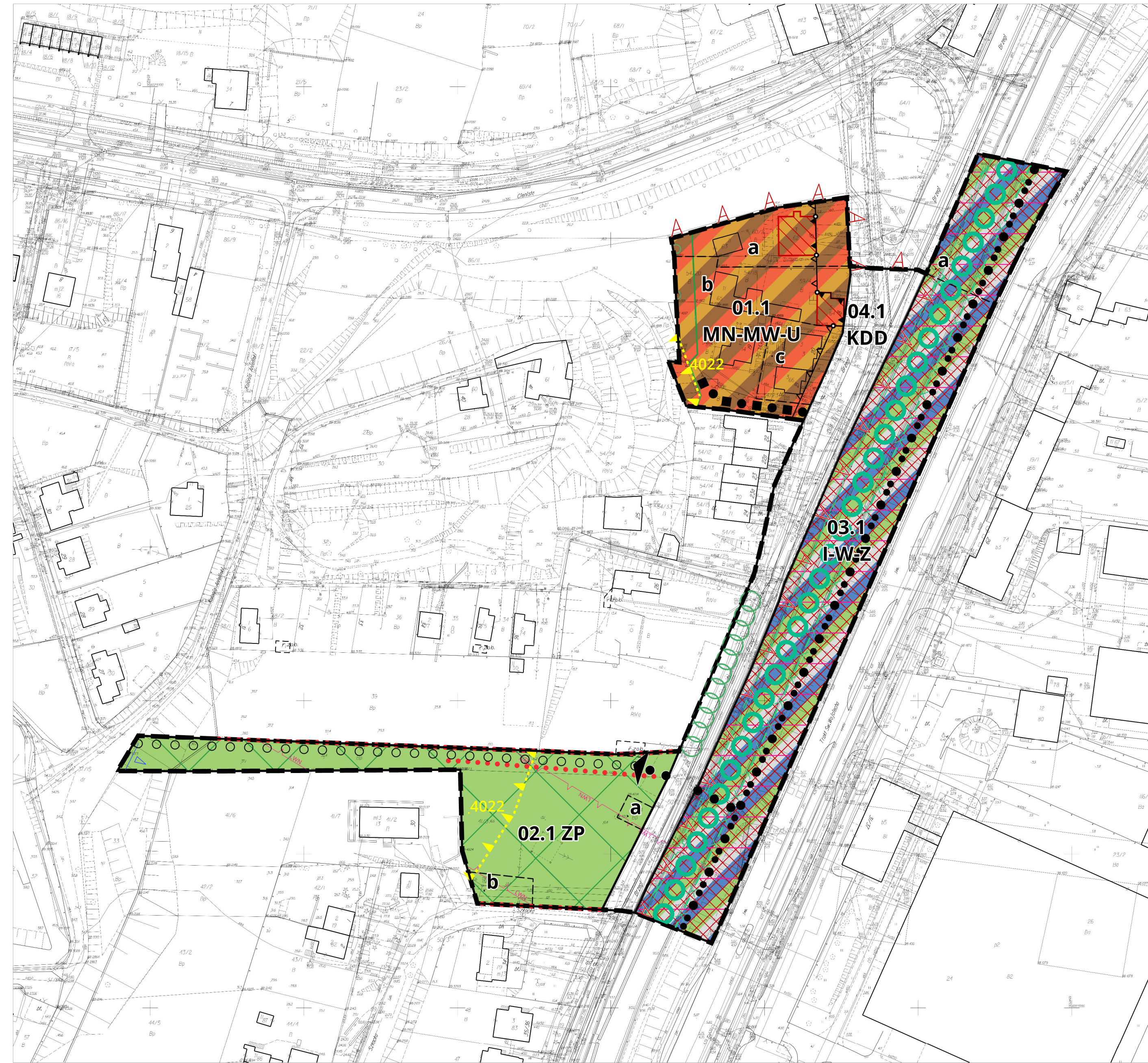
RYSUNEK SPORZĄDZONY W UKŁADZIE WSPÓŁRZĘDNYCH: PL-2000 STREFA 6