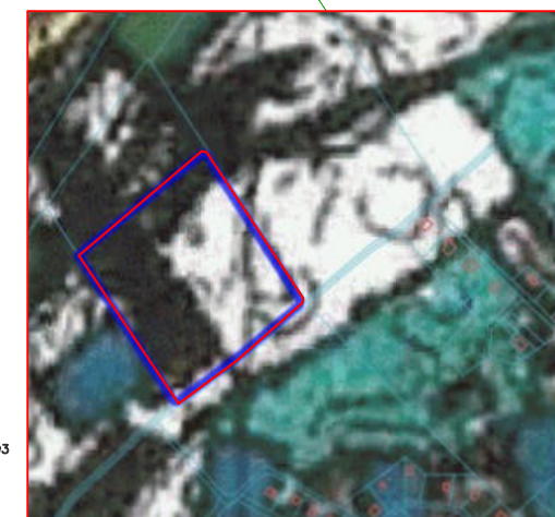
granica obszaru objętego miejscowym planem zagospodarowania przestrzennego