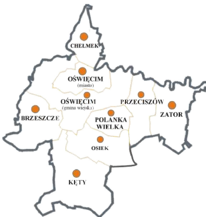
Rysunek 1. Mapa powiatu oświęcimskiego

Powiat Oświęcimski położony jest na granicy Śląska i Małopolski, obejmuje obszar 406 km 2 , zamieszkały przez ok. 155 tys. osób. Należy do najbardziej uprzemysłowionych i zurbanizowanych powiatów Małopolski. Na jego terenie istnieje przemysł chemiczny, metalowy, lekki i wydobywczy. W skład powiatu oświęcimskiego wchodzi 9 jednostek administracyjnych: miasto Oświęcim, gmina wiejska Oświęcim oraz gminy: Chełmek, Brzeszcze, Kęty, Polanka Wielka, Przeciszów, Osiek i Zator.